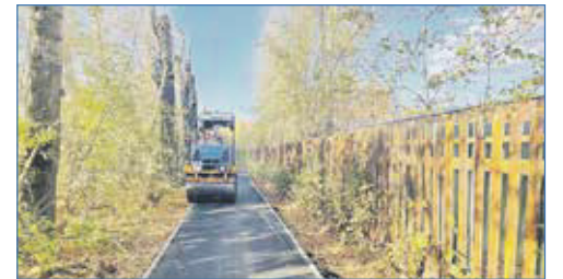
Обустройство дорожки к улице Пархоменко