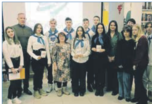
Вручение волонтерских книжек ребятам из движения «Открытое сердце»

Совместно с коллективом библиотеки депутат проводил встречи подростков с местными атлетами под названием