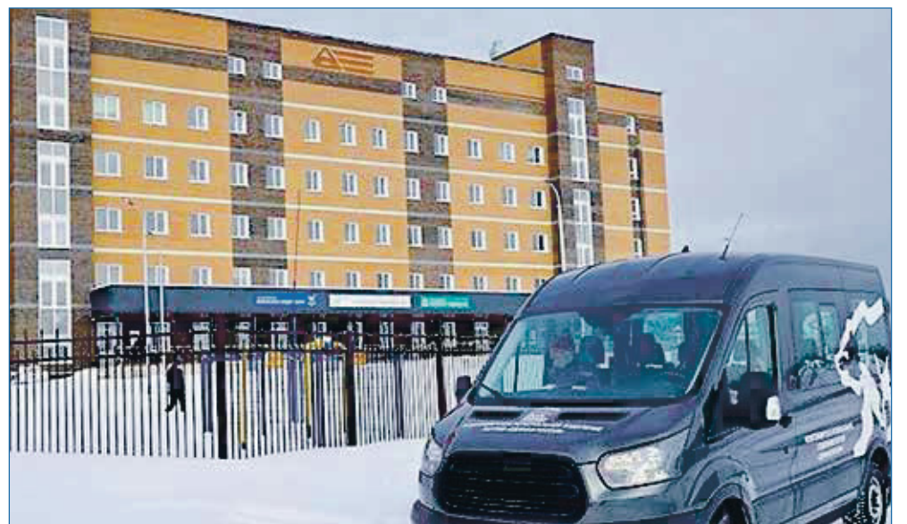
Открытие поликлиники — долгожданное событие для жителей Дивногорского и «Новомарусино»

поликлиника. На недавнем выездном совещании мы увидели, что все сделано: расставлены мебель, техника, смонтировано медицинское оборудование. В ближайшее время люди не будут больше ездить в Троллейный жилмассив, а смогут спокойно получать квалифицированную медицинскую помощь в шаговой доступности от дома. В Западном жилмассиве проведена большая комплексная работа по обрезке деревьев, по благоустройству за счет сэкономленных средств. Например, заасфальтировали тротуар на улице Забалуева. В «Балластном карьере» были выполнены работы по отсыпке и грейдированию дорог, проведено освещение на части улиц. В школе №138 заменены двери, входные группы, полностью отремонтирована отмостка. Для школы №90 были приобретены столы и стулья для столовой — у детей теперь все новое. На улице Станционной, в районе дома №50, совместно с администрацией Ленинского района установили вазоны, скамейки, высадили живую изгородь из сирени — жители очень благодарны. Также оказывали адресную помощь: люди приходят — мы помогаем. Естественно, как всегда, участвовали в организации праздников на округе. В этом году — из нового — отпраздновали во Дворце культуры «Сибтекстильмаш» День отца. Принимаем участие