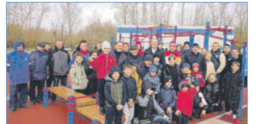
Нормативы ГТО можно сдать на базе центра спортивной подготовки «Заря»

ки ГТО дают дополнительные баллы к ЕГЭ при поступлении в вузы. «Считаю, что Западный жилмассив — достаточно спортивный, и отбоя от желающих не будет», — полагает депутат.