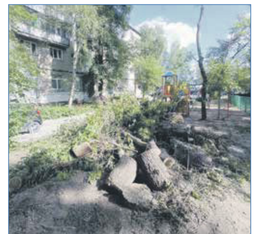
Спил аварийных деревьев во дворе дома №25/1 на улице Фасадной