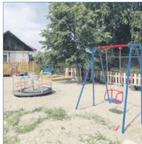
Детская площадка во 2-м Балластном переулке, у дома №86