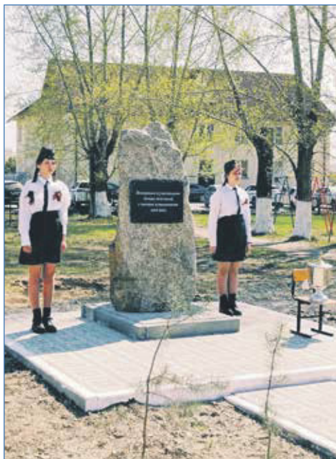
Открытие монумента памяти ветеранам и участникам боевых действий на территории школы №138 в Балластном микрорайоне

страны. Мы уделяем особое внимание работе с молодежью, потому что я понимаю прекрасно, что это наше будущее. Также собирали гуманитарную помощь и медикаменты на базе органов территориального общественного самоуправления через школы и детсады. Собранную помощь в дальнейшем увозили мобилизованным и военнослужащим, находившимся в Новосибирском высшем военном командном училище, в Академгородке. Я понимаю важность этого: чтобы вовлекались дети. Считаю, правильная инициатива, что в школах на законодательном уровне утвердили и поднятие флага, и ис-