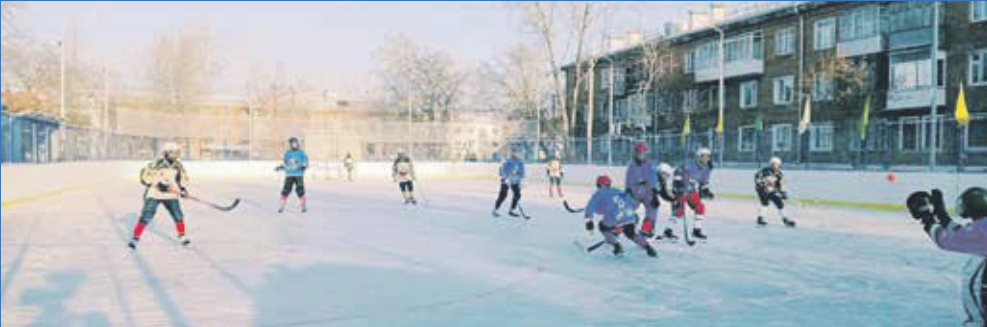
Обновленная хоккейная коробка во дворе дома №24 на улице Халтурина

Кроме того, при участии депутата обновлена хоккейная коробка на территории школы №92 — в Троллинговом жилмассиве. В честь 23 Февраля там прошел традиционный турнир и открытие этой коробки.