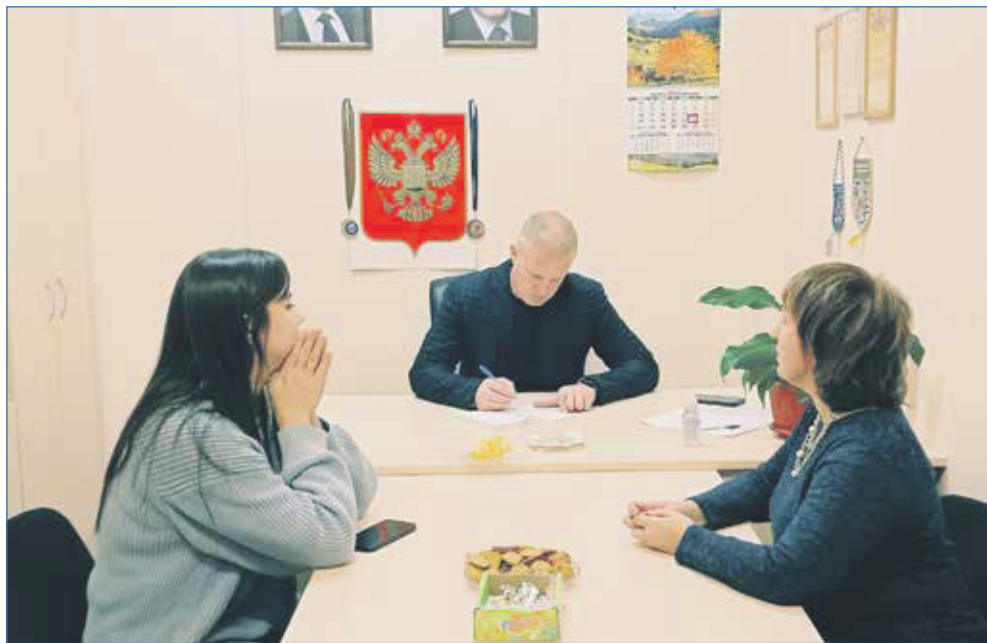
Депутат в ходе личного приема избирателей

— На фоне глобальных событий, которые происходят в мире, мы ведем комплексную работу, организуем патриотические мероприятия для детей в детских садах и школах. Участвуем в различных акциях в памятные дни нашей великой