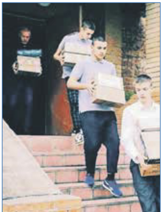
Сбор гуманитарной помощи для участников СВО

— Могу честно сказать, что мне в первый год работы было непросто, и это мотивировало. Человек я амбициозный, и если за что-то братья, то важный результат, эффективность. Не так просто давалось это. Потому что надо взаимодействовать с большим количеством департаментов, управлений мэрии, другими инстанциями. И еще один очень важный момент — общение с людьми. Если ты по-настоящему любишь свою работу, это заряжает. Когда тебе люди начинают верить и у тебя получается им помогать, это дает огромные заряды энергии. Хочется делать больше, больше и больше!..