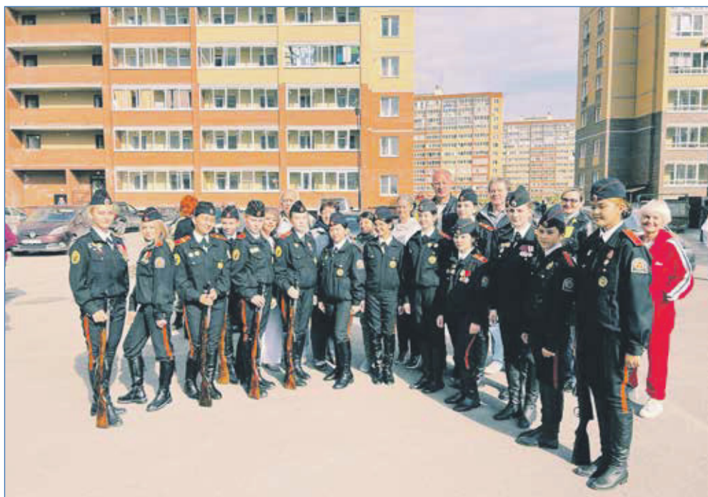
Проведение мероприятия для жителей Дивногорского микрорайона 9 Мая