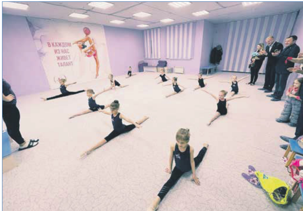
При поддержке депутата открыты два спортивных клуба гимнастики и рукопашного боя в микрорайоне «Новомарусино»