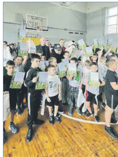
Проведение акции «Посвящение в спортсмены» в МБУ Союз

сдвинулся вопрос по расширению школы в «Балластном карьере», по возведению пристройки, потому что 138-я школа перегружена. В этом году планируется начать работы по ремонту фасада школы №90 — проектно-сметная документация уже готова. Плюс на территории школы есть старый стадион, где стерлись беговые дорожки — его планируем обновить. По детским садам много задач — стараемся их всегда поддерживать. Оборудуем специализированные детские комнаты, помогаем с приобретением различного инвентаря, проводим работы по благоустройству.