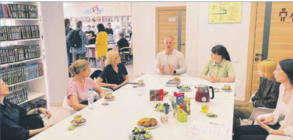
Депутат поддерживает многие акции в библиотеке имени Куйбышева

«Это важно, чтобы волонтерское движение в Западном жилмассиве разрасталось и число его участников росло с каждым днем», — уверен депутат.