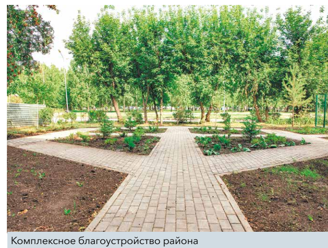
Комплексное благоустройство района