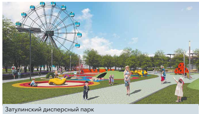
Затулинский дисперсный парк

– Проект, который так активно поддерживали люди, выходит на решающий этап. Проектно-сметная документация уже прошла государственную вневедомственную экспертизу. Сейчас готовятся конкурсные процедуры, в результате которых определится генеральный подрядчик. В этом году будут выполнены первые два этапа благоустройства парка. Работа предстоит масштабная: на общей площади в 4,2 гектара планируется устройство коммуникаций, в том числе ливневой канализации, полная замена электросетей, установка видеонаблюдения и звукового оповещения. Пройдёт озеленение многолетниками и кустарниками, установка малых архитектурных форм и ограждения, освещения территории. Уже осенью Затулинский городок аттракционов и парк «Союз Кировчан» предстанут в своём обновлённом виде. Работы должны начаться ориентировочно в начале мая. Благоустройство Кировского района – одна из ведущих задач, с которой мы шли на выборы в 2015 году. К реализации такого финансово ёмкого проекта, как дисперсный парк, мы подходили размеренно, поэтапно «оживляя» территорию округа. Например, устанавливали спор-