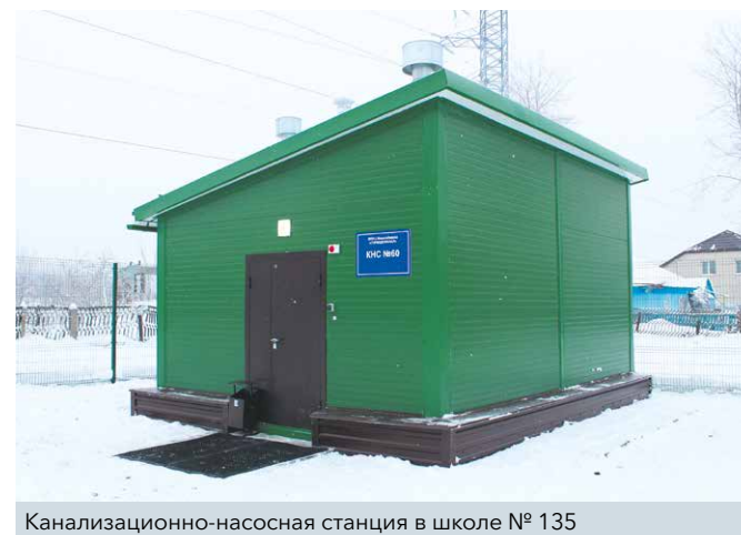
Канализационно-насосная станция в школе № 135