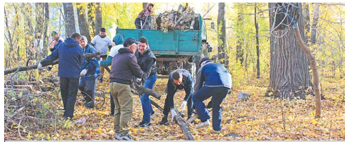
В лесопарке им. Синягина проходят регулярные субботники