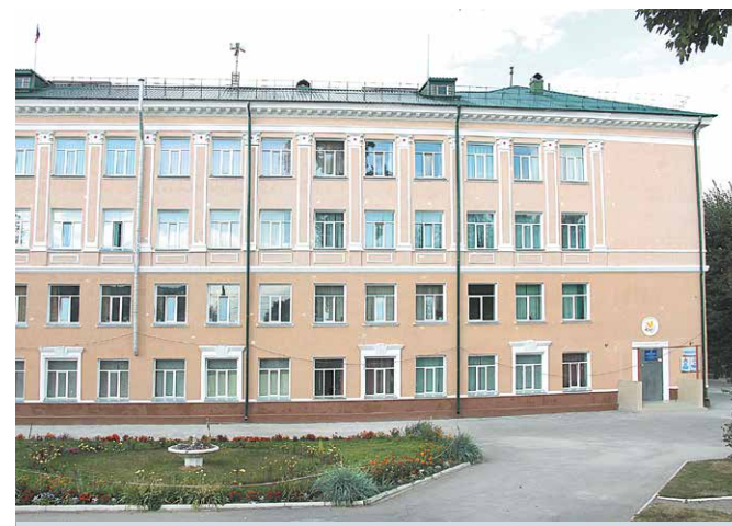
Капитальный ремонт здания и ограждения сделаны в школе № 47 по наказам депутату