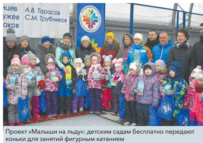
Проект «Малыши на льду»: детским садам бесплатно передают коньки для занятий фигурным катанием

– На территории Кировки не первый год действует программа «Малыши на льду»: воспитанники детских садов в прямом смысле получают шанс стать фигуристами уже с самых ранних лет. Чтобы попробовать свои силы на льду мог любой ребёнок независимо от благосостояния семьи, детские сады каждый год получают в подарок от нашего депутатского корпуса коньки: всего было передано прядка 500 пар для юных спортсменок. Детям их выдают на время тренировок, которые проходят каждую неделю – в дошкольные учреждения приходят тренеры школы фигурного катания им. В. Н. Кудрявцева. Инструкторы осенью и весной проводят разминки в спортивном зале, а зимой выводят детей непосредственно на лёд. Занимаются со всеми – было бы желание ребёнка и родителей. Тех, кто во время тренировок хорошо себя показывает, рекомендуют к занятиям в спортивных школах фигурного катания. Уже есть примеры тех, кто после сада продолжил тренировки. Проект стал возможен благодаря совместной работе фонда «Общее дело», Федерации фигурного катания НСО и МБУ «Спортивный город». Нашу идею также поддержали в мэрии Новосибирска и районной администрации.