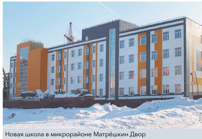
Новая школа в микрорайоне Матрёшкин Двор

730 млн рублей составила общая стоимость объекта