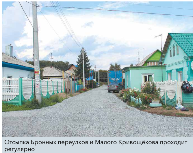
Отсыпка Бронных переулков и Малого Кривощёкова проходит регулярно

на составление проектно-сметной документации и строительство дренажной системы для отвода грунтовых вод. На решение этой задачи требуются десятки миллионов рублей. К сожалению, изыскать такие средства в сжатые сроки не представляется возможным. Но над этим вопросом трудится весь депутатский корпус Кировского района, и уже сейчас разрабатывается комплексный план мероприятий по решению поставленной задачи.