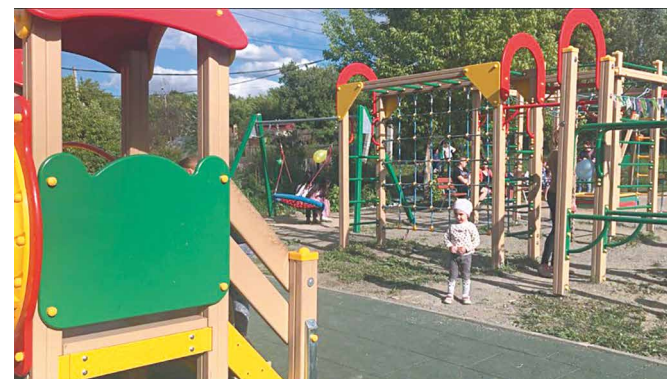
Благоустройство частного сектора – детская и спортивная площадка в Чукотских переулках

– Планируем сделать максимум. В первую очередь продолжать активно благоустраивать Кировский район. Завершить выполнение первого этапа работ по обустройству дисперсного парка. В планах – продолжить работу с социальной инфраструктурой: начинаем строительство двух новых поликлиник. На повестке остаётся вопрос транспортной доступности. Несмотря на то что это требует больших финансовых вложений, я верю, что нам удастся его решить.