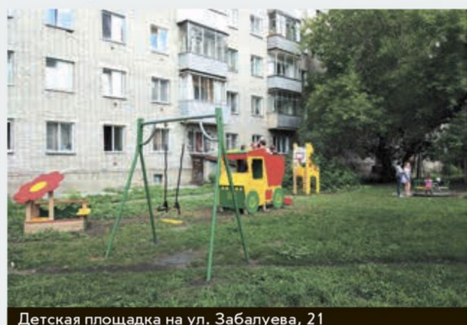
Детская площадка на ул. Забалуева, 21