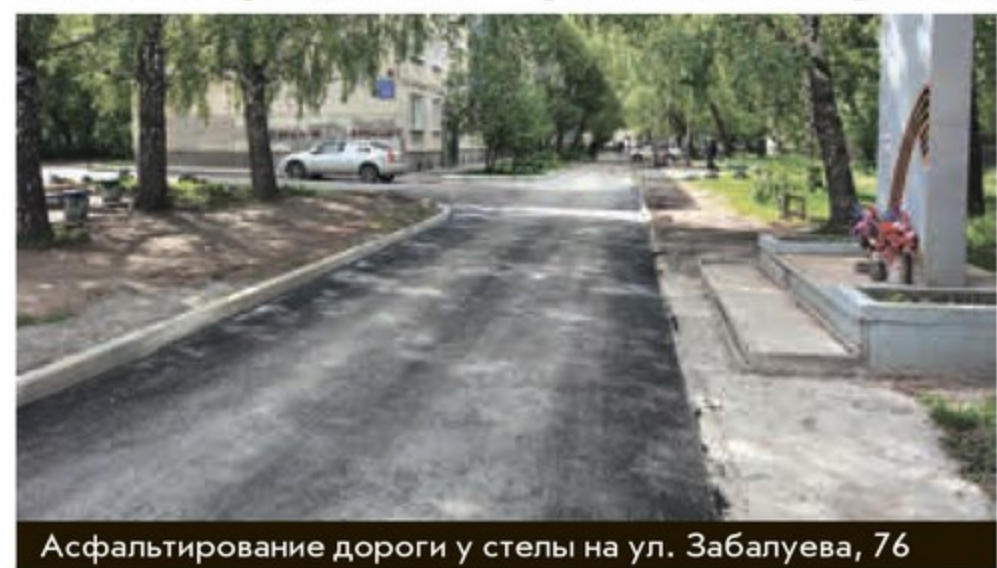
Асфальтирование дороги у стелы на ул. Забалуева, 76

пройти срочную реабилитацию, установить пандус для людей с ограниченными возможностями в школе № 90, поставить футбольные ворота и защитную сетку во дворе по ул. Спортивной, 11/1, предоставить машины и инвентарь для вывоза мусора, веток, листвы на субботниках, проходящих в октябре и мае,