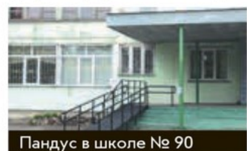
Пандус в школе № 90

дящихся в сложной жизненной ситуации по состоянию здоровья, а детям-инвалидам