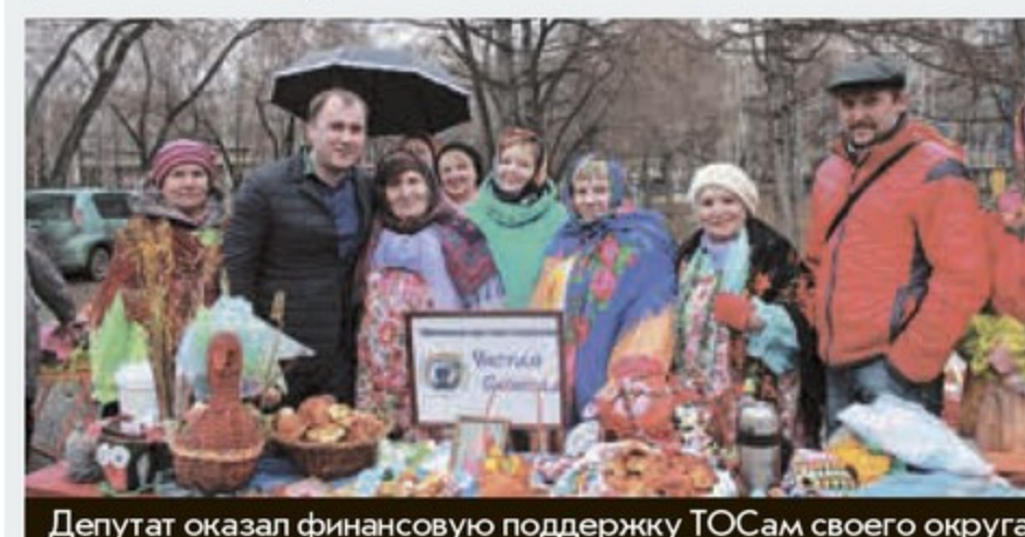
Депутат оказал финансовую поддержку ТОСам своего округа

Важнейшим для округа событием уходящего года стало начало строительства школы в микрорайоне «Чистая Слобода». Учреждение вошло в федеральную программу «Содействие созданию в субъектах РФ новых мест в общеобразовательных организациях».