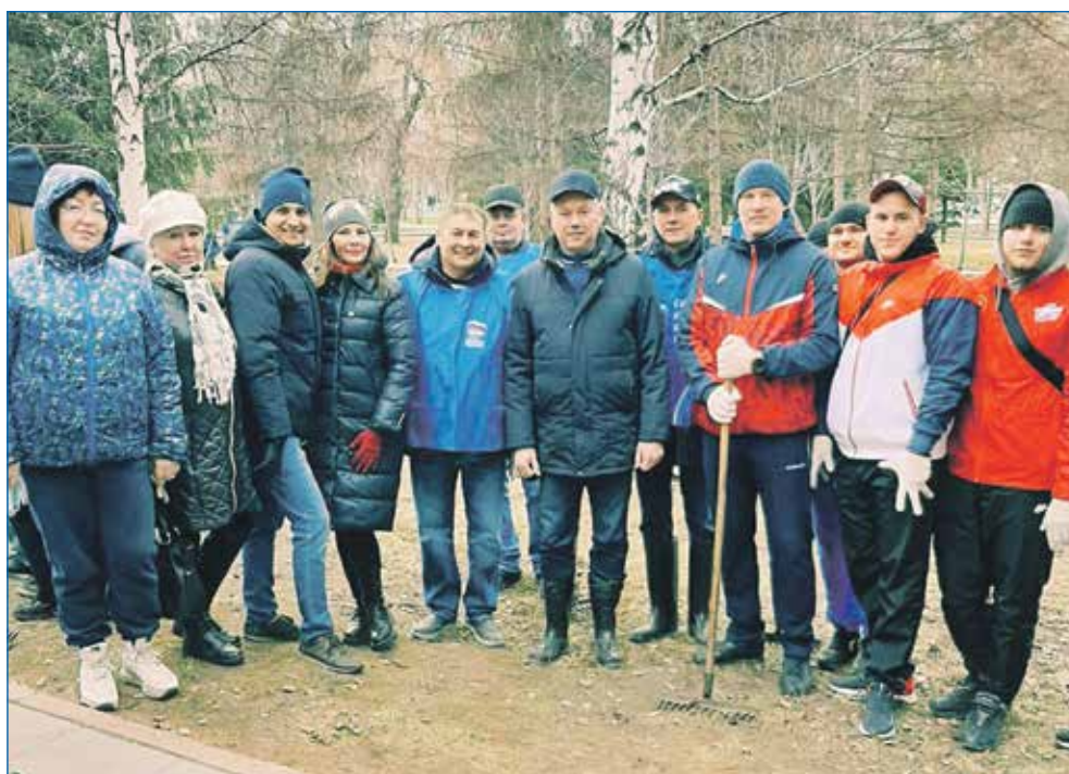
С губернатором на городском субботнике

— Какие общегородские проблемы, на ваш взгляд, сегодня особенно актуальны?