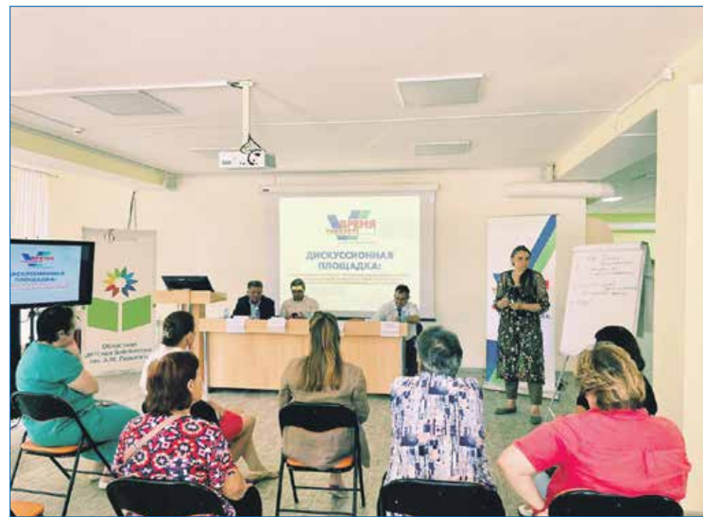
Работа дискуссионной площадки на тему реконструкции и строительства дошкольных и школьных учреждений

— Главный смысл в моей работе — честно выполнять свое дело, отстаивать интересы людей, которые мне доверяют. Являясь