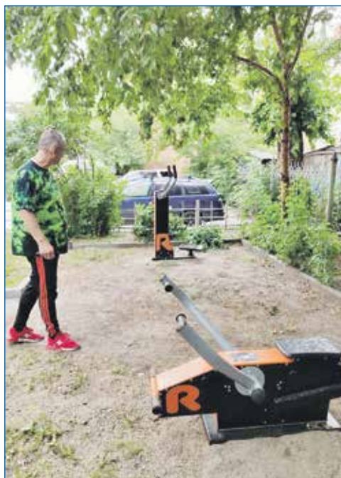
На ул. О. Жилиной, 73/1, установлены спортивные элементы