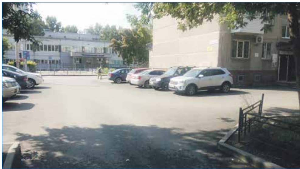
Асфальтирование ул. Крылова, 55