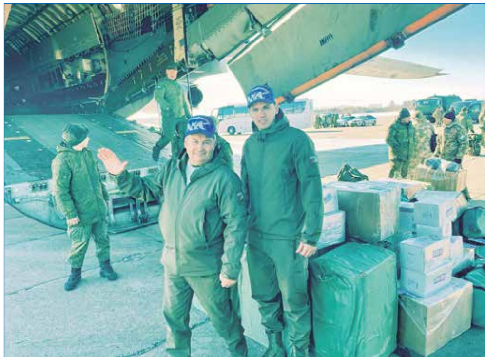
Доставка гуманитарной помощи в зону СВО