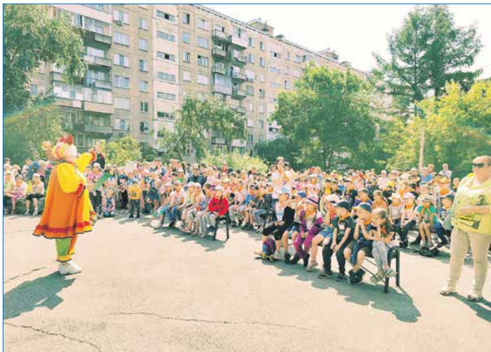
Праздник на площадке «Петрушка» привлек более трехсот детей