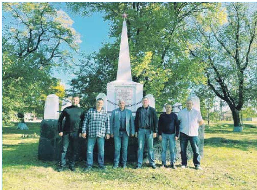
Возле мемориала героям в Городище ЛНР

он там необходим, надо отправить. Пришел в один из банков города, как депутат, как секретарь местного отделения партии «Единая Россия», говорю, помогите, давайте хотя бы разделим сумму. Меня не услышали. В ответ прозвучало что-то такое: ой, да мы там в Москве... что-то там у нас. И я понял, не стоит зря терять время в поисках помощи. Все, что нами отправляется, мы или делаем сами, или покупаем сами. Покупаем компьютеры, бензопилы, кувалды. Потому что мне не все равно. И тем, с кем я работаю, тоже не все равно. Стараюсь на работе донести важность на-