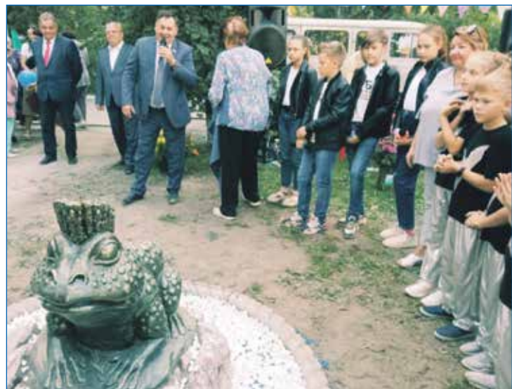
Лягушка стала символом двора на ул. Крылова, 53