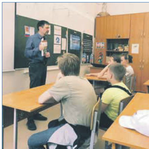
Урок мужества для детей в СОШ №3 им. Б. Богаткова

Еще один нерешенный вопрос — это автобус №67, который совсем недавно курсировал по центру Новосибирска. Городские власти считают, что этот маршрут нерентабелен. Однако я считаю, что нельзя мерить все эконо-