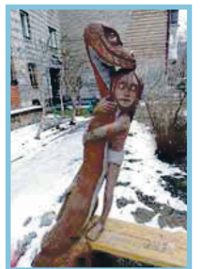
3. Сибирская, 46, — резная скульптура «Маугли»