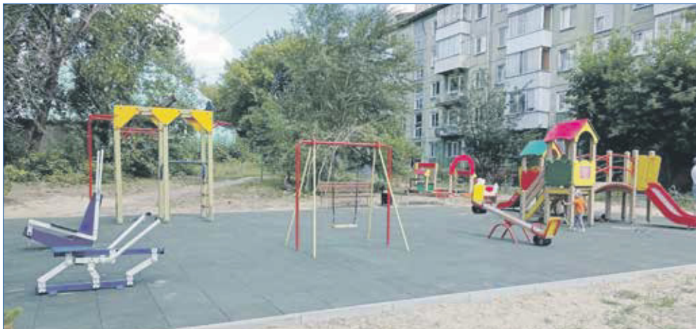
Начало реализации проекта благоустройства двора дома №9 по улице Владимирская