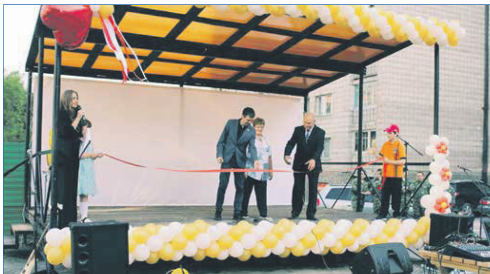
Открытие сцены для проведения мероприятий во дворе дома №3а по улице Владимирская