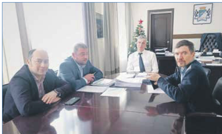
Совещание в департаменте транспорта и дорожно-благоустроительного комплекса мэрии

Если говорить о более долгосрочных планах — это доделать сквер Михеева и решить вопрос вечных луж у памятника композитору Глинке возле Консерватории на улице Советской. Сейчас ведется работа по утверждению проекта и последующей реконструкции всей этой площадки. Необходимо начать работу по благоустройству сквера на улице Фабричной и начать благоустройство сквера возле лицея «Надежда Сибири» — для этого мы будем искать партнеров. Планов много — округу есть куда развиваться.