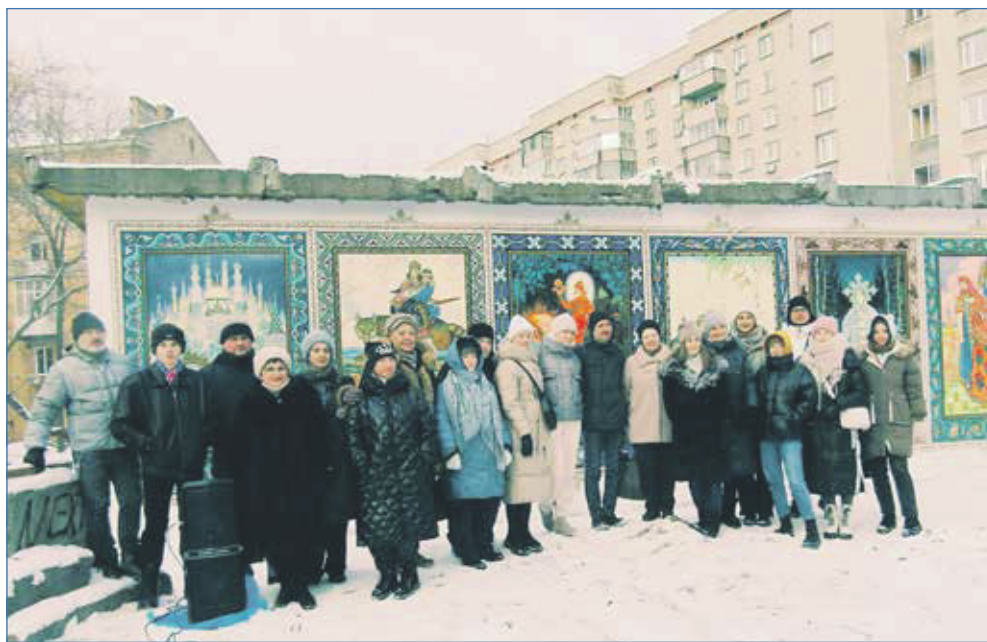
Итоговое событие «Открытие промежуточного этапа благоустройства сквера «Сказочный»

мической целесообразностью, нужно исходить из того, что будет удобнее людям. На нашем округе живет немало пожилых людей, для которых важно быть мобильными и иметь возможность быстро добраться до нужного места. Таким образом, этот маршрут решал, прежде всего, социальную проблему. Сейчас мы ведем очень тяжелый спор с департаментом транспорта мэрии на предмет возобновления маршрута. Пока мы уперлись в стену непонимания со стороны чиновников.