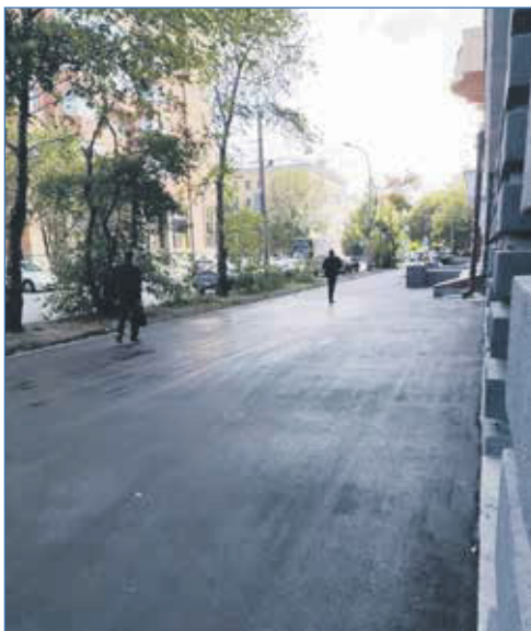
Асфальтирование тротуара возле дома №17 по улице Урицкого