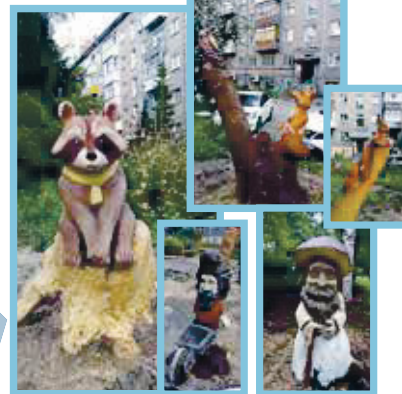
5. Ленина, 30/2, — резные скульптуры «Сказочный дворик»