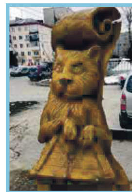
2. Сибирская, 33, — резная скульптура «Кот»