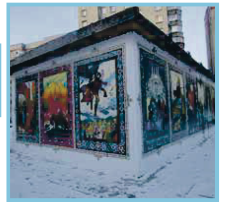
6. Ленина, 50, — репродукции работ советских художников, урбан-фреска