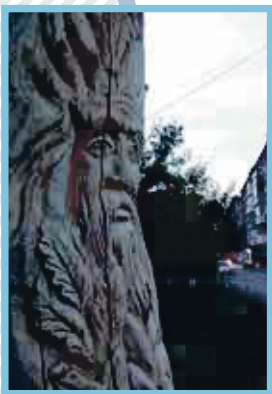
4. Владимировская, 1, — декоративное сооружение «Велес — дух леса»