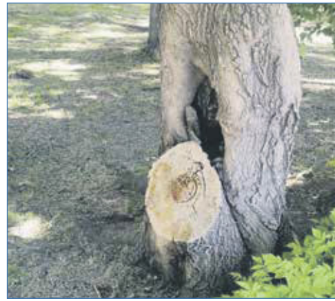
По обращению Гимназии №15 были выделены средства на спил аварийных деревьев