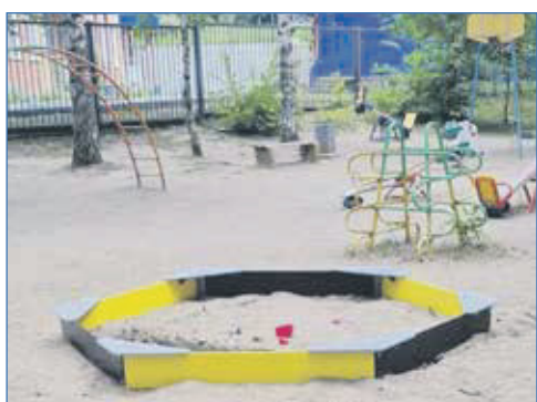
По улице Кошурникова, 29/1, установлены песочница и скамейка