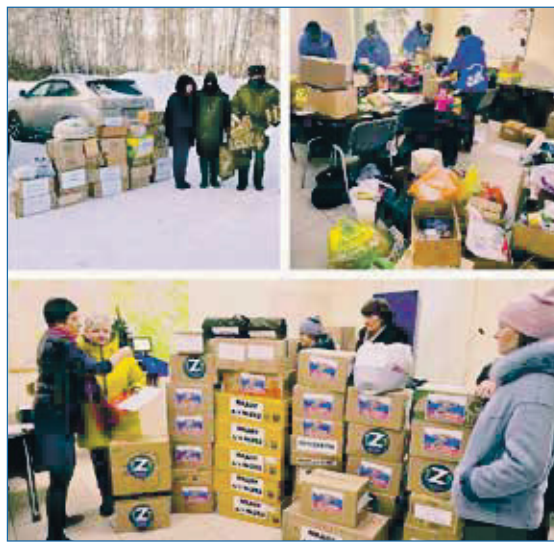
Работа волонтерских объединений