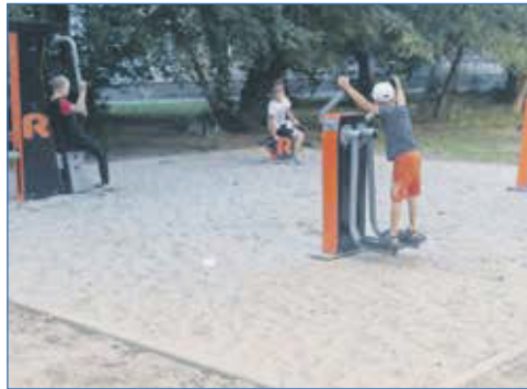
Во дворе дома Кошурникова, 39, установлены тренажеры