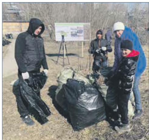
Всей командой в субботу вышли по инициативе Регионального отделения партии

2023 год обещает быть не менее напряженным, наполненным новыми событиями, требующими от нас еще более ответственного, инициативного подхода к своей деятельности и напряженного труда, но мы к этому готовы.