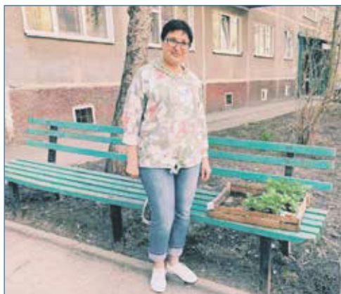
Благоустройство продолжается. Выдаем рассаду цветов