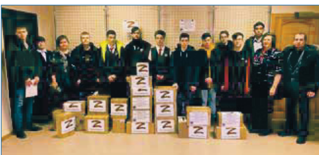
В России сложное время, идет спецоперация на Украине