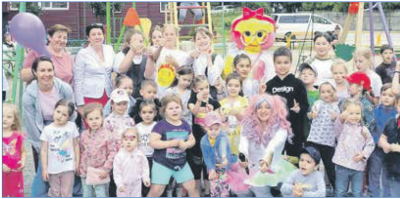
День защиты детей

21 августа в парке культуры и отдыха «Березовая роща» состоялось праздничное мероприятие, посвященное Дню Государственного флага Российской Федерации. На одной площадке перед сценой собрались жители, общественные