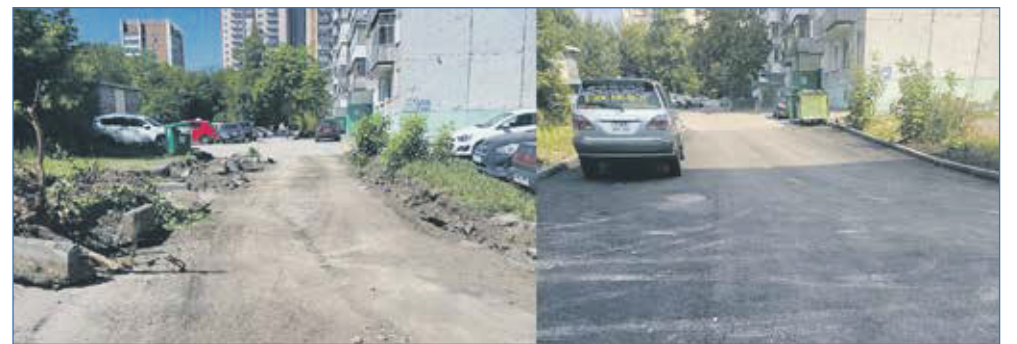
Ремонт дорожного покрытия во дворе дома по адресу Фрунзе, 59/1