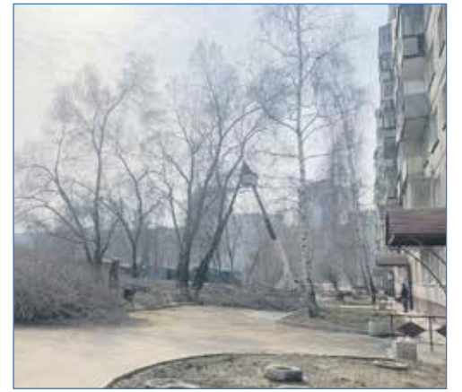
По обращению граждан дома №65 по улице Фрунзе выделены средства на спил деревьев