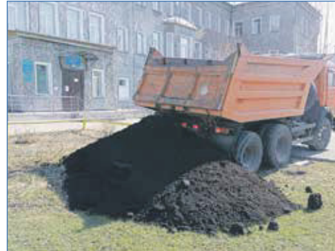
По обращению городской клинической больницы №12 к депутату ГД РФ Д. И. Савельеву привезли землю для благоустройства территории