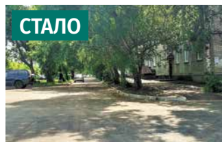
Территория у дома по ул. Филатова, 11