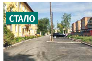
Территория у дома по ул. Халтурина, 37/2