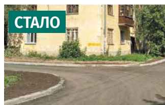
Территория у дома по ул. Халтурина, 37