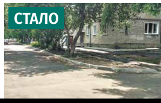
Территория у дома по ул. Филатова, 13