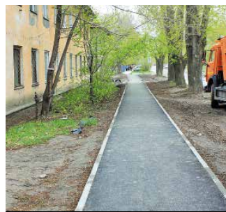
Тротуар по ул. Пархоменко

• Благоустроены дворовые территории у домов: ул. Филатова, 11 и 13, ул. Забалуева, 21/1. Там заасфальтировали дороги, устроили парковочные карманы и тротуары.