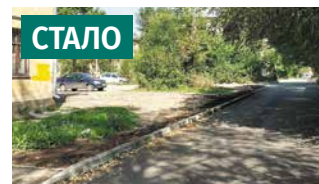
Территория у дома по ул. Халтурина, 37/1