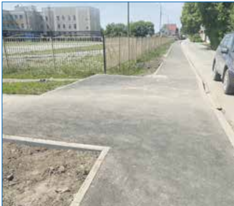
Тротуар возле школы 67 — своего рода «дорога жизни» для многих детей и взрослых. Летом 2023 года исполнен наказ избирателей по ремонту этой пешеходной дорожки