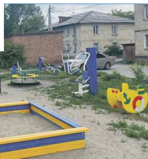
По наказам избирателей летом 2023 года была дополнена новыми игровыми элементами детская площадка во дворе дома №65/1 на улице Амурской

— Спил ветхих деревьев на территории дома №40/2 на улице Южной