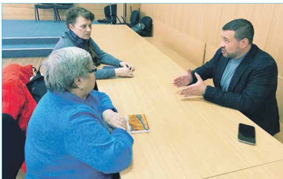
Избиратели на личном приеме у депутата

— Многие знают, что в Ленинском районе большая проблема с транспортными развязками. Микрорайон «Чистая Слобода» растет — это хорошо. Но дороги, проезжая часть для автомобилей не позволяет двигаться в комфортных условиях, без пробок. Понимаю, что расширение улицы Титова — крайне финансово емкий проект. У меня в наказах избирателей,