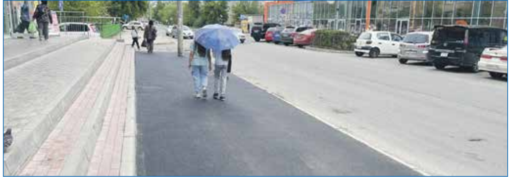
Жители улицы Новосибирской жаловались на скользкую тротуарную плитку, и летом 2023 года ее заменили на новенький асфальт

— Выравнивание и отсыпка дороги на улице Южной — от дома №42 до дома №119