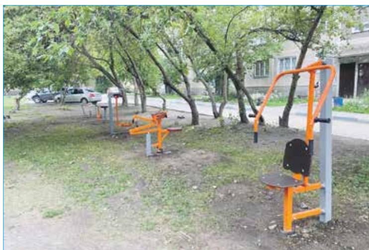
Исполнение наказа избирателей по обустройству спортивной площадки во дворе дома №23 на улице Новосибирской

— Жалобы на недолжное реагирование участковых. Распитие спиртных напитков, ночной шум, хулиганство. В состоянии алкогольного опьянения угрожают соседям и прохожим. Почему-то участковые слабо реагируют на эти ситуации. Я много раз пытался самостоятельно до них достучаться — не получается. Уже и к руководству полиции Ленинского района обращался. Также есть бытовые обращения граждан: в зимний период времени — это освещение частного сектора, уборка снега. Что касается сферы ЖКХ, люди обращаются, но у нас на округе