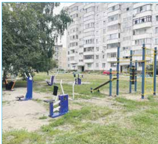
Спортивная площадка на улице Новосибирской, 19, построенная на средства бюджетных ассигнований