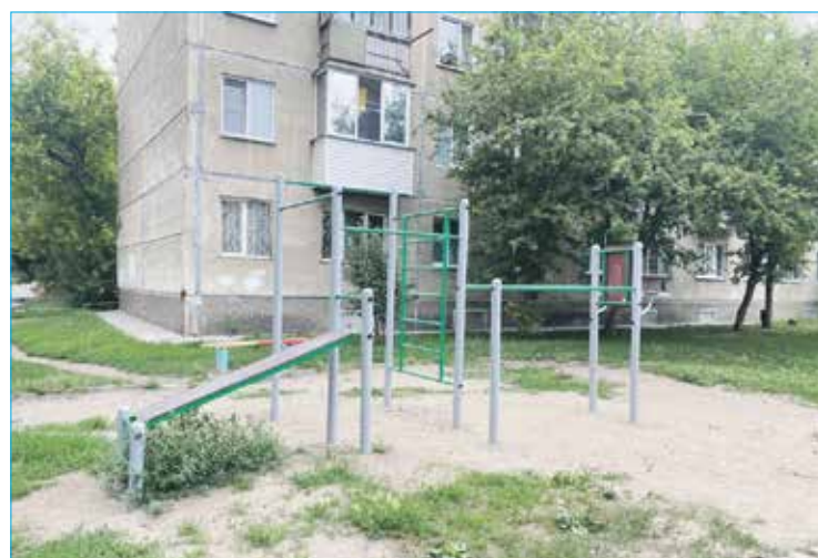
Во дворе дома №9 на улице Новосибирской установлен в этом году по просьбе жителей дома спортивный комплекс

управляющие компании довольно быстро реагируют и принимают меры. Регулярно обращаются родители школьников и коллективы школ — ведем замену окон. Также постоянно помогаем патриотическим отрядам школ. Например, в школе №67 есть прекрасный патриотический отряд «Корсары» — ребята каждый год отправляются на раскопки полей сражений Великой Отечественной войны. Мы ежегодно оказываем поддержку для поездок детей. Во многих школах нашего округа действует Юнармия. Также оказываем им поддержку: в приобретении формы, в организации выездов.