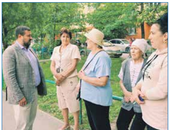
В рамках проекта «Территория детства» во дворе 16-подъездного дома №74 на улице Плеханова летом 2023 года идет обустройство детской площадки