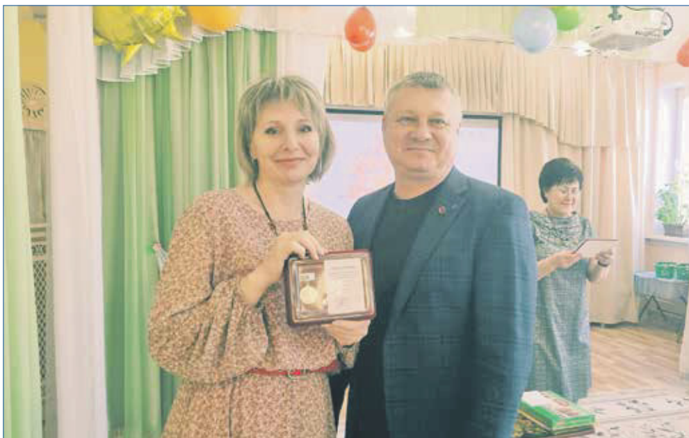
Награды и благодарности сотрудникам детского сада