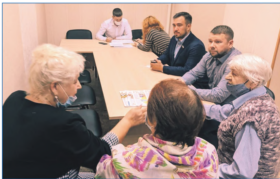
Мнение избирателей — главная опора в работе депутата

В настоящий момент в Дзержинском районе города Новосибирска идет активная застройка индивидуальными жилыми домами по ул. Полякова, Чемпионская, Спринтерская, Виктора Звонарева, Павла Кондратенко, Антона Осташева, Биатлонная, Летчика Петрова, а также Новосибирского района Новосибирской области (поселка Восход и села Каменка). Указанный участок проспекта