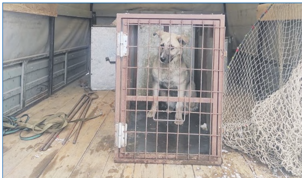
Пойманная собака и сети для ловли

му искоренять, потому что был сигнал — перед Новым годом школьника покусали на Доватора, 53/1, ребенку порвали одежду.