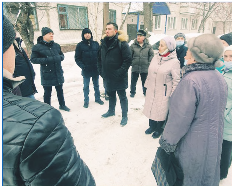
Самые острые вопросы решаются на месте, а не в кабинетах

— То есть, если говорить о точечной застройке, то одна про-