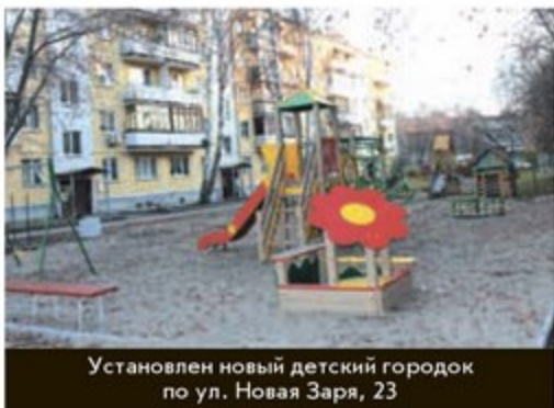
Установлен новый детский городок по ул. Новая Заря, 23