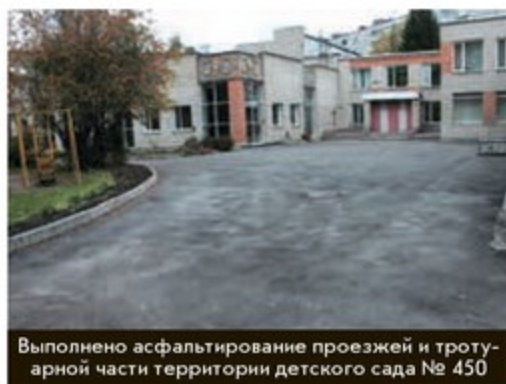
Выполнено асфальтирование проезжей и тротуарной части территории детского сада № 450