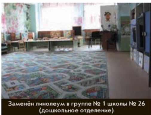
Заменён линолеум в группе № 1 школы № 26 (дошкольное отделение)