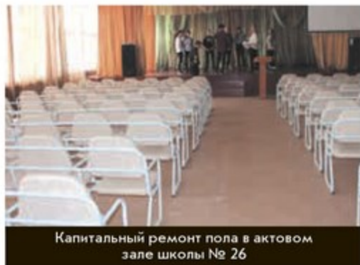
Капитальный ремонт пола в актовом зале школы № 26