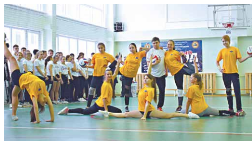
Спортзал в школе № 196 после капитального ремонта

Также из крупных наказов, исполненных в 2019 году, можно отметить ремонт спортивного зала в школе № 196. В течение нескольких лет помещение было в аварийном состоянии. Теперь зал соответствует всем современным нормам – сделали вентиляцию, поменяли окна, на полу новый материал – спортивный линолеум, оборудованы душевые и раздевалки. Всего на эти цели потрачено около 3 млн рублей. Наказ был запланирован на 2020 год, но удалось добиться его реализации раньше. Школа состоит из двух блоков – для младших и старших классов, в каждом из которых должен быть свой спортивный игровой зал.