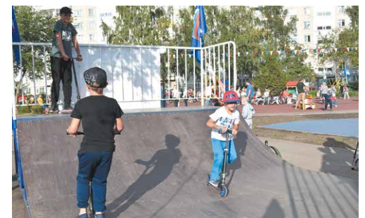
Площадка для скейтбордистов

В Кировском районе часто поднимается вопрос о развитии транспортной инфраструктуры. Меняется ли что-то в этом направлении?