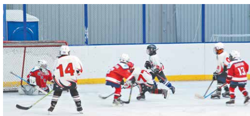
В новом модуле рядом со спорткомплексом на ул. Саввы Кожевникова, 3 оборудованы тёплые раздевалки, душевые, также для занятий детей приобретается спортивная экипировка

Среди частых запросов остаётся установка детских городков, освещение частного сектора, обрезка деревьев, оборудование тротуаров и пешеходных дорожек к магазинам и остановкам. Всё должно быть цивилизованно и удобно.