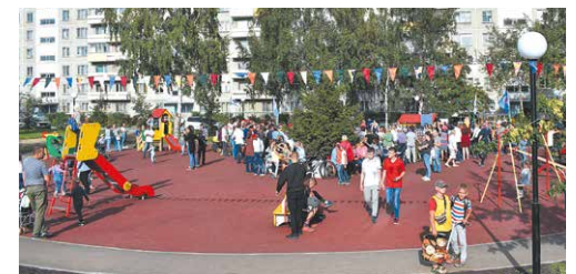
«Комфортная среда» на ул. Саввы Кожевникова, 11, 13-15

В рамках программы были сделаны несколько крупных городских объектов: новая Михайловская набережная, в благоустройство которой вложено около 300 млн рублей. Конечно же, Монумент Славы. В 2020–2021 годах начнётся благоустройство дисперсного парка на Затулинке. Считаю, что возможность лоббировать такие проекты при партийной поддержке – отличное подспорье в работе и в достижении больших целей. Это реальная польза и конкретный результат для людей.