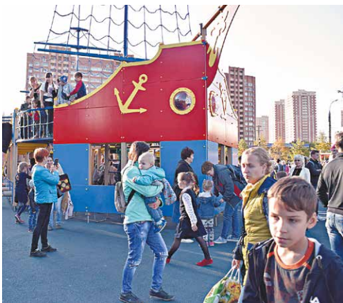
«Кораблик» после реконструкции

ластной больнице, собирали подписи людей, которые передали губернатору. В связи с массовой застройкой района в ближайшее время население увеличится почти в два раза. При этом на его территории всего три поликлиники, которые уже работают с колоссальной нагрузкой. Нам всё-таки удалось совместными усилиями добиться того, что из семи поликлиник, которые будут построены в ближайшее время в городе, две в нашем районе! И строительство начнётся уже в этом году. Срок реализации проекта рассчитан на два-три года. За это время будут построены здания лечебных учреждений, пройдёт оснащение оборудованием и другие плановые мероприятия. Ждать, надеемся, осталось недолго.