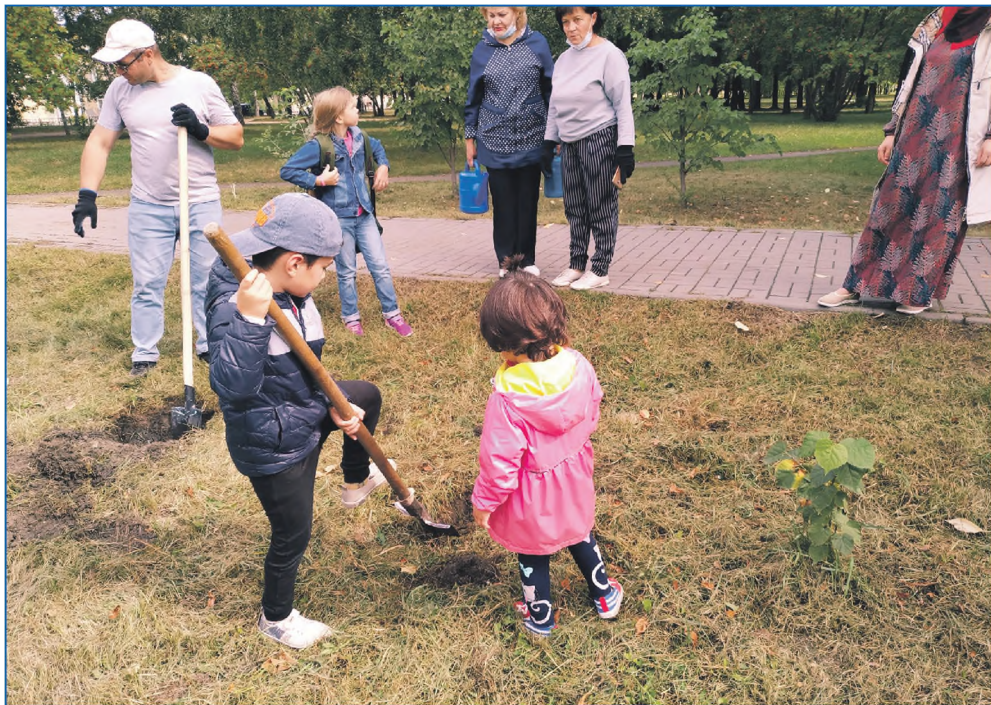
Даже малыши помогают округу преображаться

Озеленение на округе продолжится и в этом году. Также планируется сделать пешеходные дорожки и построить скейт-парк в Троицком сквере.