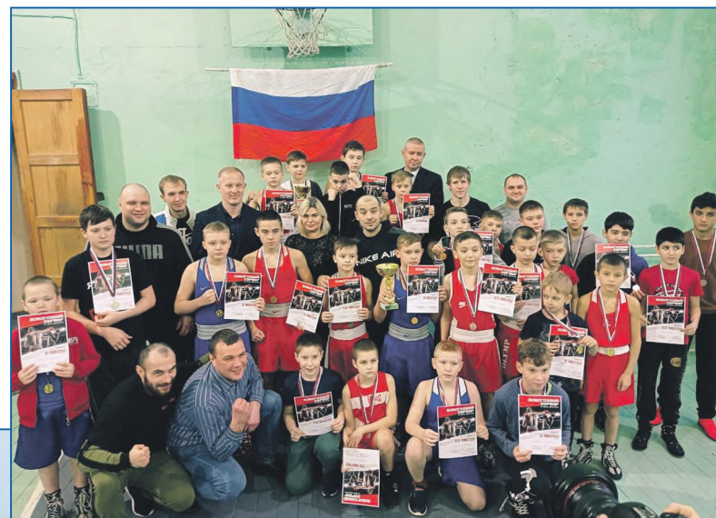
Любимая работа — воспитывать чемпионов!

— Как проходит работа в комиссиях, какие вопросы рассматриваете, как влияют ваши выводы на работу горсовета?