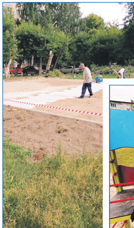
Был пустырь, а стала современная спортивно-игровая площадка