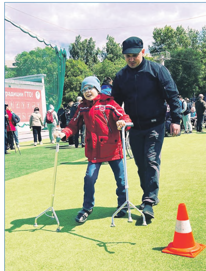
Развитие адаптивных видов спорта — сегодня один из главных трендов

ных видов спорта. Совместно с новосибирским отделением Всероссийской организации родителей детей-инвалидов в июне и декабре был проведен праздник «Спорт без границ» с целью привлечь ребятишек с ограниченными возможностями здоровья к занятиям спортом.