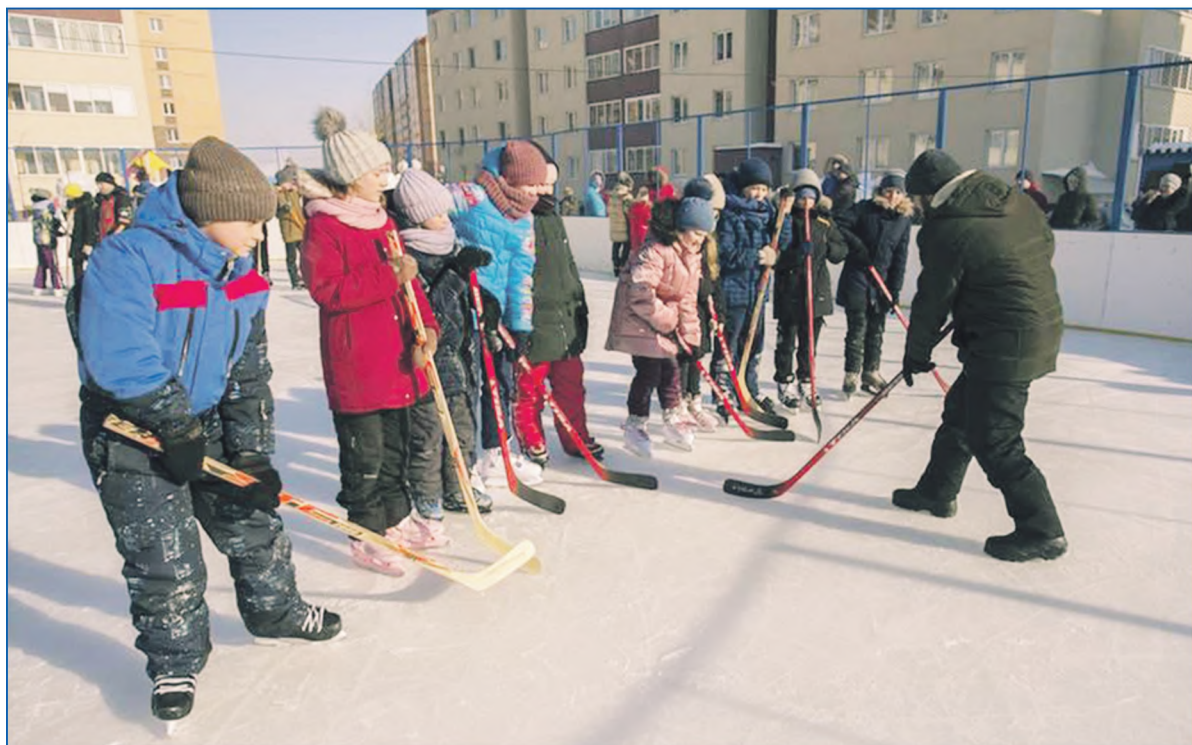
Поддержка детей и молодежи — один из наших приоритетов

Умение слышать и понимать людей, которые доверили мне представлять их интересы, — суть работы депутата. Это не так сложно, как кажется! Главное понять, какие потребности основные на округе, и проинформировать об этом жителей. Общение с избирателями меня заряжает энергией, а проблемы мотивируют на их решение.