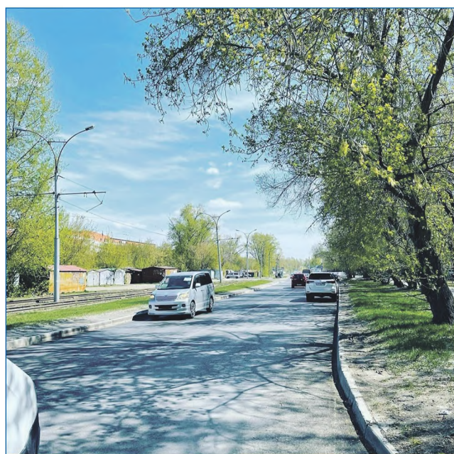
Улицу Широкую привели в порядок

Работы были завершены на год раньше заявленного срока, изначально ввод объекта в эксплуатацию был назначен на октябрь 2022 года.