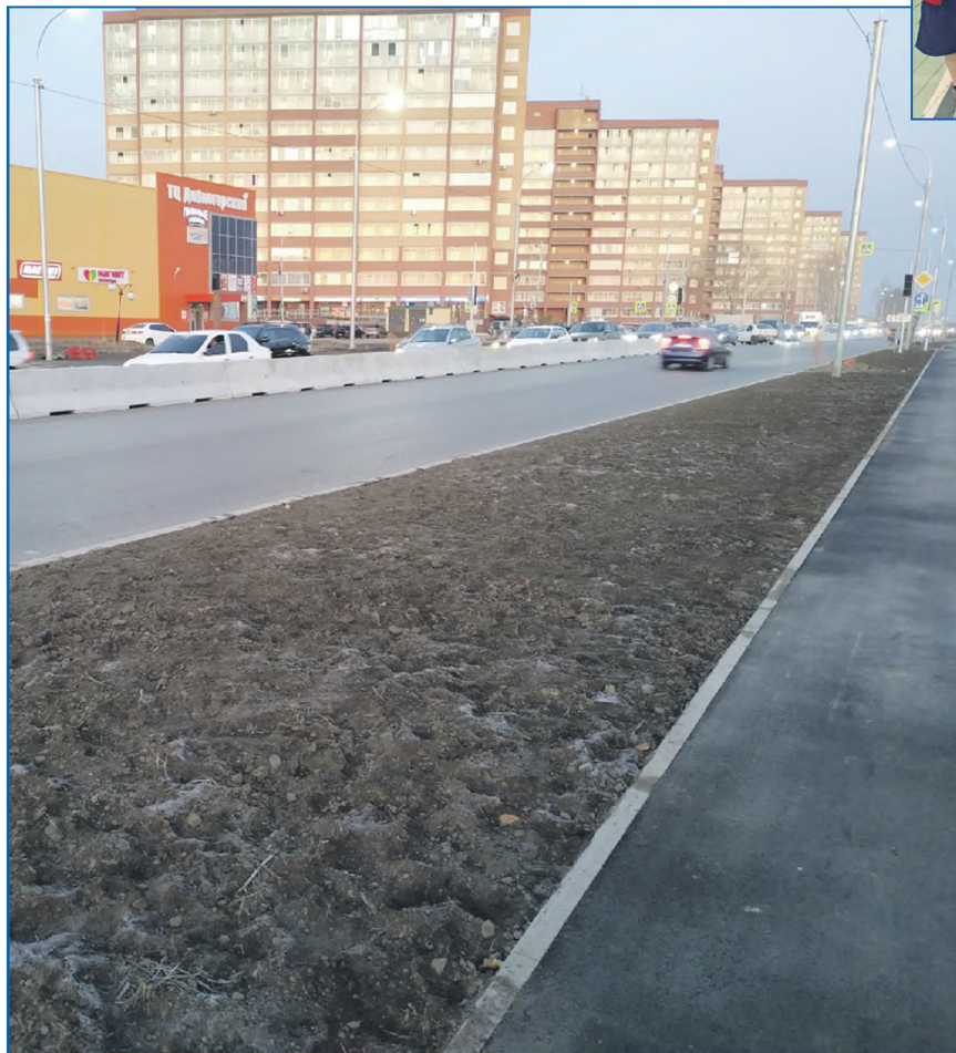
Опережаем план по ремонту дорог

— Жители округа регулярно обращаются с просьбами. Это и оказание адресной помощи, и аварийный спил деревьев, и установка малых архитектурных форм на придомовых территориях. На выполнение таких обраще-