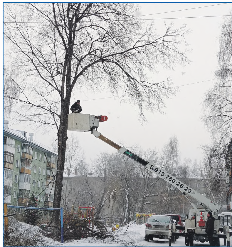
Спил и обрезка аварийных деревьев проводятся на округе регулярно

В 2015 году у меня была возможность принять участие в предвыборной кампании по приглашению друзей. В этот год я получил первый опыт одновременно от победы одного кандидата и поражения другого. Этот опыт оста-