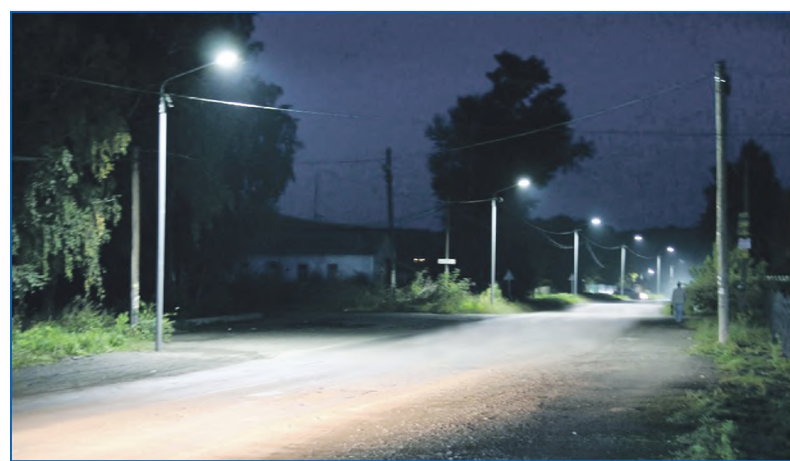
Больше света Балластному карьеру!

«Уличное освещение предназначено для того, что-