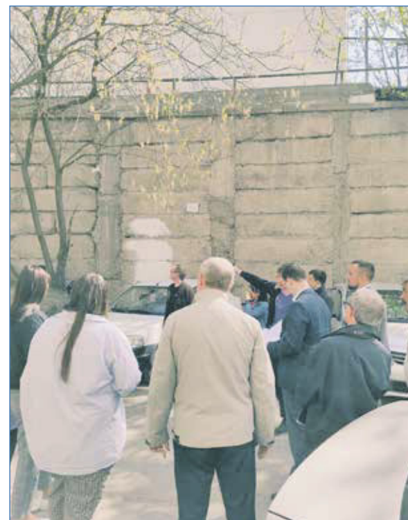
Инспекция аварийной стены на Есенина, 12

подвалы — порой вода была по пояс взрослому человеку.