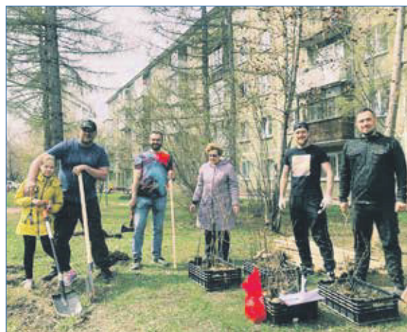
2022 г. Работа во дворах на Есенина и Куприна