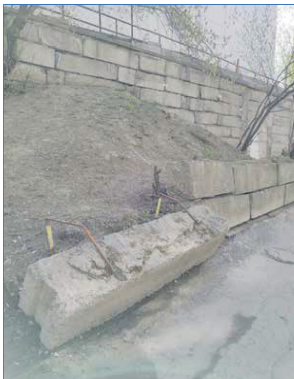
Стена на Есенина, 12, постепенно разрушается

Упомянутая выше проблема отведения грунтовых вод крайне актуальна для дома на Есенина, 12, из-за изменения их движения на этом участке постоянно прорывались водопроводные трубы, затопляло