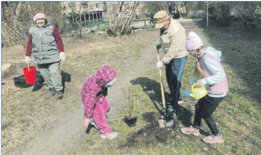
2022 г. И стар и млад