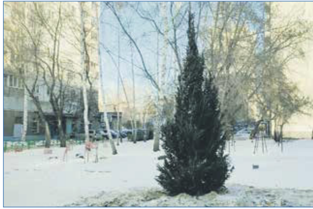
2022 г. Высаживаем и ели. Прекрасная возможность встретить Новый год во дворе