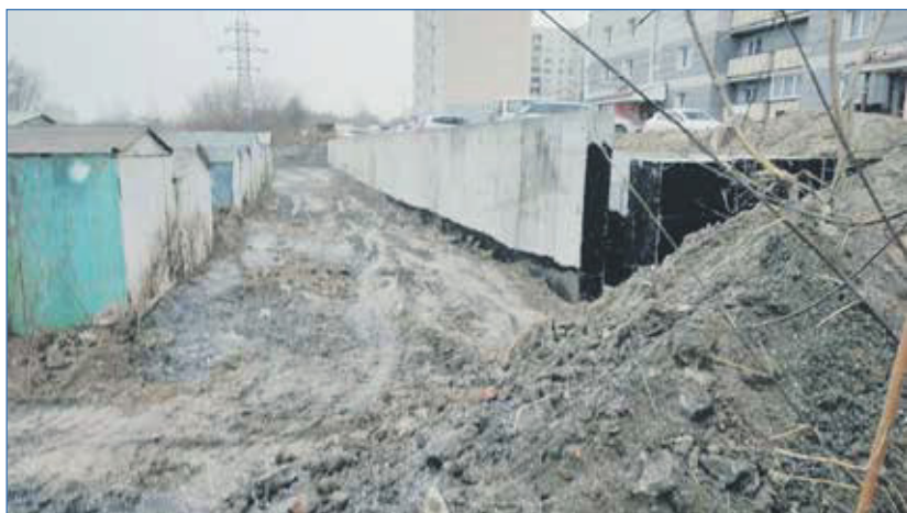
Бросили работу — не доделали стену на Есенина, 8/6