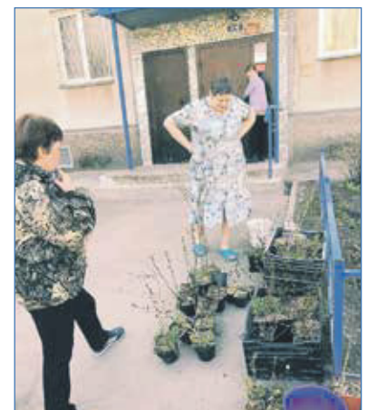
2022 г. Саженцы приехали во дворы домов на Доватора и Толбухина