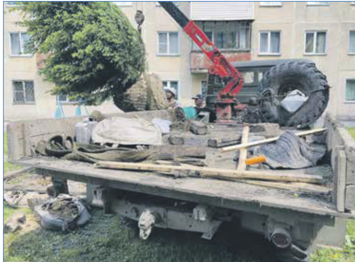
2022 г. Кедр должен прижиться