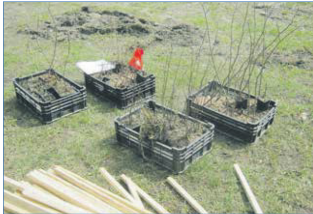
2022 г. Дзержинскому району — зеленые дворы