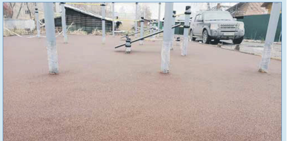
Вместо свалки — спортплощадка на Куприна, 20