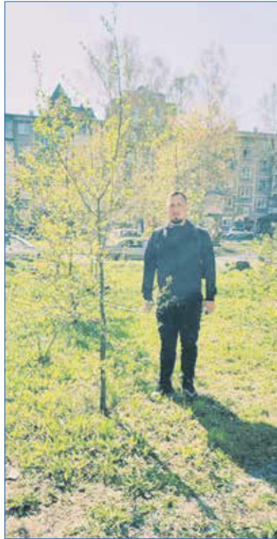
2022 г. Во дворе этого дома деревья уже прижились

ЕСЛИ ВЫ ХОТИТЕ ОЗЕЛЕНИТЬ СВОЙ ДВОР ИЛИ ДРУГОЕ ОБЩЕСТВЕННОЕ ПРОСТРАНСТВО, ОСТАВЬТЕ ЗАЯВКУ ПО ТЕЛЕФОНУ — 8-923-174-54-74