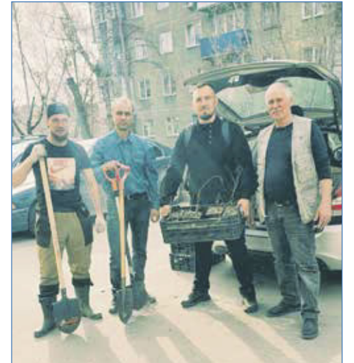
2022 г. Дзержинскому району — зеленые дворы