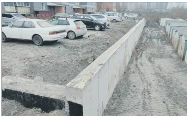
Подпорная стенка на Есенина, 8,6, — текущее состояние