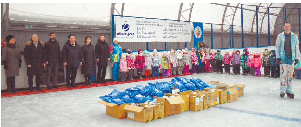
Проект «Малыши на льду» – детским садам дарят коньки для занятий

Будем добиваться строительства новых садов в «Матрёшках» и в «Просторном» и стараться попасть в федеральные и областные прог-