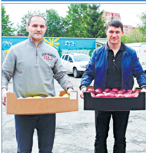
Благотворительные акции фонда «Общее дело» – фрукты в Дом малютки