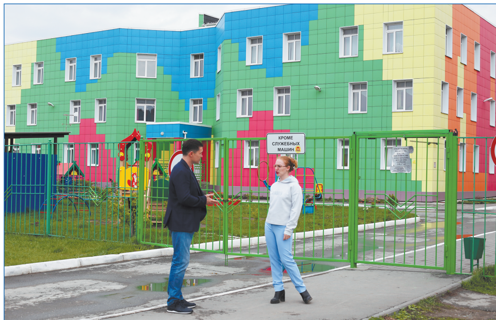
Два новых детских сада построены в новых микрорайонах по наказам депутатам – «Лукоморье» и «Ягодка».

До начала реализации программы депутаты подробно обсудили с жителями как проекты площадок, так и места их размещения. В ходе обсуждения жители внесли более 200 предложений, из которых было отобрано к реализации 63 проекта: 30 площадок размером 200 кв. метров, 9 площадок – 400 кв. метров, 24 площадки – 600 кв. метров. Их наполнение, исходя из предложений жителей, также разнообразно. Это детские городки, площадки для воркаута, мини-футбола, баскетбола, стритбола, спортивные элементы.