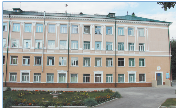
Капитальный ремонт фасада и ограждение сделаны в школе № 47 по наказам депутату