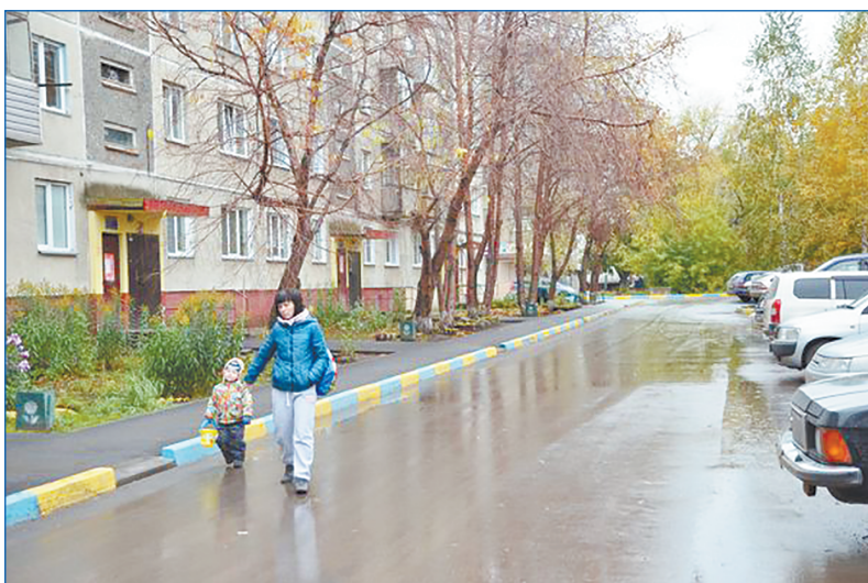
Комплексное благоустройство на Палласа