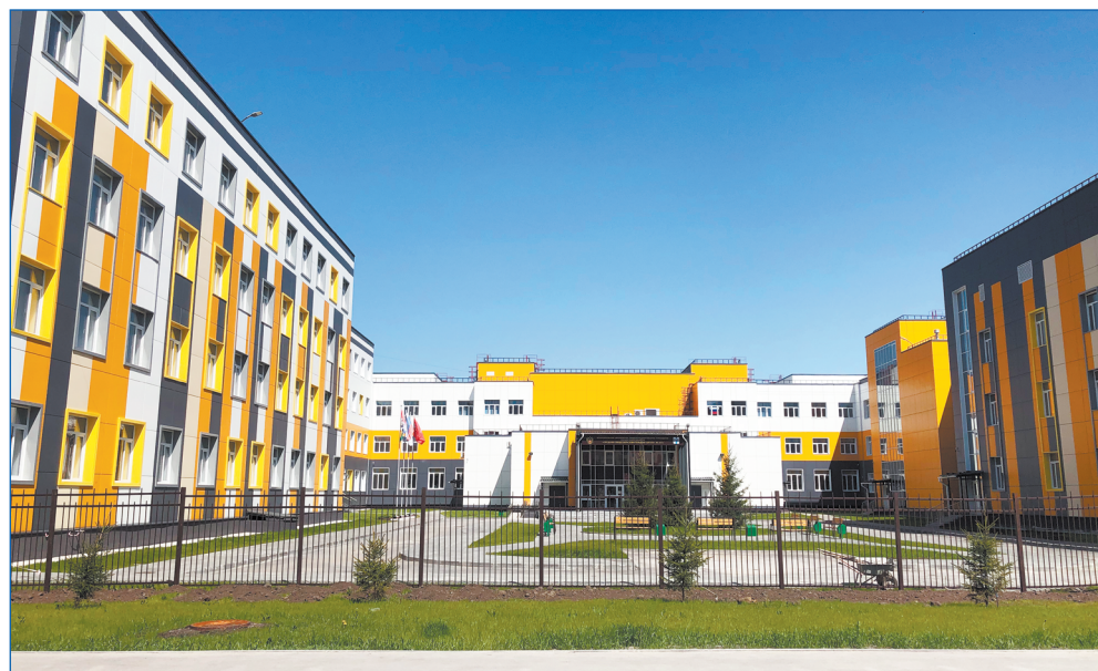
Новая школа № 217 построена по инициативе компании «Вира строй» и депутатов Кировского района

Подробный видео-отчет о работе вашего депутата вы можете посмотреть по ссылке https://youtu.be/pwrRZ8VK0EU или воспользовавшись приложением для распознавания QR-кода на ваших смартфонах.