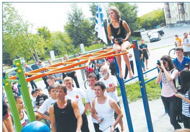
Соревнования по воркауту

3 многофункциональных спортивных комплекса – крытых катка