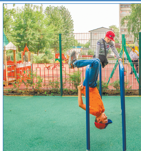
Спортивные и детские площадки есть практически в каждом дворе