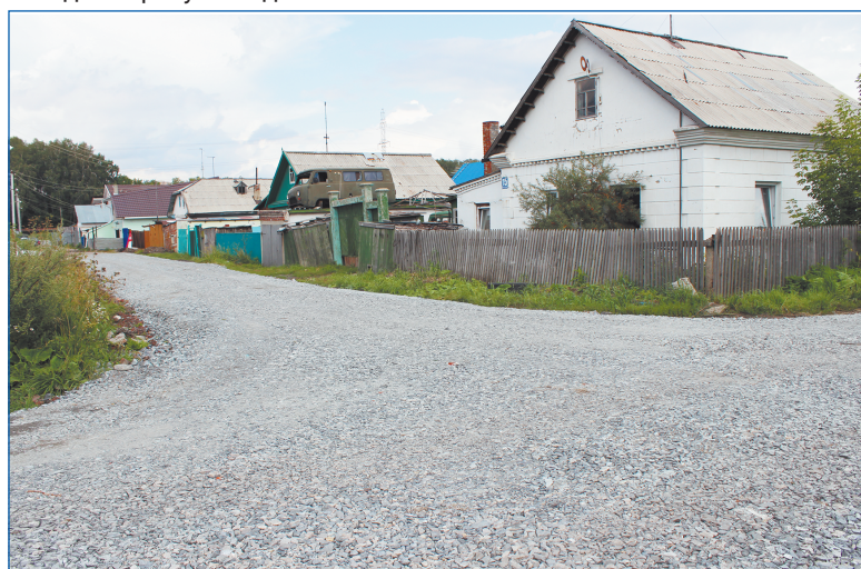
Благоустройство на Бронных переулках