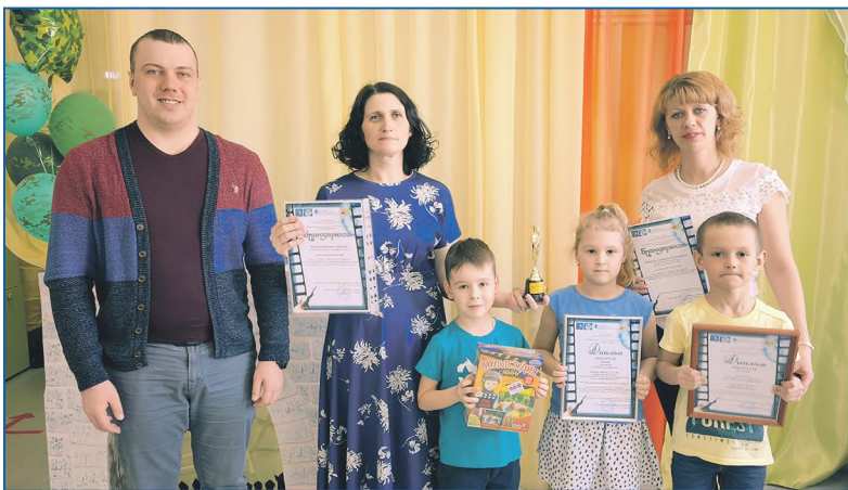
Награждение участников второго районного «Фестиваля мультфильмов» дошкольных образовательных учреждений Дзержинского района в детском саду №509

— Для законотворческой деятельности у нас есть депутаты Законодательного собрания, депутаты Государственной думы. Муниципальный же депутат должен рдесть за свой округ, тесно работать с людьми. У нас в городе 50 округов. Если каждый станет активно работать в интересах своих избирателей, то мы получим город мечты.