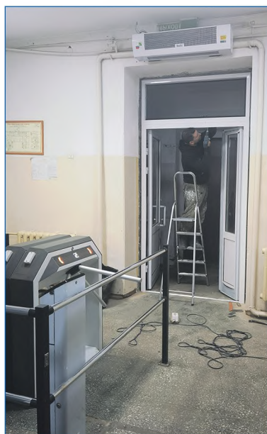
Замена входной группы в школе №71