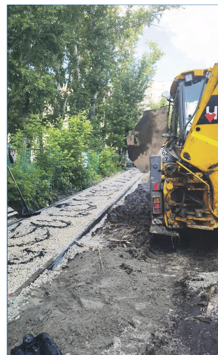
Выполнено обустройство пешеходной дорожки со стороны дома №33 по ул. Республиканской в сторону дома №14/1 по ул. Авиастроителей