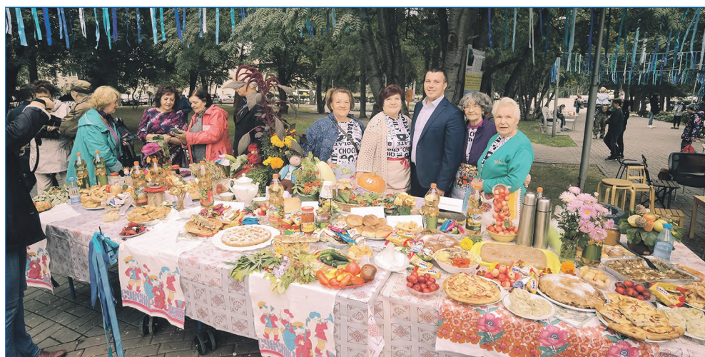
Проведение Дня соседей совместно с городской общественной организацией инвалидов «САВА» и «Клубом добрых соседей»

Также я стараюсь уделять внимание общественным мероприятиям на округе — я организую самостоятельно и помогаю с организацией и проведением праздников. К примеру, совместно с «Клубом добрых соседей» и НГООИ «САВА» мы организовали день соседей для жителей района. В начале 2021 года я организовал новогоднюю фотосессию с приглашением Дедом Морозом и настоящим оленем, также были организованы соревнования по футболу, субботники на округе и различные мероприятия.