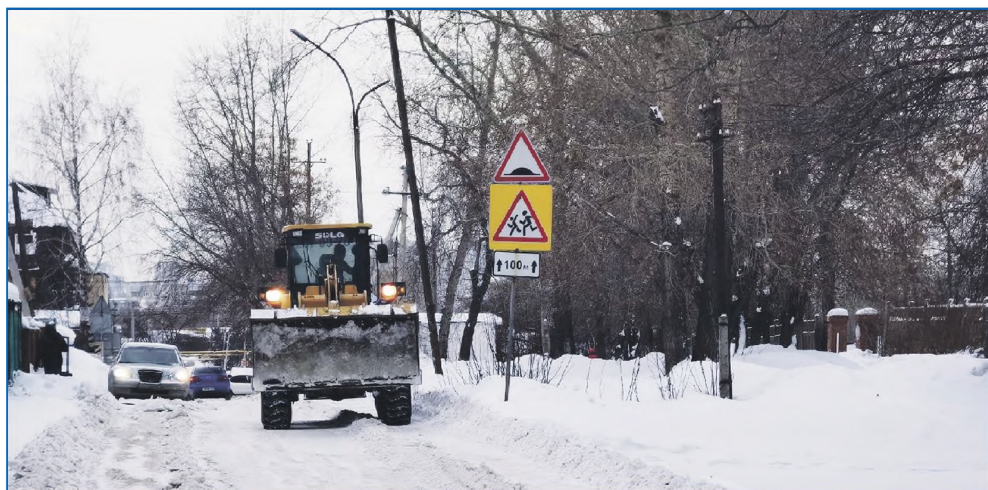
Чистка улицы 3-й Почтовый переулок (рядом со школой №71)

«На почве того, что переданная техника МКУ имела и имеет большой износ, и уборка территорий оставалась все также проблемной, я выделил 400 000 рублей из средств на обращения граждан на помощь в приобретение дорожной техники», — рассказывает Евгений Вячеславович.