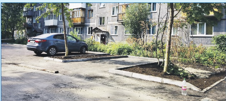
В 2021 году было выполнено обустройство нескольких дополнительных парковочных мест. На фото — ул. Промышленная д. 30

В 2021 году плодотворно велась работа в рамках исполнения наказов. Сообщаем о том, что успели выполнить по приказам избирателей в этом году: