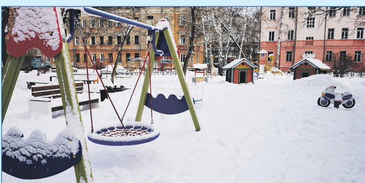
Новая детская площадка между домами на ул. Республиканской, 41 и 41а