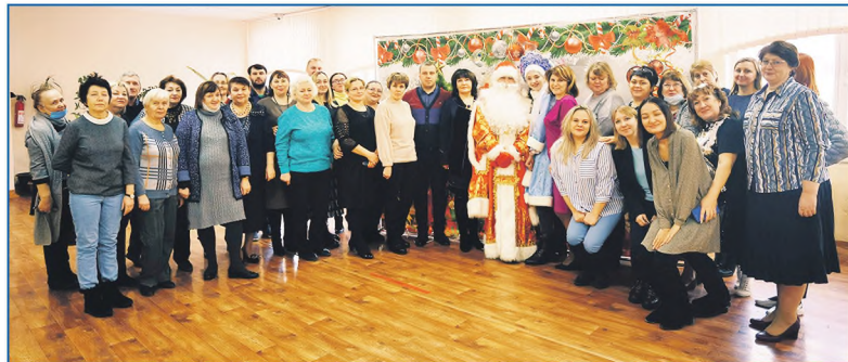
Праздничное новогоднее мероприятие в школе №178

В конце прошлого года ее удалось частично разгрузить без помощи департамента транспорта. Для этого пришлось изменить маршрут №18. Раньше транспорт заканчивал путь на остановке ТЦ «Восток», сейчас на «Биатлоне». Маршрутка не идет через ТСОС «Коминтерна», но заби-