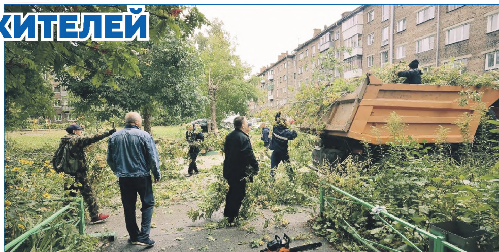
Спил аварийных деревьев совместно с активными жителями дома по ул. Индустриальная, 4

А совместно с неравнодушными активистами Дзержинского района осуществляли вывоз мусора с ТОС «Коминтерна» и ТОС «Биатлонный», а также с нескольких площадок района.