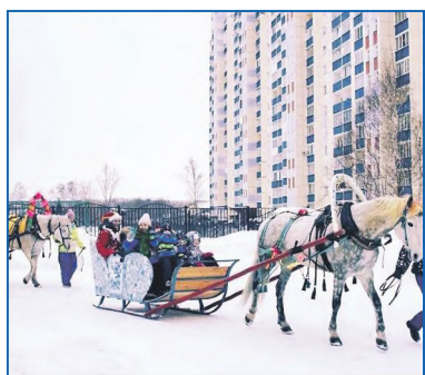
Совместно с администрацией детского сада №44 организовано уличное мероприятие для воспитанников

Я нашел муниципальный участок, на котором отсутствуют коммуникации, запрещающие строительство площадки, провел подготовительную работу, изучил местность, инициировал встречу с жителями. Они меня поддер-