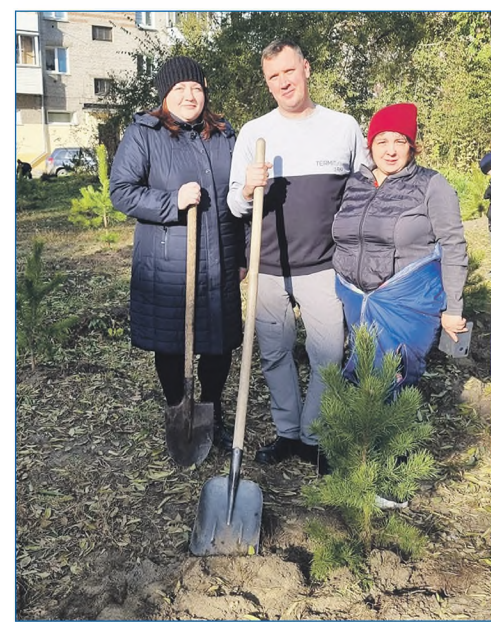
Совместно с активистами ТОС «На Механической» в октябре 2021 года была организована экологическая акция, посвященная Дню отца: было высажено 50 саженцев сосны

Среди прочих мастер-классов был и бесплатный кружок по фотографии. Дети не только узнали многое о процессе съемки, но и участвовали в походе в ближайший лес, изучили родную природу и прошли инструктаж о том, как вести себя, если заблудился в лесу.