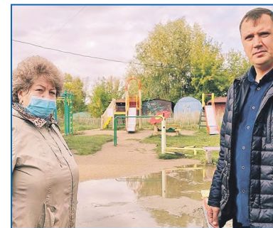
По адресу ул. Березовая, 7/2, были произведены работы по отсыпке участка детской для избежания скопления дождевой воды

Теперь на этом месте появится большая площадка с различными зонами для спорта и отдыха. Будут установлены тренажеры, игровая площадка для малышей, зона от-