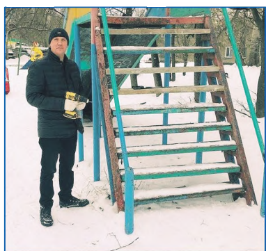
Частичный ремонт детских площадок по адресу ул. Твардовского, 2, и ул. Пришвина, 2