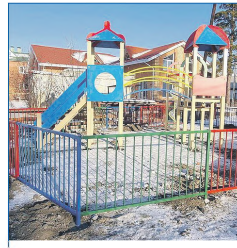
Детский игровой городок по адресу ул. Юбилейная, 12