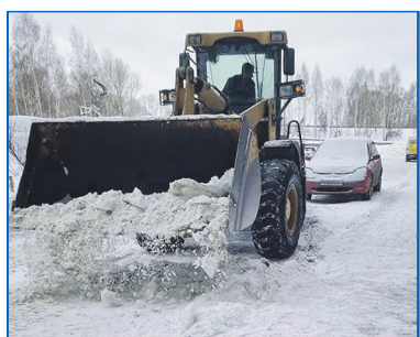
Уборка снега по обращениям граждан: ул. Одоевского, 1/10, Лаврова, 5, Узорная, 8; вывоз снега с территории МБОУ СОШ №117 и д/с №44