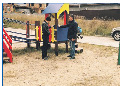
Детские игровые элементы по адресу ул. Радужная, 9–11