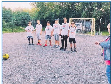
Совместно с администрацией Первомайского района установлено новое ограждение спортивной площадки по адресу ул. Ремонтная, 78. По завершении работ был проведен турнир по мини-футболу среди детей, проживающих в районе

Изначально департаменты отнекивались, утверждали, что муниципальной земли на этом участке нет, отодвигали решение на 2025 год. Но я настоял, чтобы мои наказы,