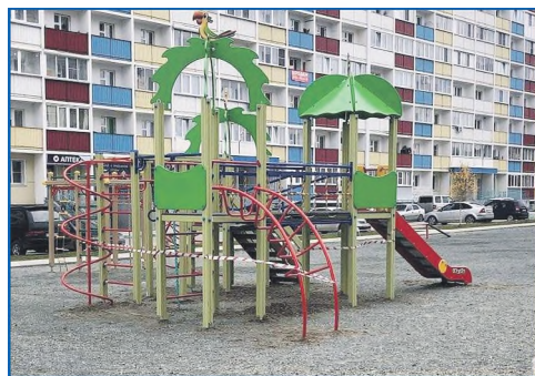
Детской игровой городок по адресу ул. Твардовского, 22/5