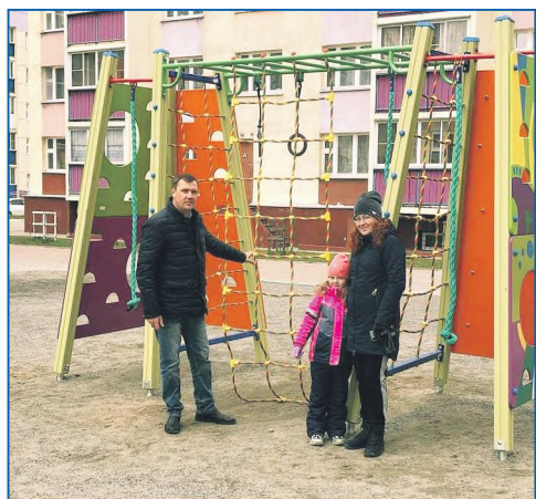
Детской игровой комплекс по адресу ул. Березовая, 13