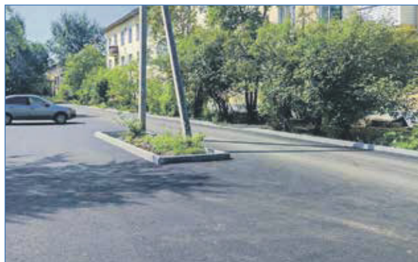
Парковочные карманы, подходы к подъездам и широкие асфальтированные проезды оборудованы во дворах Халтурина, 35 и 35/1

нее по генеральному плану развития территории планируются и новые детские сады.