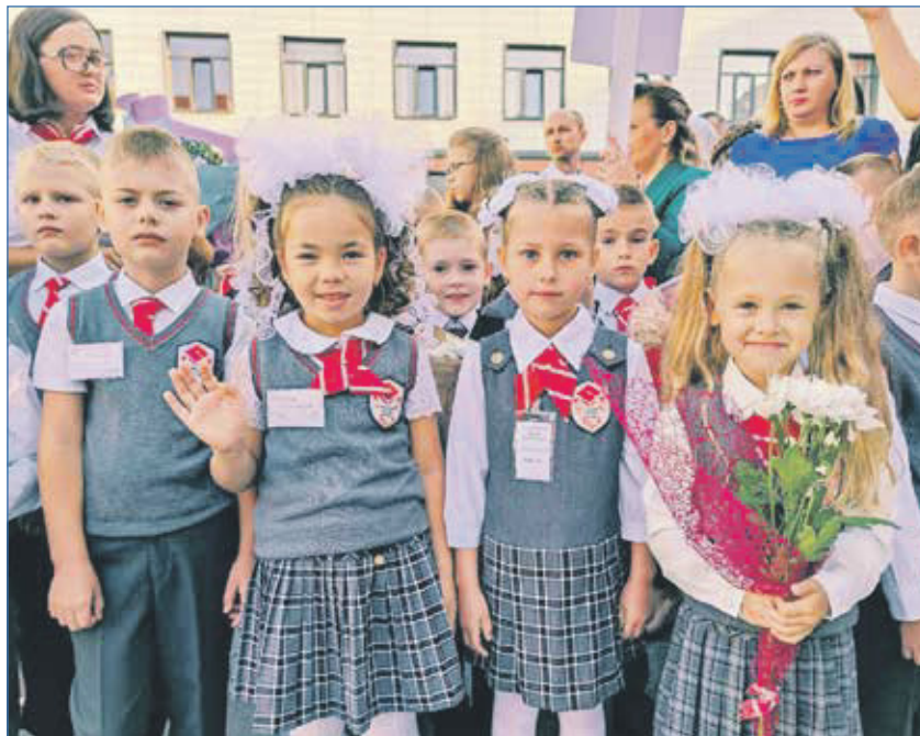
Ученики школы №215 на сентябрьской линейке. На контроле депутата Кирилла Покровского — строительство второй школы в микрорайоне «Чистая Слобода»

Что касается детских садов, здесь ситуация благоприятнее, в частности микрорайон «Чистая Слобода» достаточно оснащен детскими садами и ясельными отделениями. Тем не ме-