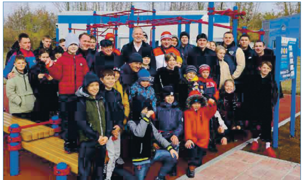
На площадке для сдачи норм ГТО

— Такая работа на моем округе ведется активно практически с первых дней спе-