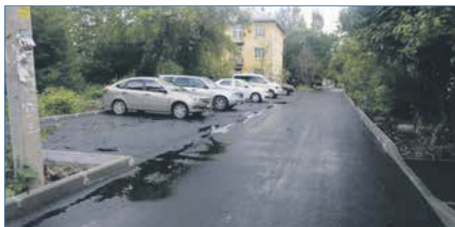
Благоустройство парковочных мест сделали на ул. Халтурина, 35

А дальнейший проект — это строительство дороги по улице Дукача, которая соединит ул. Титова и ул. Станционную. Это позволит