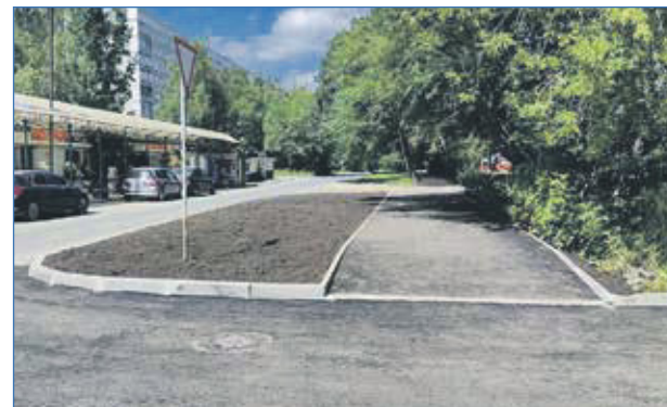
Новый тротуар на ул. Колхидской

Перечислять можно долго. В целом могу сказать, что бюджет остается у нас соци-