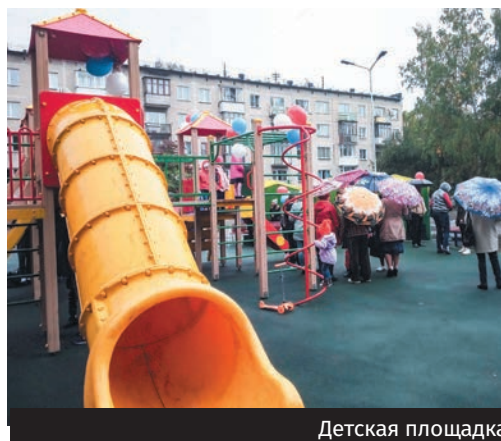
Детская площадка по ул. Доватора, 25

В 2018 году на решение проблем округа № 3 привлечено свыше 25 млн рублей. По словам депутата Георгия Андреева, это в два раза больше, чем в 2017 году.