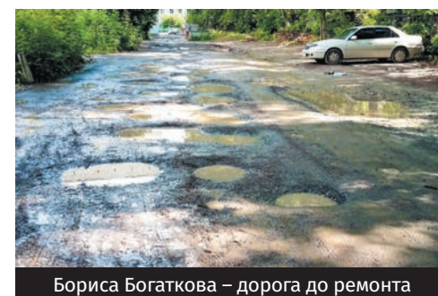
Бориса Богаткова – дорога до ремонта

ОАО «РЭС» проведены работы по замене электрических опор по ул. Куприна и построена линия наружного освещения по ул. Толбухина. Проведено мероприятие по благоустройству территории, прилегающей к строительной площадке к дому № 30 по ул. Адриена Лежена. Также произведены работы по содержанию объекта озеленения общего пользования – сквера по ул. Толбухина, 23–25.