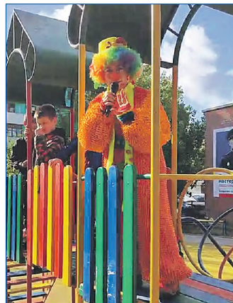
ул. Гоголя, 39а

сто каждый дом по себе, а общую зону отдыха. Мы вышли на депутата Сергея Бондаренко и он идею поддержал. В результате у нас появилось безопасное покрытие, на котором установили пока только горку, но надеемся, что здесь появятся качели, карусельки. А еще очень хотим асфальтированную велодорожку, мы даже сами ее проект нарисовали. Также хотелось обустроить и место для отдыха людей старшего поколения, чтобы и лавочки были, столики в шахматы поиграть. Если это установят у нас, в центре города — будет здорово».