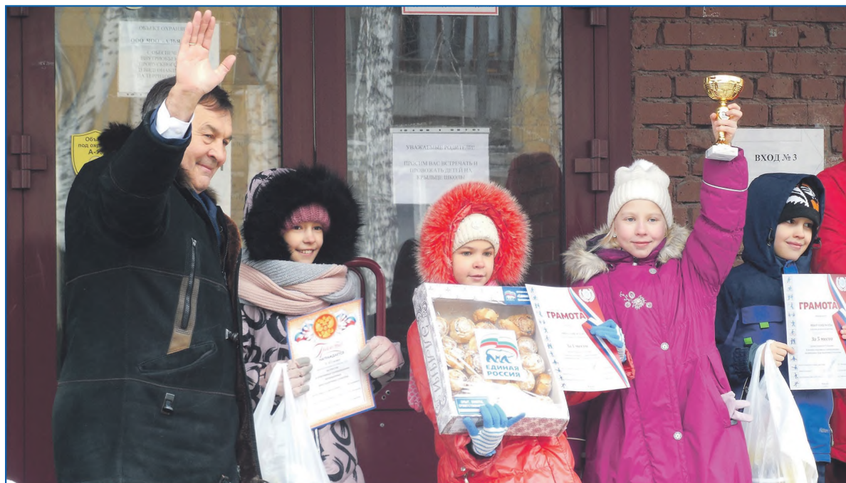
Награждение победителей спортивных соревнований в школе №156

Всего мы собрали около 745 наказов. Это много. Длительный период времени ушел на их защиту, проработку через департаменты, администрацию района. Безусловно, мы постарались высветить слабые места в обустройстве города и подвести граждан к тому, чтобы они в своих волеизъявлениях обозначали эти темы. Например, говорили об окультуривании мест сбора бытовых отходов. У нас в ужасном состоянии мусорные контейнеры, площадки иногда без ограждений. Мы постарались привлечь к этому внимание. Потому что региональный оператор, на мой взгляд, этот вопрос не решает, при том, что около 30 домов сделали заявки по данному вопросу и хотят видеть эстетически красивые мусорные площад-