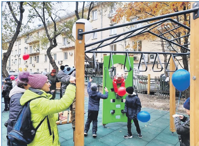
Территория Детства | ул. Советская, 20

Площадка занимает огромное место, поэтому первым этапом было решено сделать здесь именно безопасное прорезиненное покрытие, так как финансово это наиболее затратная часть установки детского городка. В дальнейшем площадка еще преобразуется, в планах дополнить ее качелями и игровыми элементами.