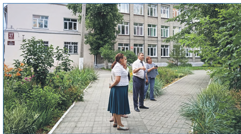
На территории средней школы №4 появится Сквер литературных героев

У экономического лица установили две символических скульптуры: «Вовку в тридевятом царстве» и «Мудрую сову». Это недорого, но дети должны понимать, что у лица есть свой символ «школы успеха». Благодаря совместной работе с руководством лица решился вопрос, связанный с реконструкцией. Это большая победа, в ближайшее время здание будет увеличено в объеме за счет пристройки. Словом, дружим, продвигаем, поддерживаем, находим средства и источники для помощи образованию.