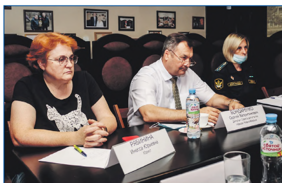
В пресс-клубе Новосибирского союза журналистов на круглом столе по проблеме незаконной уличной торговли

Что касается дворового спорта, то стремимся не только устанавливать площадки, но и помогать затем в их обслуживании.