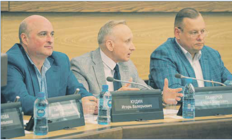
Идет обсуждение проблемы

В октябре 2022 года в рамках постоянной комиссии Совета депутатов города Новосибирска по научно-производственному развитию и предпринимательству была создана рабочая группа по изучению предложений о совершенствовании сферы наружной рекламы в Новосибирске.