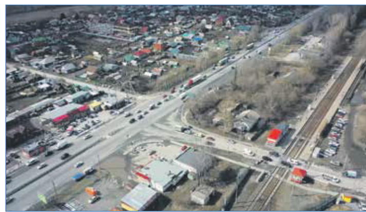
В микрорайоне КСМ нужны развязки, а не новые высотки

— Мы видим, как сегодня на дорогах стоят большие пробки, особенно в районе железнодорожного переезда у Матвеевки из-за интенсивного движения поездов. У нас нет своего стационара, скорые не могут в кратчайшие сроки доставить пациентов в больницы. На территории КСМ находится ПАТП-4, предприятие развивается, появляются новые автобусы, которые из-за заторов не могут прийти на остановки по расписанию.