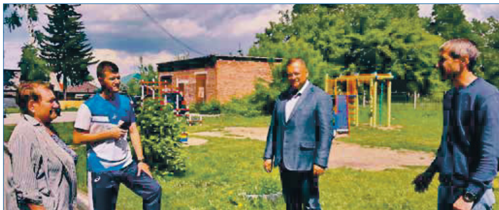
Установка детской площадки со спортивными тренажерами на улице Вересаева

— Год в целом был плодотворный. Мы хорошо отработали по реализации депутатских наказов, помогли образовательным учреждениям — как школьного, так и дошкольного профиля, выстроив годовые планы работы с каждым заведением до 2025-го года. Вторым важным направлением стал спорт. Не знаю другого района города, где были бы созданы такие условия для детского спорта, организовано количество бюджетных мест в секциях. Наша команда поддерживала отношения с таким знаковым для района объектом как детско-юношеский физкультурный центр «Первомаец». Из городского бюджета по инициативе нашего Депутатского центра было вы-