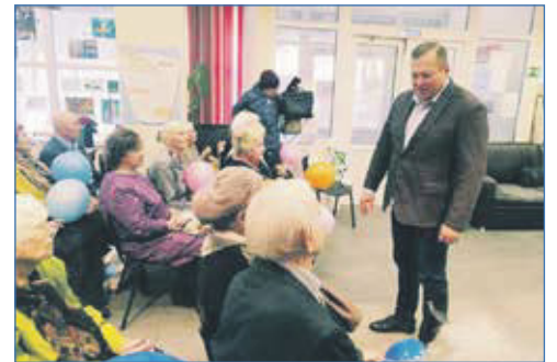
На собрании НООО ЭХО

вы, замечательные люди — то, что уборка снега передается в районы, позволяет оперативно решать проблемы. С другой стороны, надо помочь техникой. Пробле-