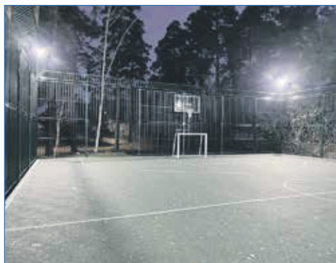
Площадка работает круглосуточно