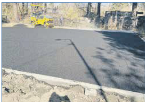
Процесс подготовки основания