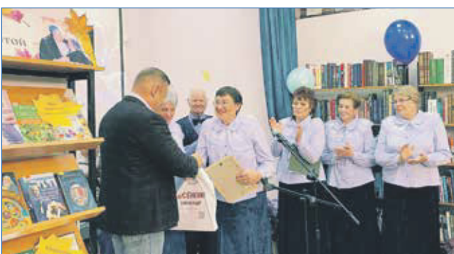
День пожилого человека в ТОС «Сосновый»