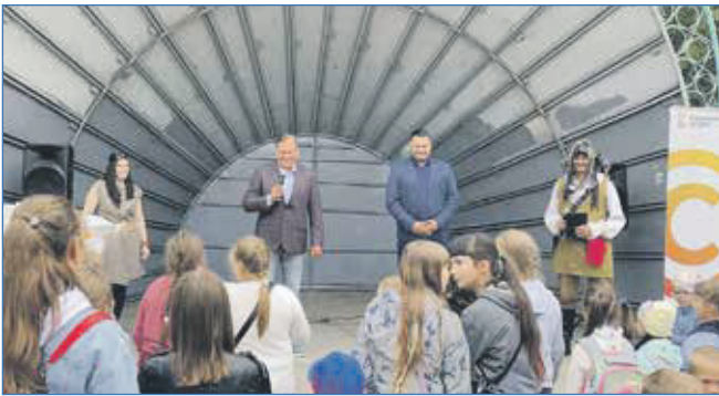
На празднике в микрорайоне КСМ

— Конечно, готовы участвовать в тех мероприятиях, которые предлагает районная администрация, при этом предложим какие-то свои проекты. Собственно, один из аргументов, который мы выдвигали, когда занимались вопросом ремонта Монумента Славы, — к юбилею района одна из его «визитных карточек» должна выглядеть достойно. Уважительное отношение к прошлому всегда культивировалось в Первомайском районе, думаю, так будет и впредь.