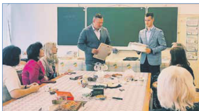
Поздравление педагогов с Днем учителя