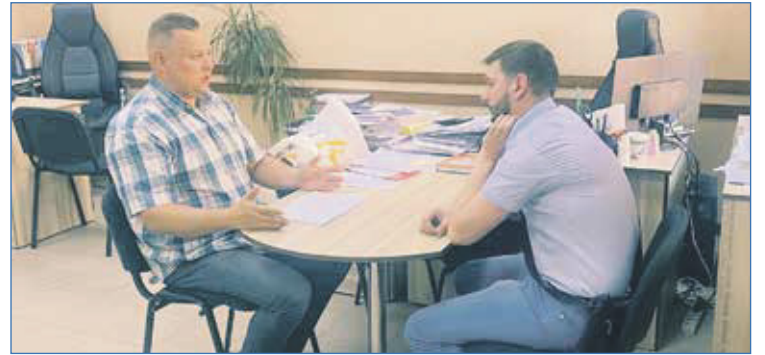
Прием жителей — обязанность депутата

вопросы в рамках ее работы удается решить?