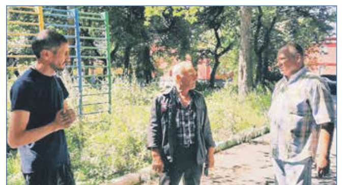
Помощники депутата контролируют выполнение наказа