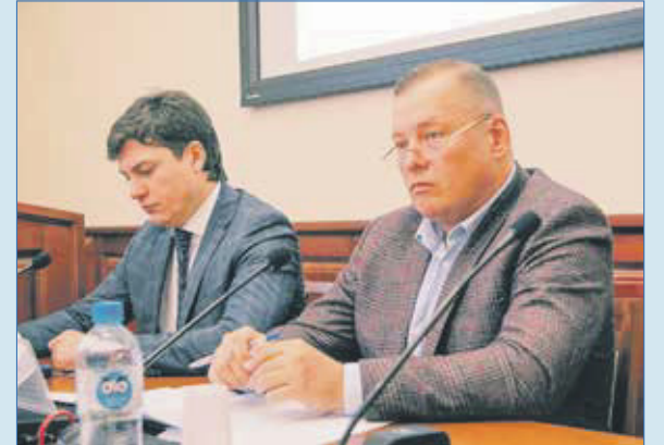
Важные вопросы решаются совместно