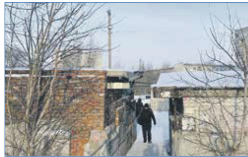
По многочисленным обращениям на улице Березовой установили прожектор

Кстати, в это управление были переданы полномочия по демонтажу объектов — абсолютно правильное решение, потому что когда один департамент принимает решение об установке конструк-