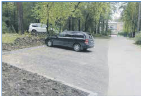
Один из выполненных наказов — парковочный карман на Сызранской, 10