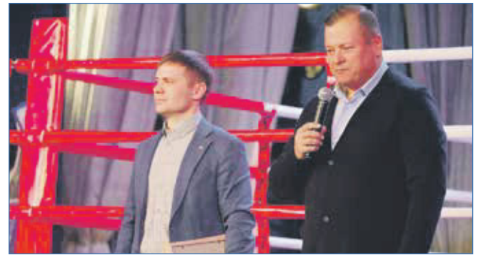
Спорту — повышенное внимание