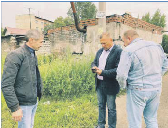
Совещание по безопасности школьных маршрутов

По итогам выездного совещания рабочая группа подготовит рекомендации по повышению безопасности на данных участках.