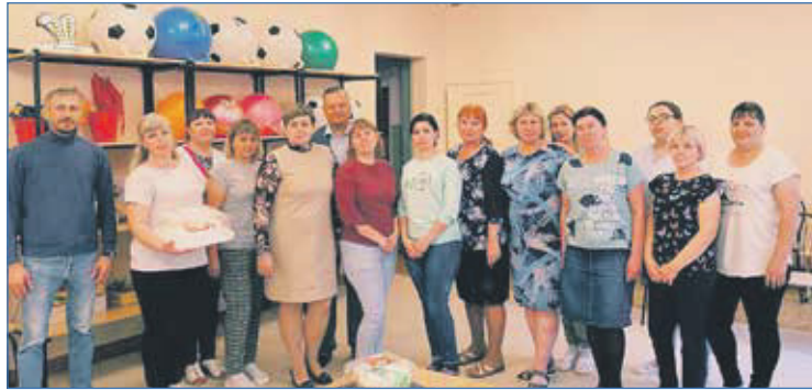
День дошкольного работника в детском саду №78

— В Совете депутатов Новосибирска вы возглавляете одну из ключевых комиссий — по научно-техническому развитию и предпринимательству. Какие