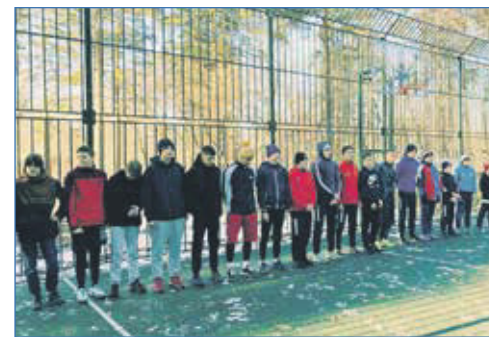
Спортсмены уже готовы

вание, установлено ограждение и подключено освещение. А к ноябрю стало понятно — это не обычная площадка, которую можно увидеть в любом дворе, а настоящий многофункциональный спортивный комплекс, подарок для любителей спорта, которых в Первомайском районе много — взрослых и детей, профессионалов и любителей.