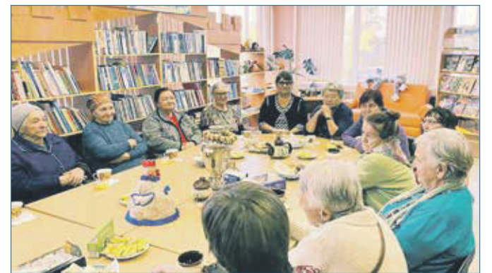
На встрече со старожилыми «100 Домов»

В прошлом году исполнилось 75 лет одному из самых «пролетарских» микрорайонов Первомайки — «100 Домов». Такое необычное название он получил после постановления «Об обеспечении нормального режима работы и отдыха локомотивных бригад», следствием чего стало активное жилищное строительство.