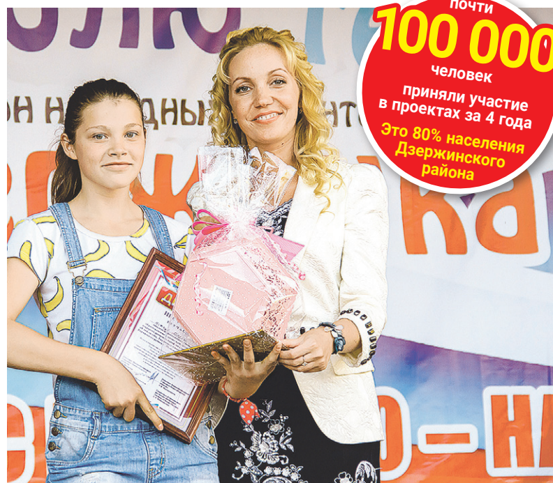
На марафоне народных талантов «Я люблю тебя, Дзержинка».