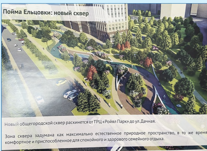
Пойма Ельцовки: новый сквер

— Этот парк делается, прежде всего, для жителей домов, расположенных в этом районе Заельцовки. И, на мой взгляд, при его проектировании необходимо проводить малые общественные слушания. Это помогает услышать и увидеть потребности горожан, понять, что из запланированного действительно необходимо людям. Где обустроить лесопарк? Какие нужны детские площадки, сколько их, в каких местах? К сожалению, мы не раз сталкивались с тем, что что-то сделали, построили, а жителям этого не нужно, наоборот, мешает. Я считаю, что лучше десять раз обсудить, но найти то зерно, составить тот проект, который учтет максимальное количество пожеланий. Кому-то не хватает зеленых насаждений в парке, хочется тишины и покоя, другим, наоборот, активности и веселья. Ведь в городе очень много равнодушных людей, и каждый человек, включаясь в жизнь города, вносит свой вклад в его развитие.