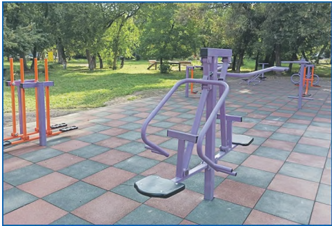
Спортивная площадка с тренажерами по ул. Богдана Хмельницкого, 10/1

В рамках реализации наказов избирателей, в городе и так ежегодно появляются новые детские площадки, спортивные комплексы, объекты малых форм. Однако участие Новосибирска в программе «Территория детства» позволяет реализовывать более масштабные проекты, под стать размерам и темпам развития региона.