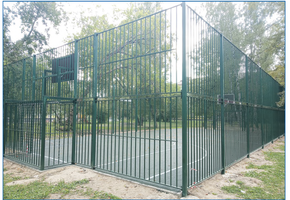
Спортивная площадка по ул. Богдана Хмельницкого, 45/1

Благодаря такой работе, 14-й округ Павла Чернышева не первый раз получает новую, современную спортивную площадку в рамках проекта «Территория детства». Район нуждается в новых местах для детского досуга, а неподдельный интерес жителей и их благодарность за установленные площадки подтверждает это.