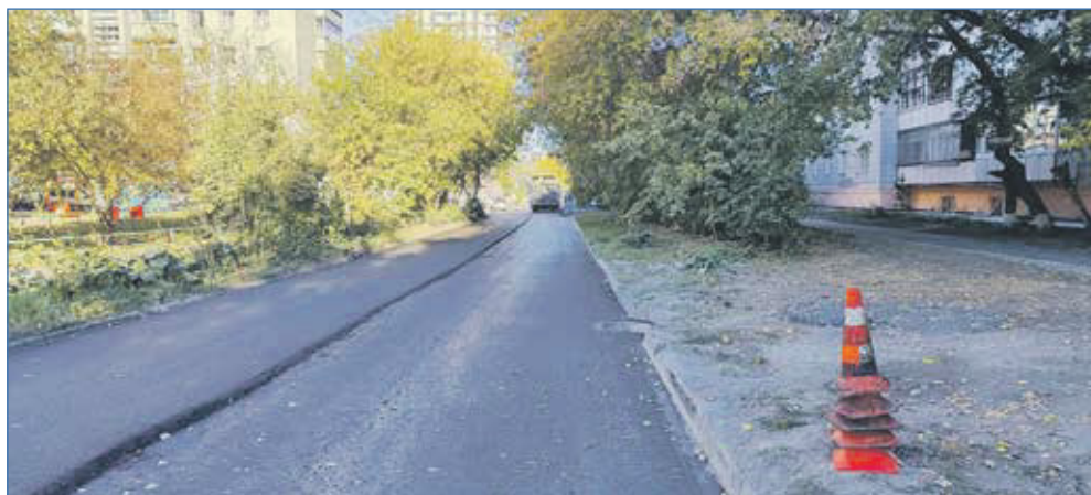
Ремонт дорожного полотна на ул. Ленинградской от ул. Никитина до ул. Грибоедова

Также депутат активно взаимодействует с ТОС на округе — «Пульс», «Гарантинский», «Большевикский» и ТОС №7. Здесь и совместная работа по обращению граждан, и совместные мероприятия на территории района, в том числе проведение праздничных мероприятий. В 2022 году из средств для исполнения обращений граждан на поддержку ТОС было направлено 200 тысяч рублей.