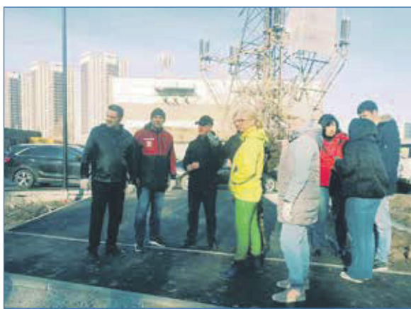
Акция по уборке территории сквера Героев Донбасса с участием мэра, главы Октябрьского района, представителей ТОСов «Пульс», «Гаранинский», ТОС №7, а также жителей близлежащих микрорайонов

— В 2023 году начнутся работы по реконструкции аллеи Грибоедова в Никитинском жилмассиве. Здесь будут благоустроены пешеходные дорожки и установлены новые осветительные фонари.