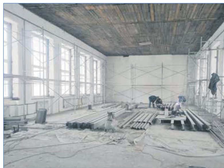
Капитальный ремонт 167-й школы