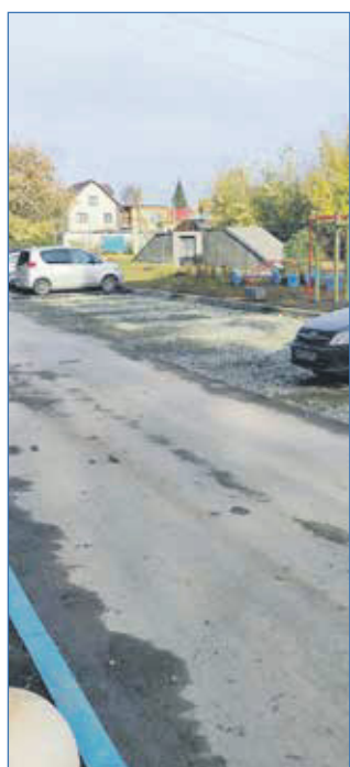
Работы по обустройству автомобильных парковочных мест во дворе дома на ул. Ленинградской, 273