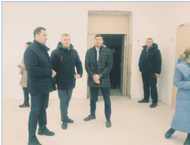
Выездное совещание по проверке хода капитального ремонта здания школы №167 по адресу улица Добролюбова, 233

Выражаю огромную благодарность всем активным людям и организациям, принявшим участие в реализации социальных проектов, помогавшим сделать жизнь нашего района и его жителей немного лучше и комфортнее. Благодарю всех неравнодушных граждан за помощь и доброе отношение!