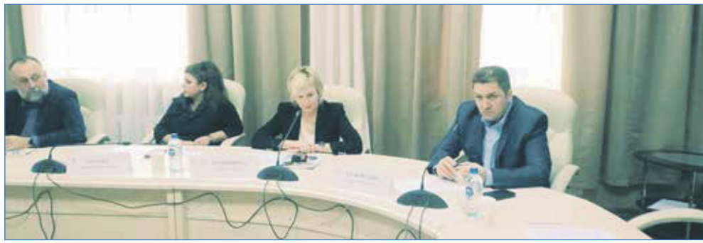
Заседание Общественного совета партийного проекта «Городская среда» в Новосибирской области.

Также в числе основных рекомендаций мэрии Новосибирска — определение приоритетных направлений деятельности структурных подразделений мэрии с обеспечением их финансирования в бюджете города на 2023 год и