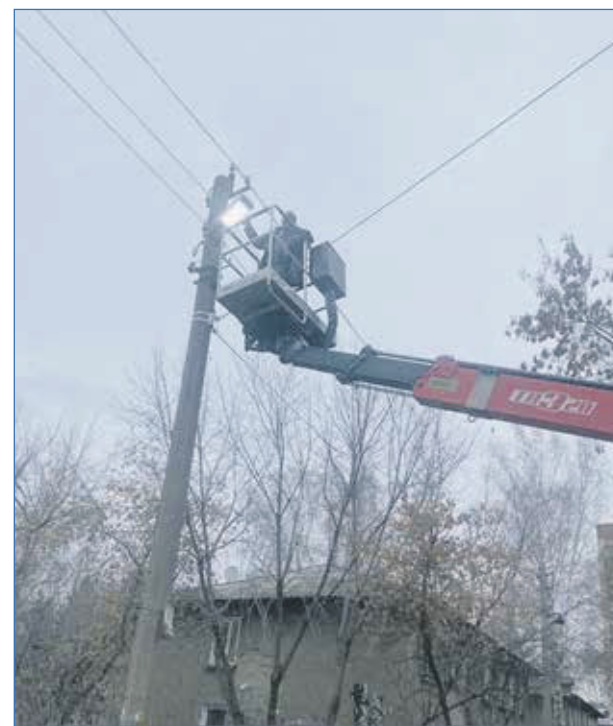
Ремонт освещения на ул. Добролюбова

— Осуществлен спил аварийных деревьев на ул. Черемховской (в районе дома №12).