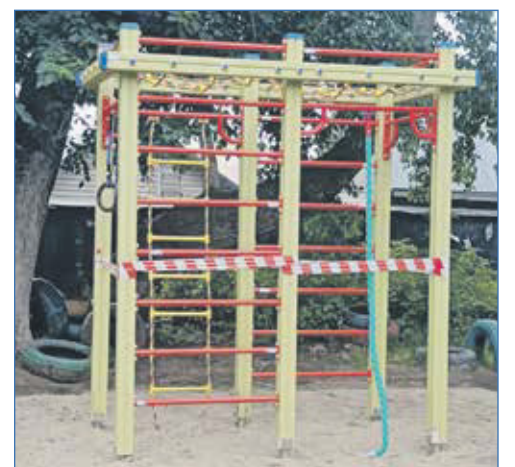
В рамках исполнения наказов избирателей, во дворе дома по адресу: III Интернационала, 278, установлен спортивный элемент детского городка

было дополнительно выделено 120 тысяч рублей для оказания адресной помощи гражданам. В 2022 году индивидуальную материальную помощь получили 32 человека и 12 семей.