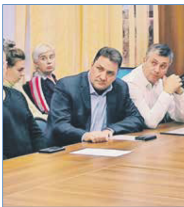
На отчетной конференции ТОСа «Большевикский»

Поэтому в своем отчете я сделал акцент именно на этих проблемах районного и общегородского масштабов. Хотя, разумеется, весь круг вопросов и проблем, к решению которых подключается моя команда,