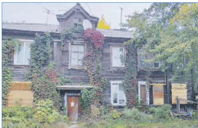
Дом на ул. Грибоедова расселен в рамках программы КРТ

А в 2023 году на территории округа будет начато освоение еще четырех площадок в рамках КРТ. Речь идет