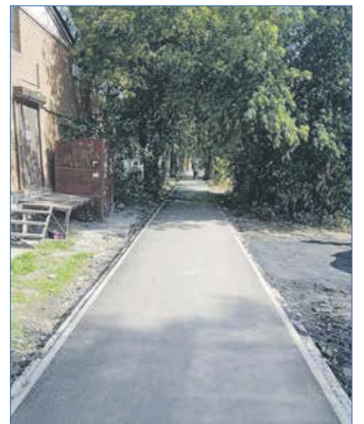
В рамках исполнения наказов избирателей на ул. Крамского восстановлен тротуар