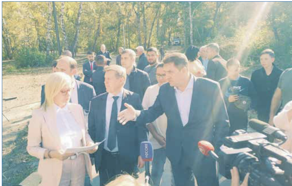
Выездное совещание по вопросу выполнения работ по благоустройству сквера Героев Донбасса

В целом на округе мы помогли с устройством дорог, в том числе очисткой улиц частного сектора, благоустройством общественных пространств, освещением, обрезкой аварийных деревьев, устанавливали детские городки, лавочки, урны. Это наша ежедневная работа как в рамках наказов, так и в результате просто обращений граждан. Людям, попавшим в трудную жизненную ситуацию, помогаем получать материальную помощь по линии соцзащиты. К нам приходят за помощью администрации школ и детских садов — к примеру, нужно провести мероприятие, закупить оборудование, решить другие повседневные задачи образовательных учреждений. Более глобальный вопрос — ремонт, как в 167-й школе. Там два здания. Одно