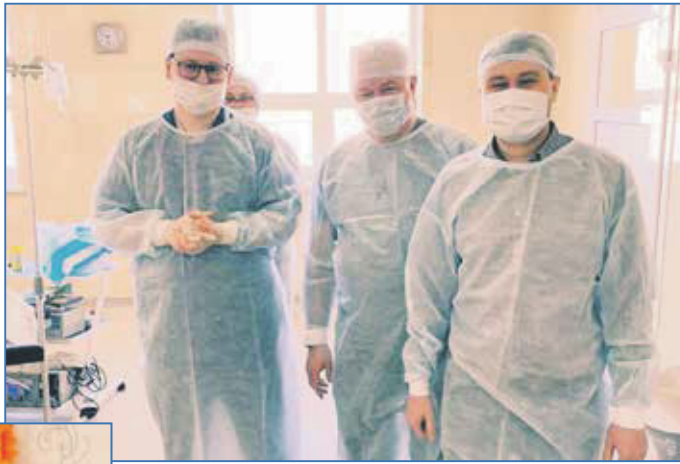
Луганский областной клинический онкологический диспансер

Кроме того, во дворе дома по адресу: улица Дуси Ковальчук, 71, были установлены лавочки, урны и вазоны, а на Дуси Ковальчук, 20, высажено около 20 деревьев. Удалось выделить дополнительные средства и заасфальтировать большой участок дороги, расположенный на пересечении улиц Нарымская и Линейная.