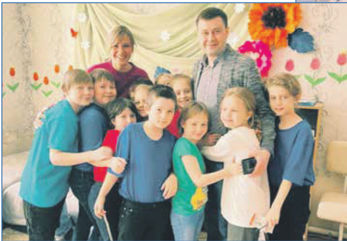
Детское учреждение «Незабудка». Город Луганск

Луганской области. После этого направились на другие освобожденные территории: как только линия фронта продвигалась, мы в течение двух дней приезжали на ее границу. Были в таких населенных пунктах, как Счастье, Старобельск, Сватово. Принимали участие в формировании временных гражданских военных администраций, общались с работниками здравоохранения,