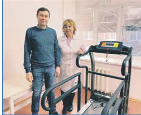
Новое оборудование для центра «Лунный камень»

ВЫПОЛНЕН РЕМОНТ УЛИЦЫ ЛИНЕЙНАЯ, А ТАКЖЕ ПРОЕЗД МЕЖДУ ДОМОМ ПО УЛИЦЕ ДУСИ КОВАЛЬЧУК, 75/1, И ТЦ «ВЕРИНИЦА»