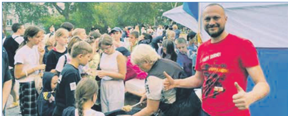
Праздник День соседей. Жилмассив Линейный