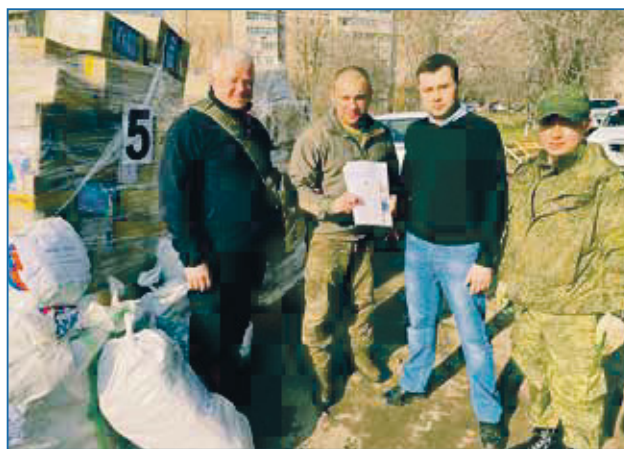
Город Луганск. Передача писем детей из школы №131 и гумпомощи нашим бойцам