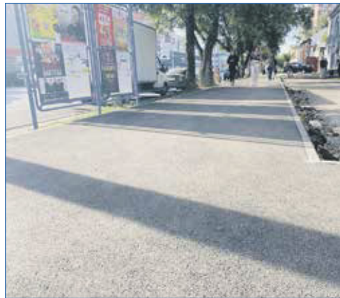
Новый тротуар на улице Плановая

ПРОВЕДЕНО БОЛЕЕ 15 ПОЕЗДОК ПО СВЯТЫМ МЕСТАМ — ИХ ПОСЕТИЛИ БОЛЕЕ