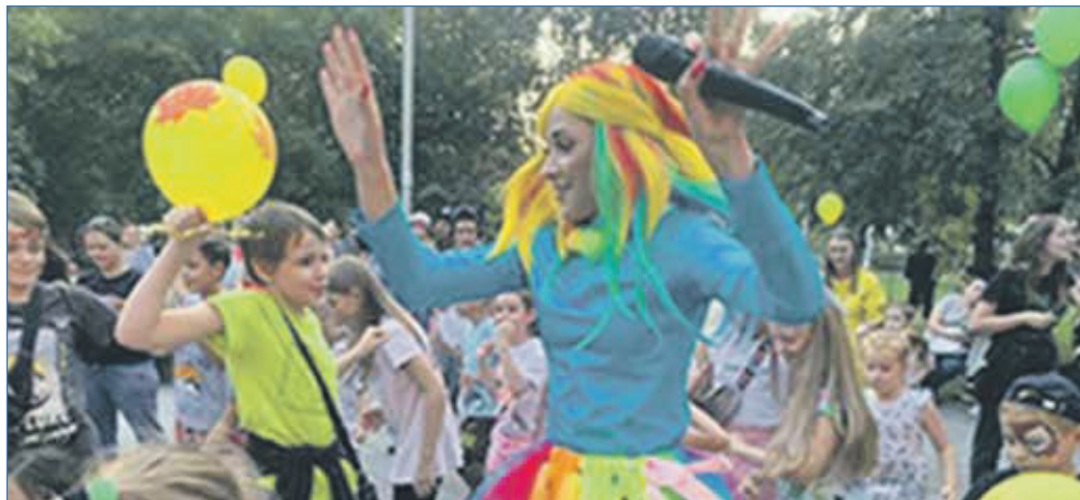
Праздник День соседей. Сквер «Радужный»