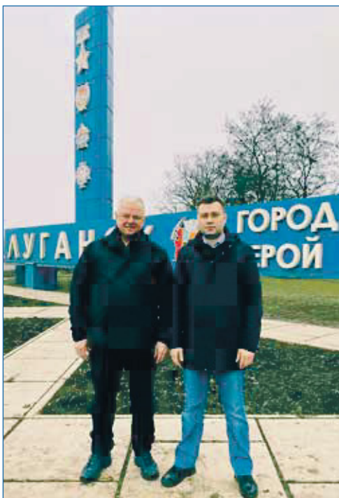
Командировка в ЛНР