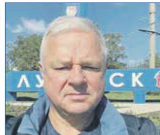
Иванинский Олег Иванович, депутат Государственной Думы Федерального Собрания Российской Федерации восьмого созыва

Я уже начал формировать план объекта: основание будет с качественным резиновым покрытием, торцевое ограждение, волейбольная сетка. Вокруг площадки установим лавочки и урны, а затем — турники и спортивные тренажеры. Это будет точка притяжения всей спортивной молодежи и пример подрастающему поколению для поддержки здорового и активного образа жизни.