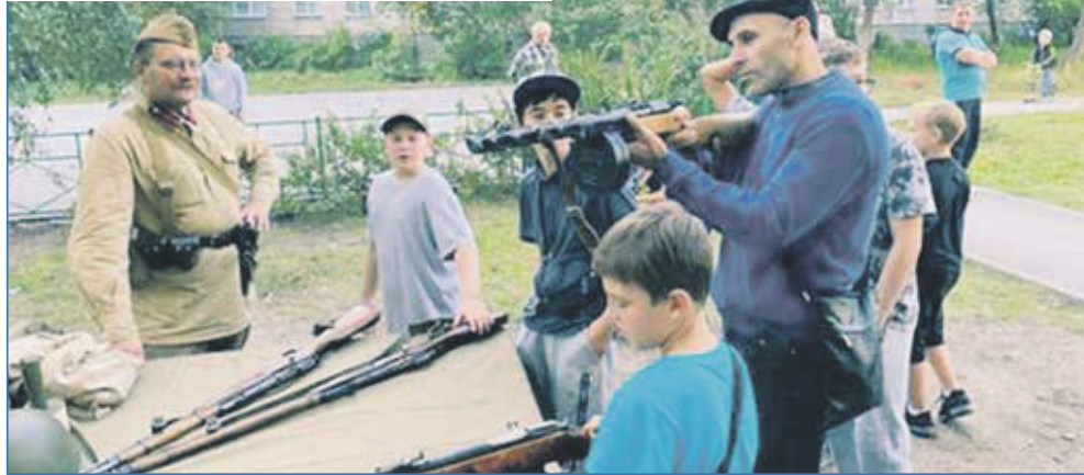
Реконструкция оружия времен ВОВ