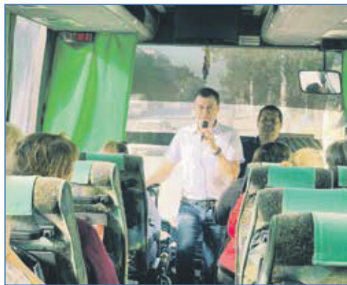
Экскурсионный автобус проекта «Поездки по святым местам»

ЗАВЕРШЕНО СТРОИТЕЛЬСТВО ТРОТУАРА ПО УЛИЦЕ ПЛАНОВАЯ