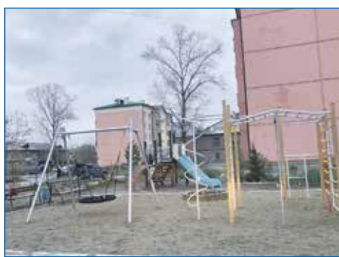
Ул. 2-я Ольховская, 7