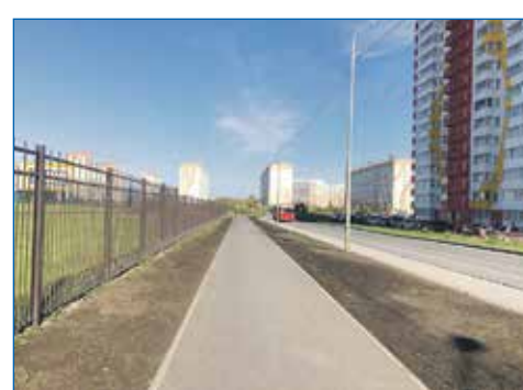
Пешеходная дорожка вдоль школы №217

найти механизм решения поставленной задачи по капитальному ремонту гидроизоляционного слоя всего кровельного покрытия.