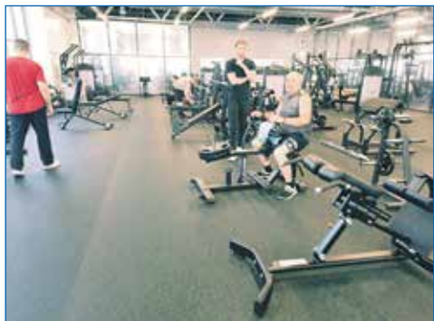
Новый спорткомплекс в «Матрешках»

Здесь работает отделение областной школы по карате, группа адаптивного карате, есть большой, современный тренажерный зал. За-