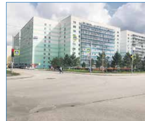
Установка светофора на пересечении улиц В.Шевелева и А.Чистякова