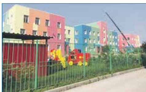
Детский сад №53

Еще один крупный проект, который в рамках исполнения наказов избирателей реализован в 2023 году совместно с депутатами Вениамином Паком и Еленой Спасских, а также с департаментами образования, строительства и архитектуры, администрацией Кировского района, — это капитальный ремонт кровли детского сада №53. Общими усилиями удалось