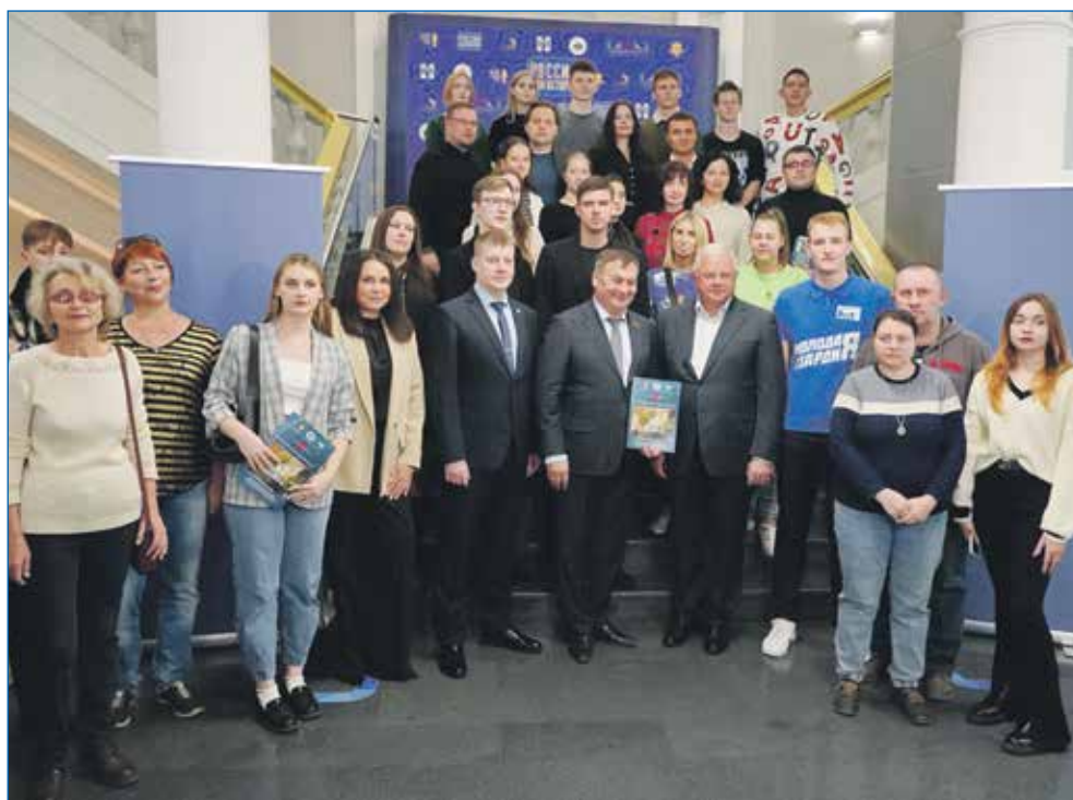
Открытие выставки 4 октября, посвященной СВО, на базе мультимедийного исторического парка!

После выборов Президента РФ, несомненно, векторы и алгоритмы развития страны в экономике, производстве, со-