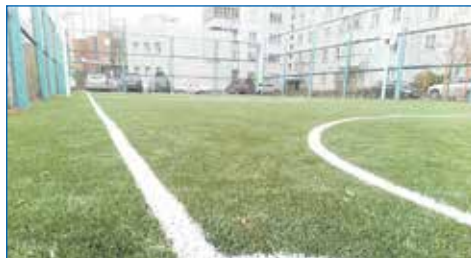
Ул. Д. Бедного, 52

А затем по просьбе жителей этого дома для упорядочения пользования площадкой изготовлены и установлены дверцы.