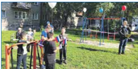
Ул. Гоголя, 23

На детской площадке возле дома по адресу: ул. Гоголя, 23, установлены новые качели. Открытие обновленного двора стало праздником для маленьких горожан.