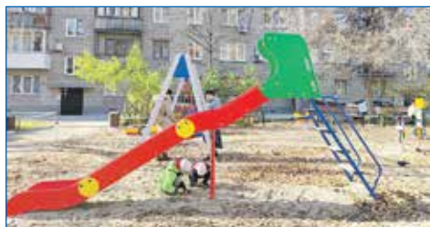
Ул. Ипподромская, 45а