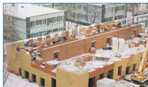
В 2024-м расширит свои площади детский сад №117 «Дружная семейка», расположенный в Центральном районе на улице Крылова, 42

1 февраля на избирательном округе №50 по просьбам избирателей домов, находящихся рядом со стройкой, а также по инициативе заведующей МБДОУ д/с №117 проведено собрание по созданию общественного наблюдательного совета. Актуальность создания этого органа продиктована информационным вакуумом вокруг реконструкции учреждения. Решение о реконструкции путем строи-