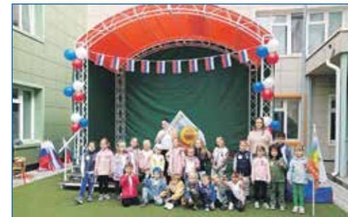
Ул. Селезнева, 48

Благодаря активности жителей и трудолюбию дворы в Центральном районе становятся уютными и зелеными!