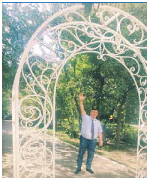
Ул. Селезнева, 37

На спортивной площадке по ул. Д. Бедного, 52, обустроено искусственное покрытие, ведь так делать упражнения приятнее, а главное безопасно.