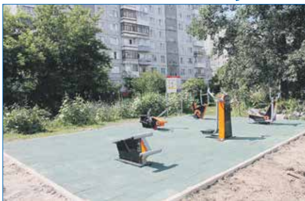
Обустройство покрытия на детской площадке, ул. Кропоткина, 134