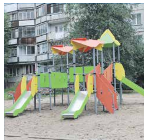
Установка новой детской площадки в рамках проекта «Территория детства» от партии «Единая Россия» по ул. Олеко Дундича, 1