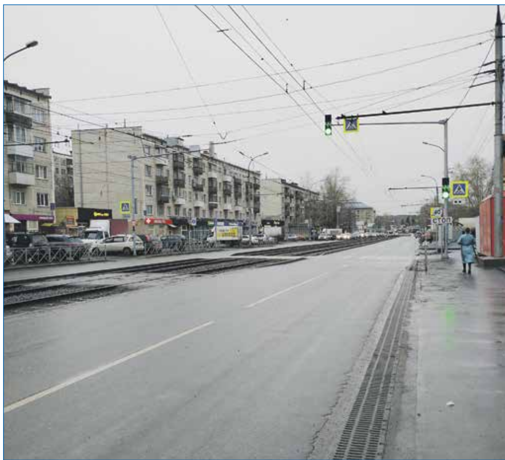
Улица Учительская после ремонта

В летне-осенний период 2023 года состоялся комплексный ремонт улицы Учительская. Работы, стартовавшие в начале июля, полностью завершены в ноябре.