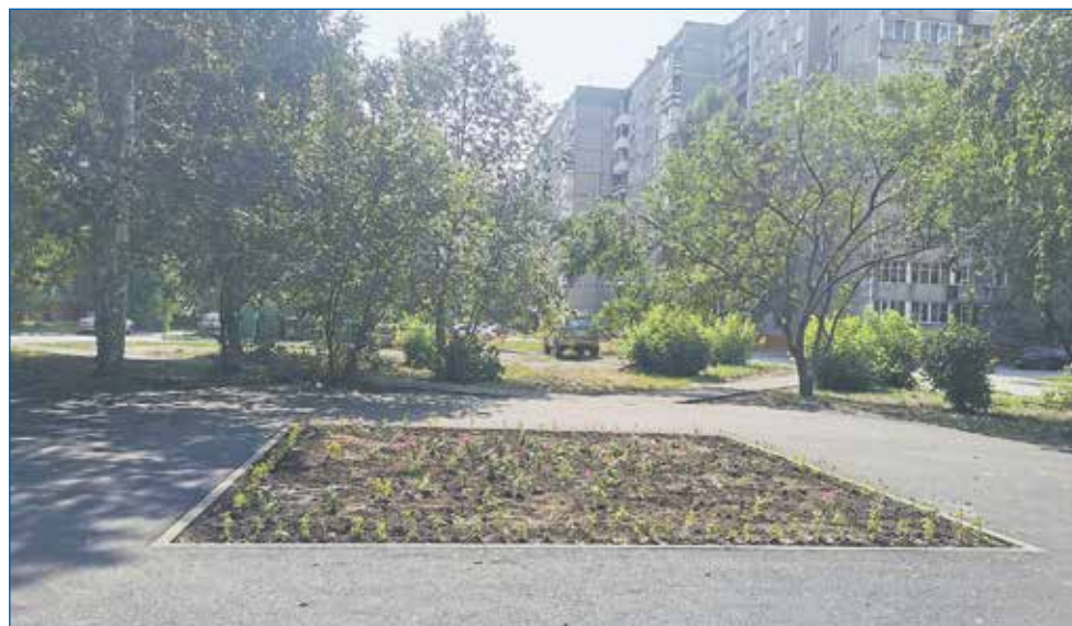
Еще недавно здесь было заброшенное место