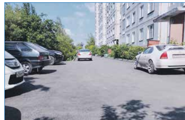
Благоустройство придомовой территории дома №24/1 ул. Учительская