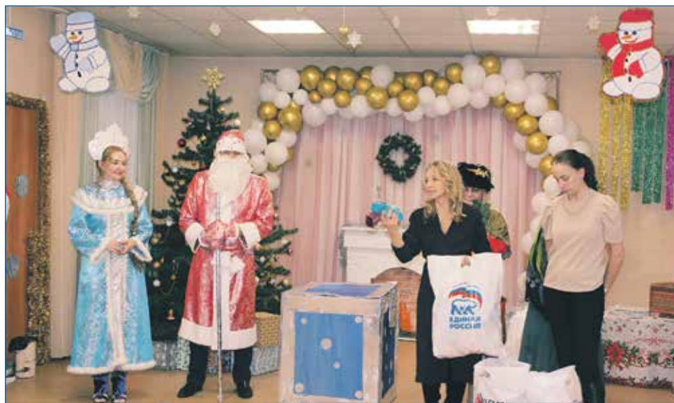
Предновогодний праздник в социально-реабилитационном центре для несовершеннолетних «Снегири»

Из средств, выделенных депутату на выполнение обращений граждан, установлено игровое, спортивное оборудование,