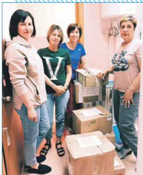
Детский сад № 72, сбор гуманитарной помощи