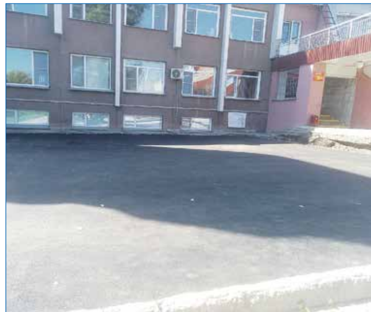
Долгожданное асфальтирование площадки около ДДТ им. А. Гайдара

ми элементами детская площадка у дома № 29 по ул. Макаренко