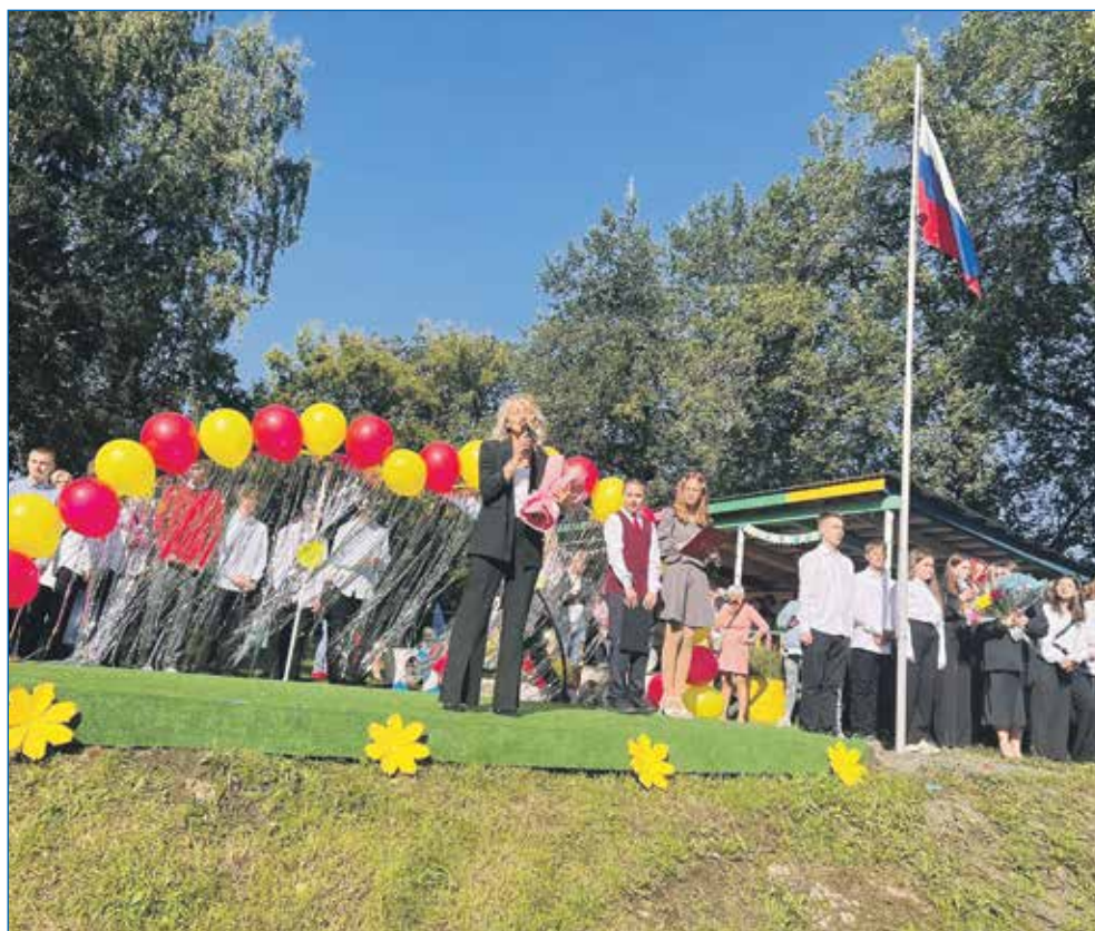
День знаний — начало очередного этапа на пути к новым вершинам

Новосибирск, как крупнейший муниципалитет страны, должен быть готов к качественному участию в этом развитии. И Совет депутатов города Новосибирска