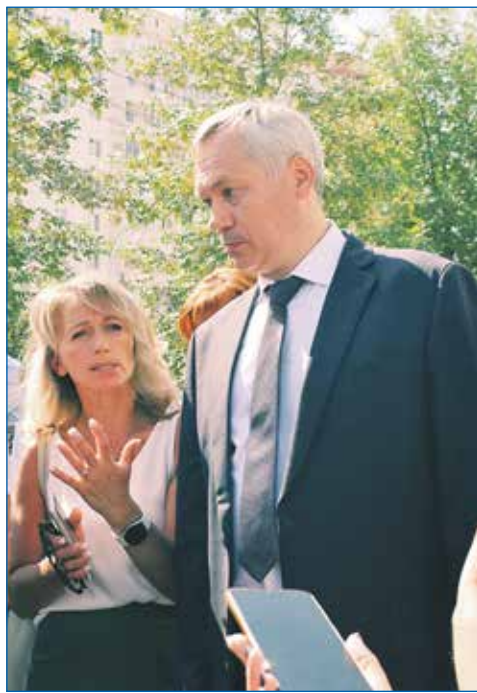
Визит губернатора НСО Андрея Травникова в Калининский район