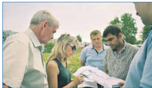
Рабочая встреча по вопросу реализации наказа — обустройству сквера в поселке Северный

Благодаря объединению инициативных жителей и депутатского корпуса, во дворах жилых домов наших микрорайонов по инициативе партии «ЕДИНАЯ РОССИЯ» реализуется проект «Территория детства». В 2023 году во дворе дома по ул. Тамбовская, 39 установлен детский городок.