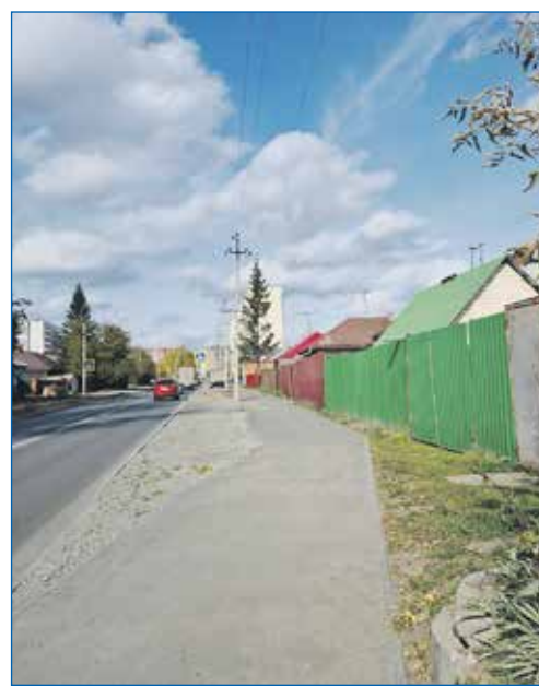
Обустройство пешеходных тротуаров на ул. Фадеева