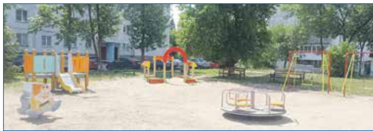
Ул. Макаренко 19/1, новые спортивная и детская площадки