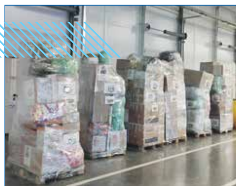
Сбор груза для отправки нашим воинам в зону СВО

В сборе помощи особую активность проявили участники группы «Поможем нашим! Регион 54», а также жители пос. Северный,