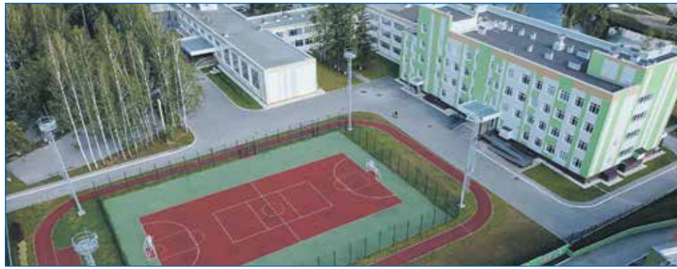
Образовательный кластер в микрорайоне Стрижи

В 2023 году был открыт пункт льготной выдачи лекарств.