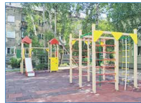
В частном секторе тоже необходимы современные детские площадки!

Теперь у школы шикарный стадион, открытый для всех и ставший центром притяжения в микрорайоне. Там люди гуляют, занимаются спортом, скандинавской ходь-