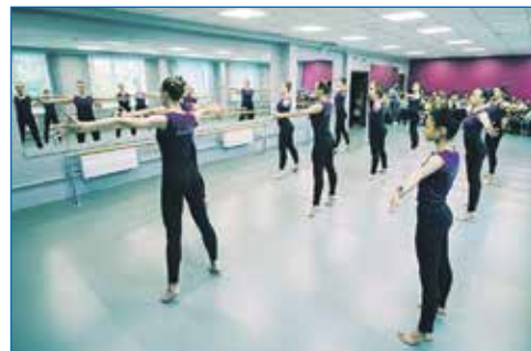
Необходимо формировать новые площадки для занятий детей

лично. Для меня эти встречи — мощный источник информации о реальном состоянии дел на округе, позволяющий узнать потребности жителей той или иной территории, актуализировать их. Например, решая вопрос по благоустройству только так можно выяснить, что новосибирцы хотят видеть в конкретном месте: сквер, парковку, детскую