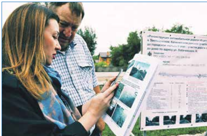
Реконструкция ул. Кедровой на всех этапах проходила под контролем депутатов

Депутаты «Лиги эффективности» уверены, что все это лишь начало большого пути и впереди много дел на благо Заельцовского района и его жителей.