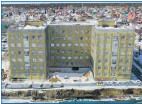
Поликлиника на ул. Ереванская

На округе №10 по адресу: ул. Кубовая, 99/2, второй год работает новая шестиэтажная поликлиника, рассчитанная на 500 посещений в сутки. Это уникальное учреждение, где на площади почти в семь тысяч квадратных метров, взрослые и дети могут получить самый широкий спектр медицинских услуг. Прием ведут узкие специалисты, есть кабинеты неотложной помощи, выдачи справок, профилактики и дополнительного лекарственного обеспечения, и, что немаловажно, к поликлинике обустроены подъезды и тротуары. Появления современного медучреждения очень ждали как жители микрорайона Стрижи, так и Новосибирского района, проживающие поблизости.