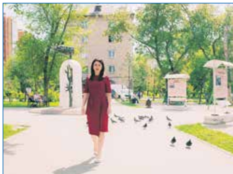
Сквер Поколений сегодня — любимое место отдыха жителей микрорайона Стрижи

— Многие новосибирцы, особенно пожилые, не понимают разделения сферы полномочий депутатов местного, регионального или федерального уровней, да и, в общем-то, не должны. А кто может быть ближе к людям, чем депутат на округе? Люди приходят в мою общественную прием-