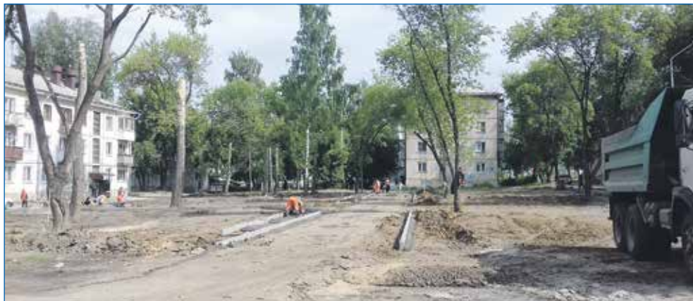
Процесс обустройства Сквера Поколений