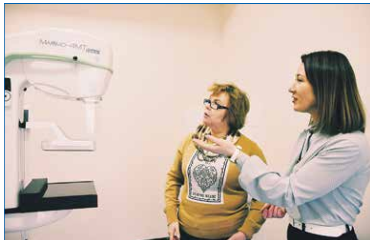
Поликлиника в микрорайоне «Стрижи» оборудована по последнему слову техники