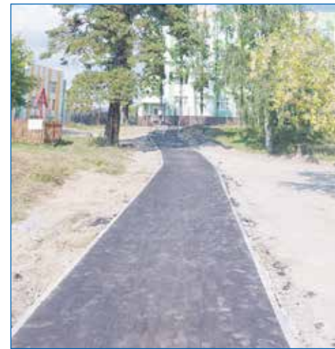
Долгожданный тротуар к школе №51

То, с чем к муниципальным депутатам активно идут горожане. Это, конечно же, благоустройство придомовых территорий, например ремонт дворовых проездов, обустройство парковок, спил аварийных и высаживание новых деревьев, обустройство клумб, установка детских и спортивных площадок.