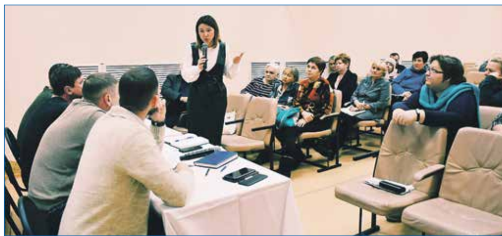
Встреча жителей с представителями УК

ную, к моим коллегам-депутатам со своими проблемами. Мы стараемся откликаться на все запросы, занимаемся всем, начиная от уборки мусора и снега с дорог, обустройства общественных пространств до контроля хода строительства поликлиник и школ. Несмотря на то, что множество вопросов относится к сфере деятельности федеральных и региональных субъектов, коммерческих компаний, возможностей и способов воздействия у муниципального депутата все равно побольше.