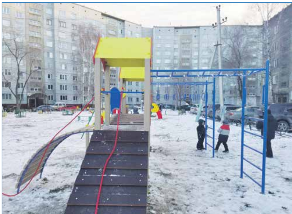
Самые острые вопросы решаются на месте, а не в кабинетах

и мешать ему не нужно. А когда стране мешает внешний агрессор, важно сохранять спокойствие внутри страны. И единственный, кто может сегодня все правильно скоординировать, правильно решить, наш действующий Президент Владимир Владимирович Путин.