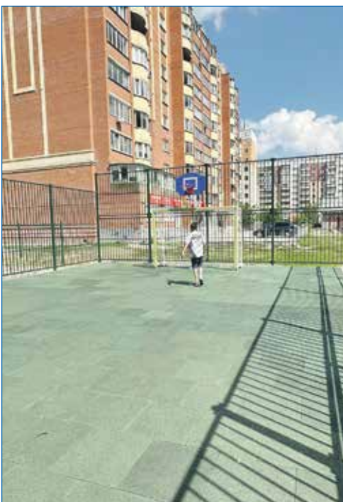
Во дворе дома №74 на улице Плеханова по проекту «Территория детства» открыта спортплощадка

— Миссия депутата — это видеть, слышать жителей, быть в сложные моменты с ними, представлять их интересы в органах власти. Чтобы жители знали и понимали, что они не одни, что с ними всегда есть депутат, в любое время дня и ночи. Могу добавить, что многие активные жители, старшие по улицам и домам знают мой номер телефона. И знают, что можно ко мне обратиться для решения и экстренных, и самых обычных житейских вопросов.