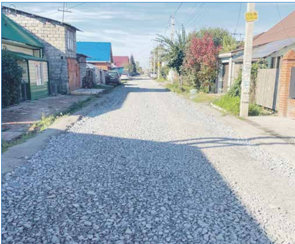
Выполнено щебенение частного сектора: на улице 5-го декабря — между домами №№55 и 99