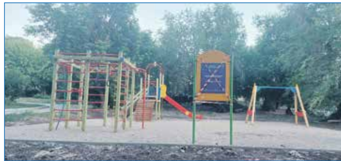
Проект «Территория детства». Открытие детской площадки на придомовой территории ул. Путевая, 16

не было зафиксировано обязательство выделить муниципалитету землю под создание образовательных учреждений. Поиски решения проблемы затянулись, и проект школы на Лесоперевалке не успел попасть в нацпроект по строительству школ. У застройщика есть проект школы и есть разрешение на ее строительство, но нет финансирования. Стоимость строительства такого объекта составляет порядка 2,5–3 млрд рублей. Самостоятельно реализовать такой проект застройщик не сможет, а без строчки в бюджете банки не готовы предоставлять финансирование. Сохраняется возможность попасть в какую-нибудь федеральную программу по строительству социальных объектов. В настоящее время на этой территории работают три застройщика, я надеюсь, что они найдут вариант, который сдвинет решение этой проблемы с мертвой точки. Для нашей команды это одна из приоритетных задач.