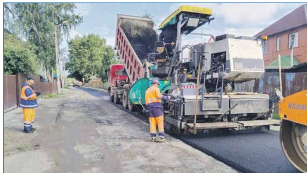
Работы по асфальтированию и ремонту дорог на улицах и переулках мкр Лесоперевалка