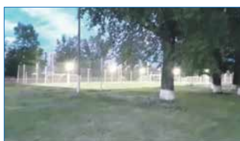
Проведены работы по освещению спортивной площадки МБОУ СОШ №72

— Не секрет, что есть множество проблем, с которыми отдельный депутат справиться не может. Что вы делаете, когда сталкиваетесь с такими проблемами?