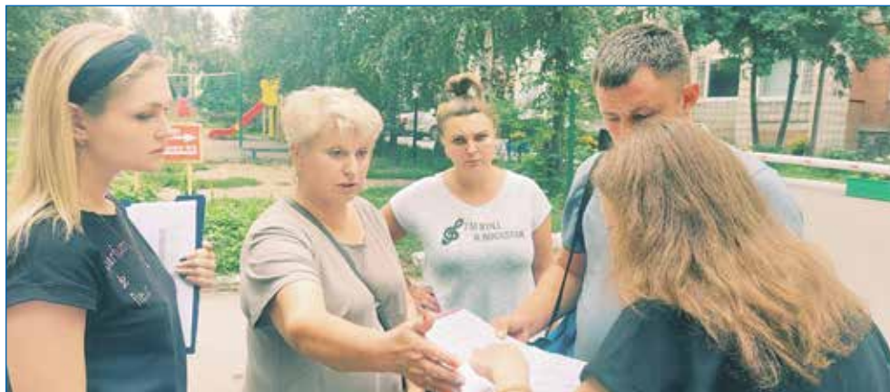
Обсуждение планов благоустройства детских и спортивных площадок на улицах Пермитина, 3/2, Котовского, 5 и 7, Титова, 2

Еще одна важная проблема — школы. Если проблема с детскими дошкольными учреждениями в целом в городе стабилизировалась, за исключением некоторого количества отдельных территорий, то школ не хватает. Действующие учреждения образования, в том числе и недавно построенные, переполнены. Один из вариантов решения проблемы, который прорабатывается в департаменте образования, — репрофилирование отдельных детских садов под начальные школы. Также существенно может помочь федеральная программа «Стимул», в случае если в перечень ее мероприятий внесут со следующего года возможность финансирования строительства образовательных учреждений.