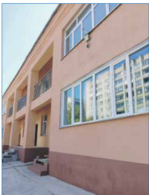
Ремонт фасадов зданий МКДОУ №88

Очень удобный инструмент — дистанционное голосование. Я сам воспользовался им на выборах губернатора. Это отнимает 30 секунд, чтобы подать заявку на «Госуслугах», и 30 секунд, чтобы выразить свою позицию на специализированном сайте. Это очень удобный инструмент.