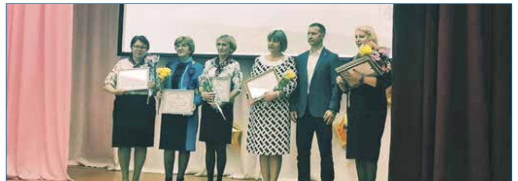
Школа №183 отметила свой 55-летний юбилей. Александр Бестужев поздравил коллектив, воспитанников и ветеранов школы с юбилейной датой. Вручил почетные грамоты и благодарственные письма от депутатов Кировского района