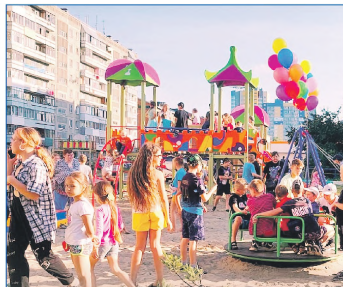
Открытие детской площадки в микрорайоне Затон