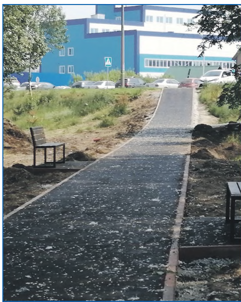
В сквере «Зеленый остров» сделано асфальтирование