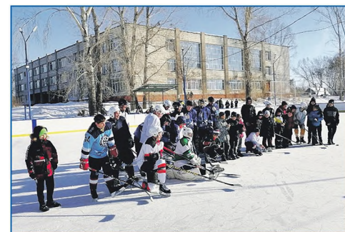
День Защитника Отечества в микрорайоне Затон