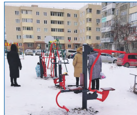
Наказ по организации спортивных тренажеров на ул. Портовая выполнен