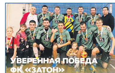
УВЕРЕННАЯ ПОБЕДА ФК «ЗАТОН»

Заново восстановлена хоккейная коробка на территории школы №69 в мкр. Затон.