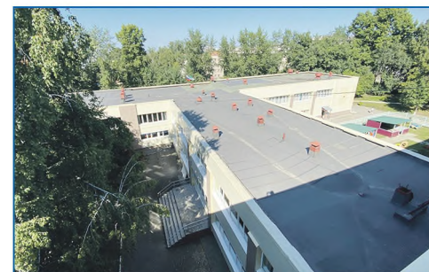
Ремонт мягкой кровли МБОУ СОШ №56