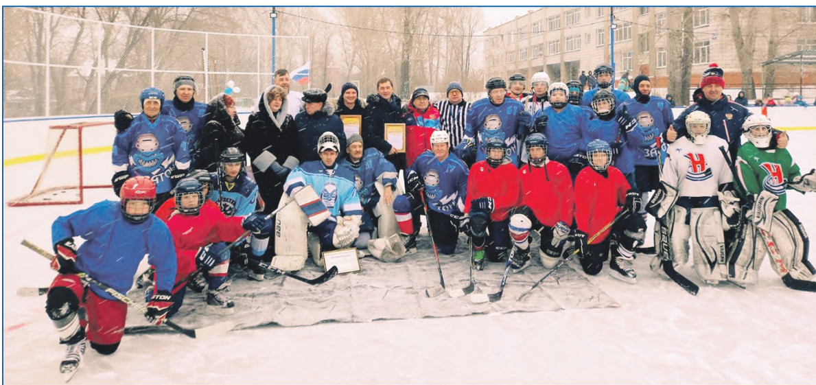
Открытие хоккейной коробки в микрорайоне Затон