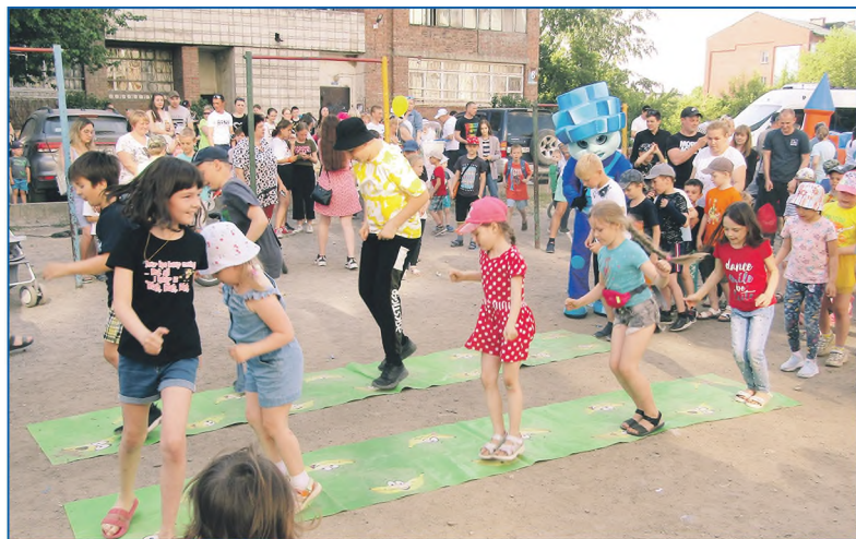
День защиты детей прошел на трех площадках в микрорайонах Затон, Лесоперевалка и Телецентр

Соответственно, люди проживают в достаточно сложных условиях. Там и прохудившиеся кровли, и старые коммуникации, нет современных удобств, какие-то строения вообще заваливаются, и в них становится опасно жить. Приходится содействовать переселению людей в маневренный фонд, пока на данном этапе не дошла очередь до расселения.