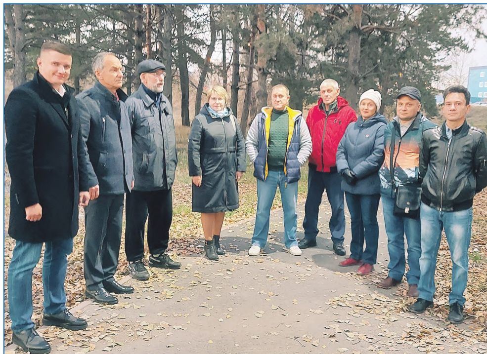
Депутат встретился с членами правления РОО «Сохрани родной дом» для обсуждения дальнейшего плана развития территории

Произведен спил и обрезка аварийных деревьев на придомовой территории дома ул. Путевая, 11. Выпол-