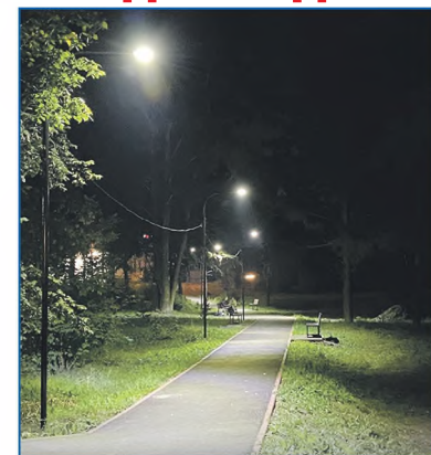
В сквере установлено уличное освещение

«Здесь уже сделаны тротуары, есть кольцевая дорога. Установлены скамейки. Также в 2021 году мы получили грант на освещение. Будем продолжать делать дорожки для полноценных пешеходных маршрутов. Жители также хотят обустроить здесь сцену для проведения культурно-массовых мероприятий. Обязательно будем это делать. Думаю, что здесь появится полноценный парк», — выразил уверенность Александр Савельев.