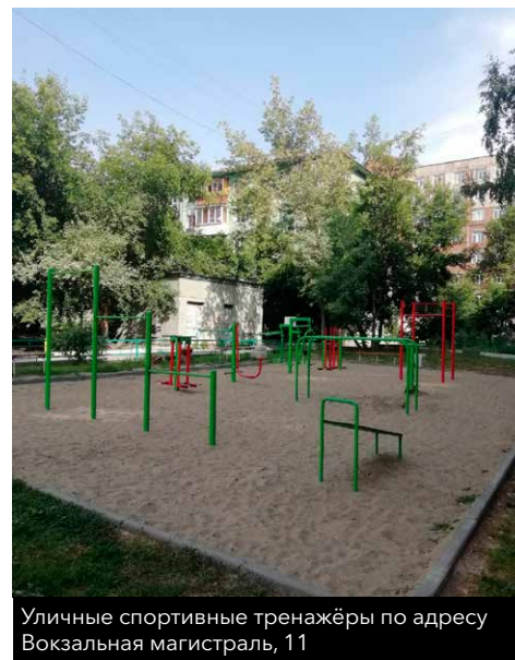
Уличные спортивные тренажёры по адресу Вокзальная магистраль, 11