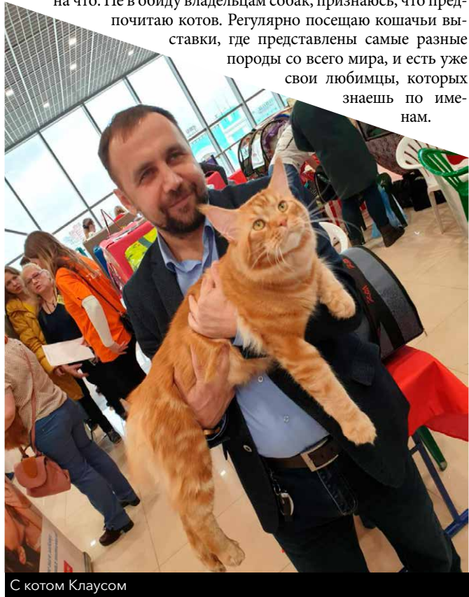
С котом Клаусом

Конечно, однозначно сказать нельзя, ведь у каждого животного свои особенности – кошки лучше помогают снимать стресс и успокаивают своим урчанием, им приписываются лечебные свойства, а собаки более преданны, охраняют хозяина и всегда готовы помочь в беде. Но и у тех, и у тех есть одно важное свойство – это настоящий друг человека, любящий его несмотря ни на что. Не в обиду владельцам собак, признаюсь, что предпочитаю котов. Регулярно посещаю кошачьи выставки, где представлены самые разные породы со всего мира, и есть уже свои любимцы, которых знаешь по именам.