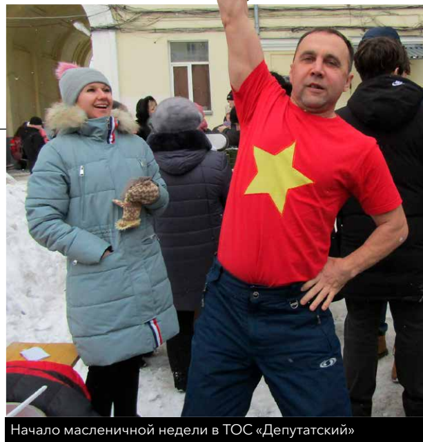
Начало масленичной недели в ТОС «Депутатский»

тимского района. Там имеется возможность купаться всю зиму. Вода в купели там чистейшая, родниковая, родная молва приписывает ей целебные свойства. А для ежедневного закаливания есть доступное каждому средство – холодный душ. Стараюсь рассказывать об этом и своим примером пропагандировать закаливание, ведь закалка – это то, что отличает сибиряка от жителей более тёплых районов нашей необъятной родины.