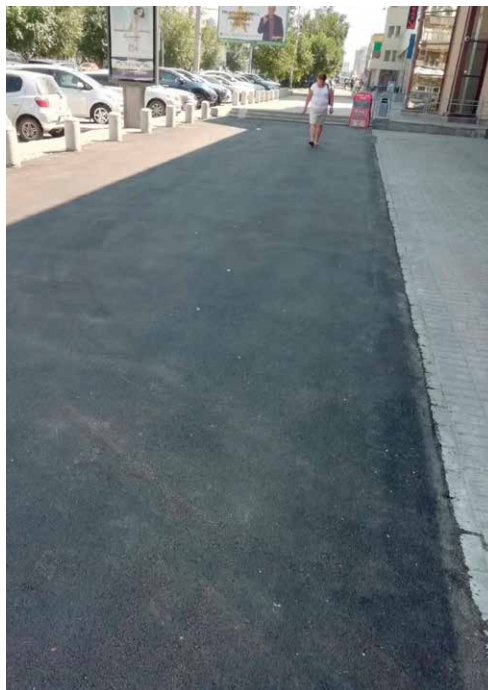
Новый асфальт на тротуаре по Вокзальной магистрали