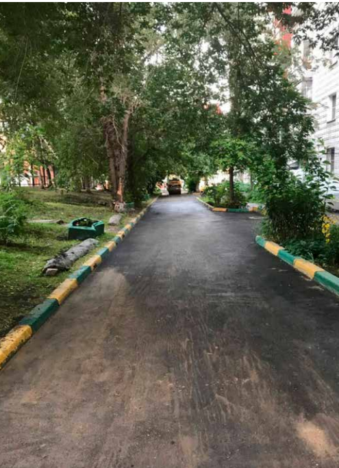
Выполнено благоустройство двора по ул. Революции, 6