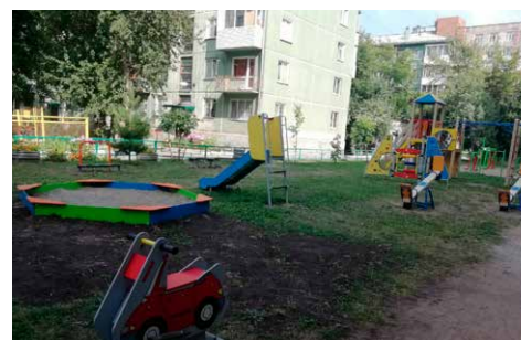
Установлен детский городок по адресу Вокзальная магистраль, 11