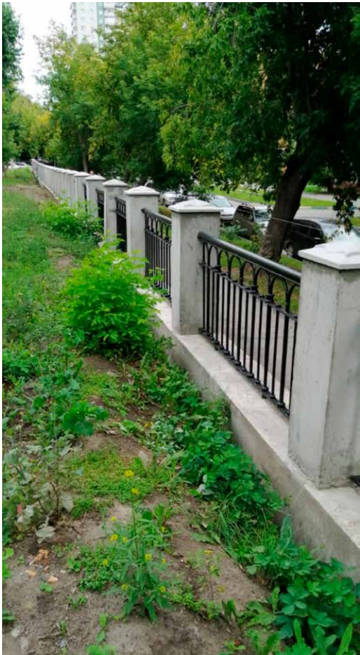
Восстановлена ограда по ул. Сибирской, 31