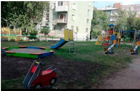
Установлен детский городок по адресу Вокзальная магистраль, 11