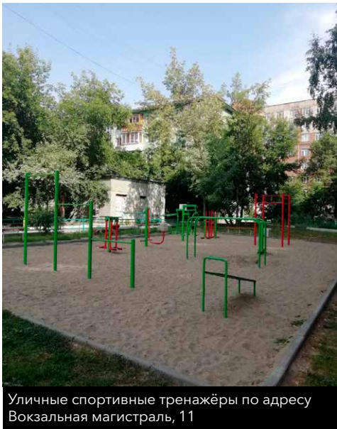
Уличные спортивные тренажёры по адресу Вокзальная магистраль, 11