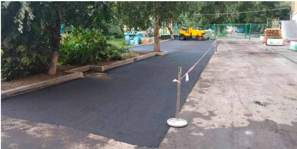
Новые парковочные карманы по адресу ул. Советская, 49