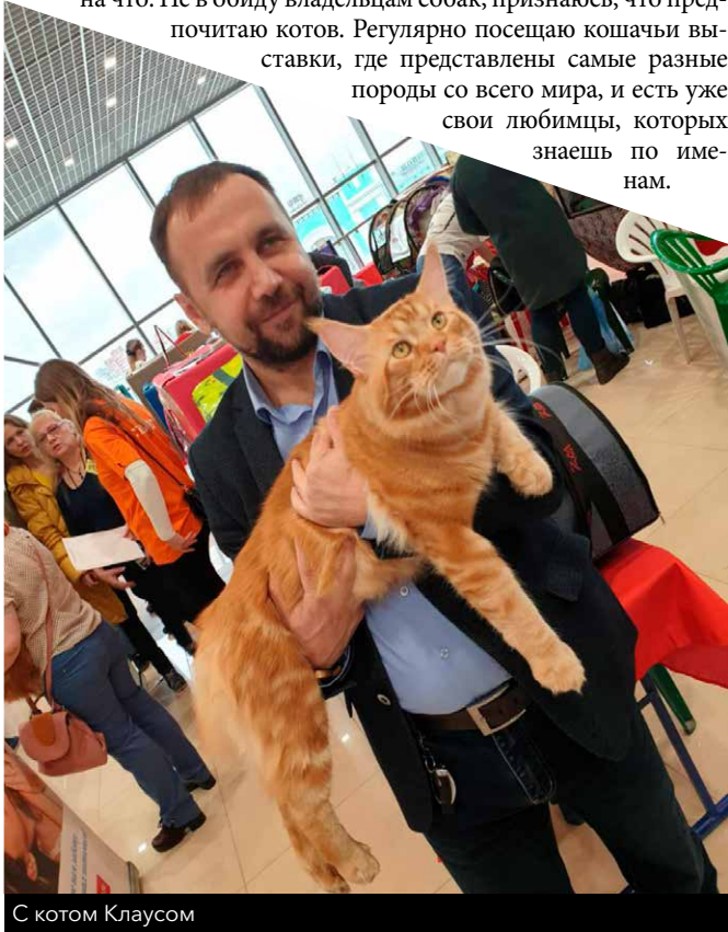
С котом Клаусом

Конечно, однозначно сказать нельзя, ведь у каждого животного свои особенности – кошки лучше помогают снимать стресс и успокаивают своим урчанием, им приписываются лечебные свойства, а собаки более преданны, охраняют хозяина и всегда готовы помочь в беде. Но и у тех, и у тех есть одно важное свойство – это настоящий друг человека, любящий его несмотря ни на что. Не в обиду владельцам собак, признаюсь, что предпочитаю котов. Регулярно посещаю кошачьи выставки, где представлены самые разные породы со всего мира, и есть уже свои любимцы, которых знаешь по именам.