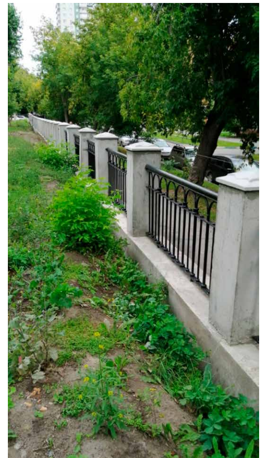
Восстановлена ограда по ул. Сибирской, 31