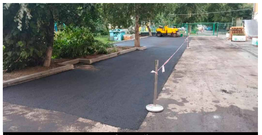
Новые парковочные карманы по адресу ул. Советская, 49