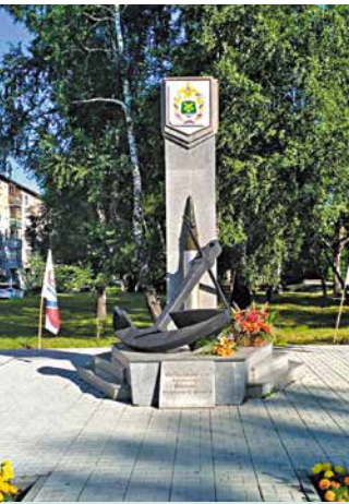
Памятник ветеранам 118-го Арсенала Военно-Морского флота

Организован новый маршрут общественного транспорта сообщением с 5-м, 6-м микрорайонами, Стрижами и Пашино.