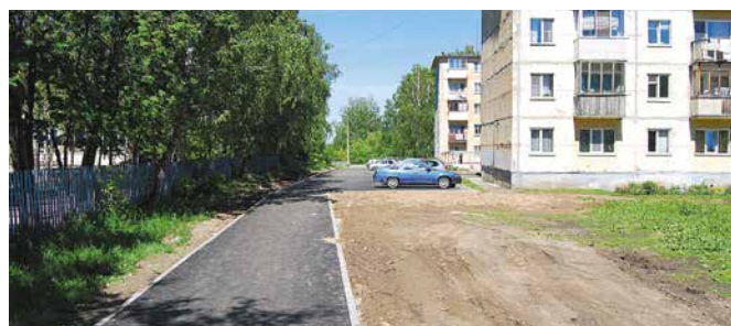
Отремонтированы внутриквартальные и придомовые территории