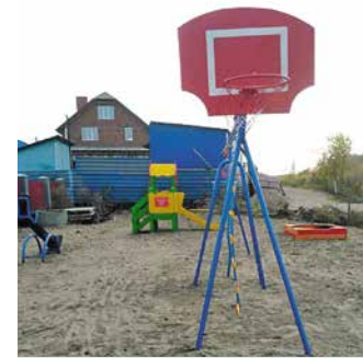
Детский городок в частном секторе на ул. Дергунова