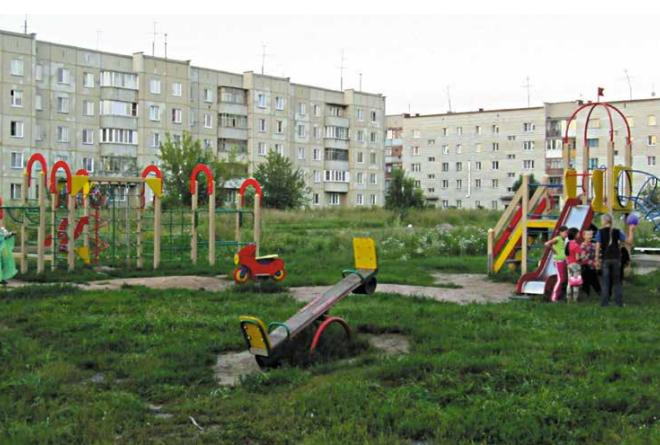
Детский городок на улице Магистральной, 51б

Закончены работы по освещению частного сектора (остановка общественного транспорта «Деревообрабатывающий комбинат»). Начаты работы по освещению по ул. Сидорова, Захарова, Ратной, Шелуховостова, Дергунова, Заволокина, Кудрина, Полевого, от улицы Солидарности до стелы на улице Никифорова.