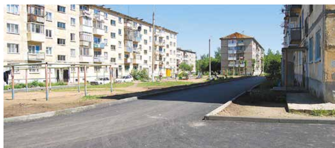
Благоустройство в микрорайоне Гвардейском

Установлены и дооборудованы детские городки по адресам: ул. Флотская, 18, ул. Магистральная, 51 и 51а, ул. Новоуральская, 16, ул. Новоуральская, 29а, Солидарности, 93а, в частном секторе на ул. Дергунова, а также дооборудованы