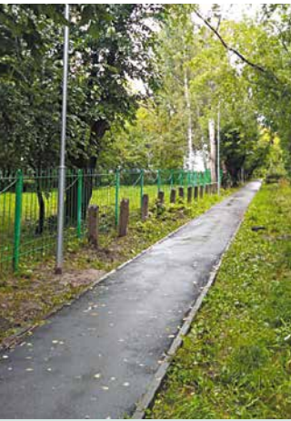
На округе № 15 активно ведутся работы по освещению улиц

городки на ул. Новоуральской, 19/8, ул. Магистральной, 57а, ул. Магистральной, 59.