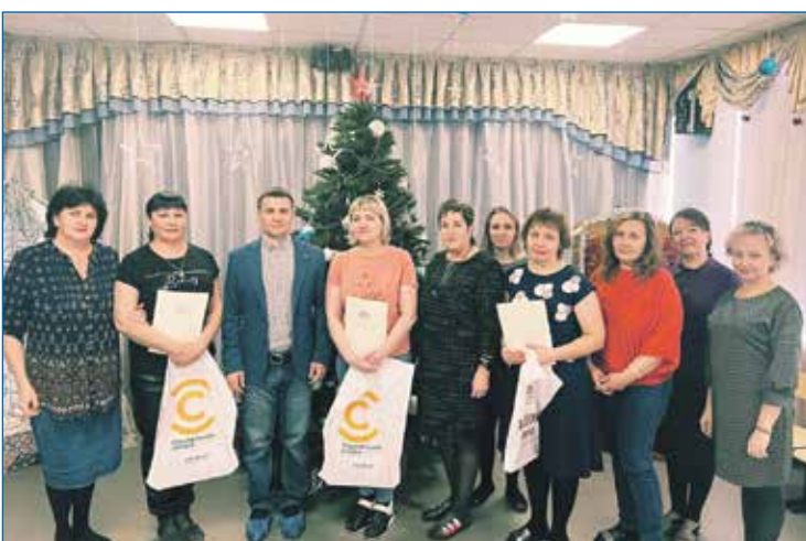
Вручение благодарственных писем работникам детских садов

Личный прием депутата: ул. Маяковского, 4, каб. 409, по четвергам с 15:00 до 17:00 по предварительной записи