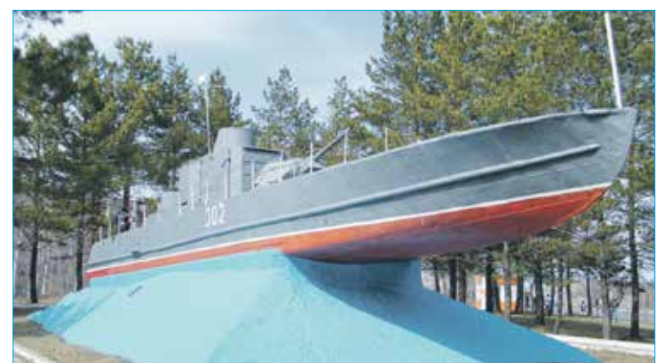
Новосибирский бронекатер БК-302 в Хабаровске