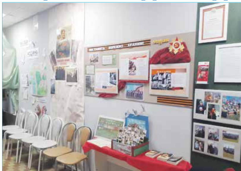
В отремонтированном помещении ТОС «Восточный» теперь уютно

В прошлом году совместными усилиями удалось отремонтировать крышу помещения ТОСа, провести его косметический ремонт (за счет средств бюджета города). Кроме того,