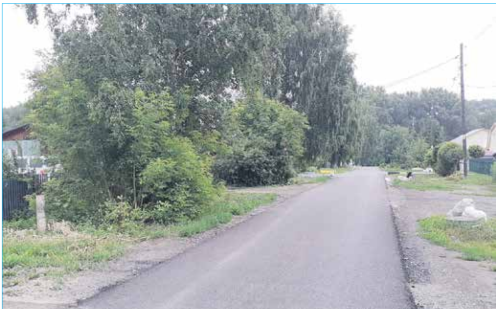
Заасфальтированная улица Железняк