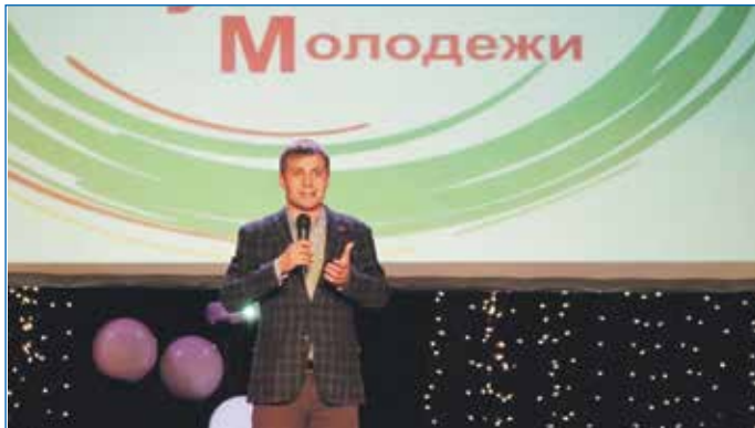
Открытие Форума молодежи Первомайского района