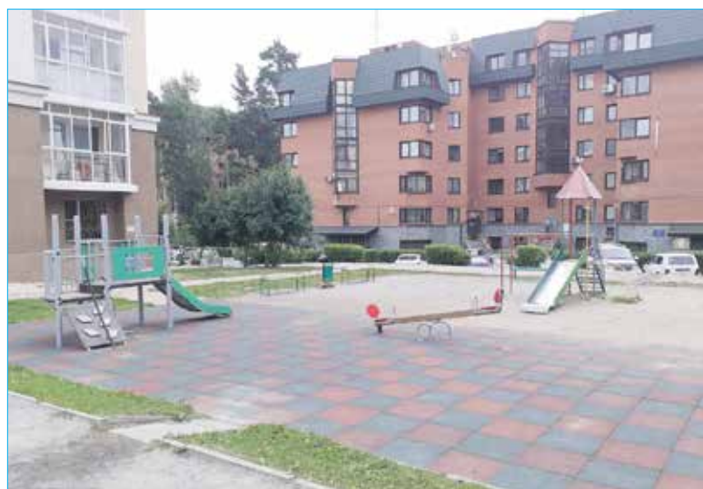
Завершено обустройство новой детской площадки

Еще в ходе избирательной кампании Павел Горшков отмечал, что одной из самых частых просьб жителей было благоустройство дворов, а также организация детских и спортивных площадок на территории каждого двора. Эти просьбы стали наказами, некоторые уже реализованы — так, за 2,5 года на округе появилось около 20 новых детских и спортивных площадок.