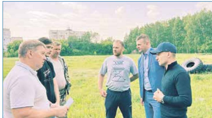
Контроль работы по выполнению наказа

ственную деятельность, тут нужен соответствующий формат. Хорошим примером является субботник в Детском парке — там был ведущий, играла музыка, привычный для любого субботника сбор мусора проходил как соревнование. Это дало свои результаты. Ведь в современном обществе существует негласное правило: какие мероприятия бы ни проходили, они должны быть интересными. Тогда вовлечь людей проще.