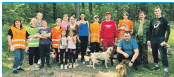
Сохраним зеленую Первомайку

При поддержке Депутатского центра обновилась и инфраструктура спортзала — приобретены две большие беговые дорожки, один массажер для спины, совсем недавно комплекс тренажеров пополнился еще одним — «Гребля». Так что ничего не мешает ко Дню физкультурника и юбилею отделения провести большой спортивный праздник.