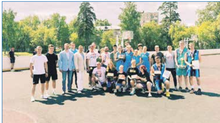
Команда Депутатского центра выбирает спорт

— Да, работа с подрастающим поколением мне всегда была интересна — и в качестве члена Молодежного парламента, и в качестве тренера по борьбе. Готов согласиться с тем, что молодежь трудно замотивировать на обще-