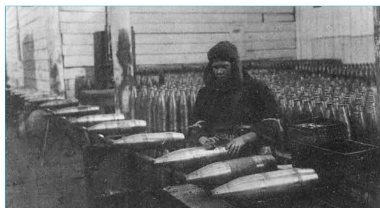
Использование ската в цехе доделочных операций