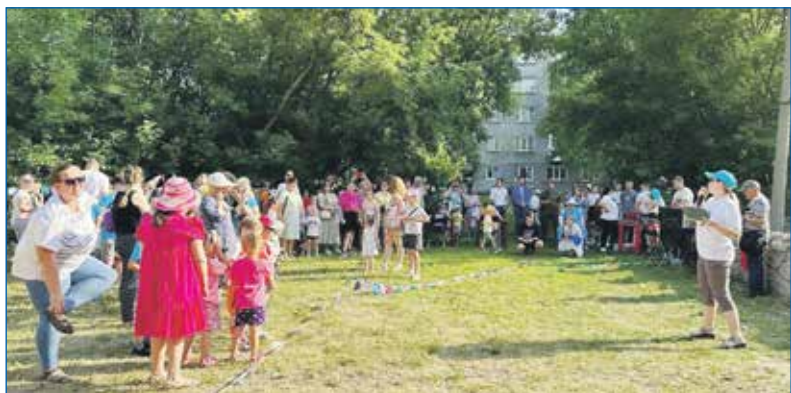
День защиты детей на Шмидта 6 провела команда депутата и УК Перспектива