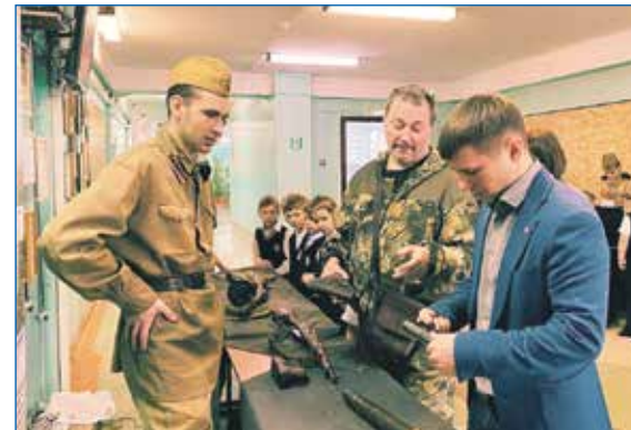
Патриотическая акция «Любить Родину»