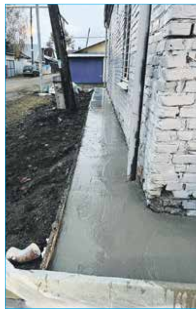
Завершение ремонта здания ТОС «Восточный»

В июне 2023 года ситуацию вокруг бани «Бодрость» рассматривали на заседании комиссии по научно-производственному развитию и предпринимательству Совета депутатов города Новосибирска. На комиссии было принято решение открыть баню в сентябре текущего года. Необходимые документы, на основании которых она может работать, есть.