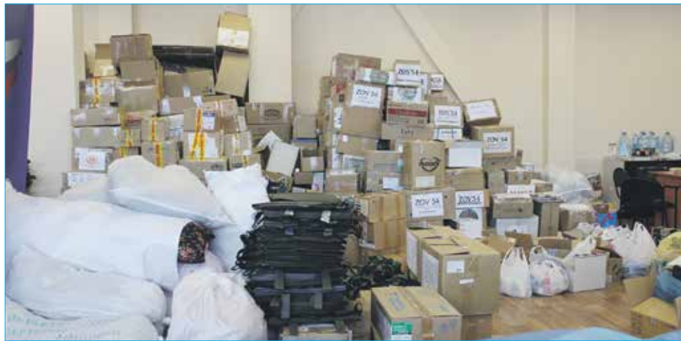
Волонтерский центр ZOV-54 работает на округе уже почти год

За прошедшее время у нас произошли существенные подвижки с обустройством светофоров. Не так давно появились саморегулируемые светофоры по ул. Гребенщикова в районе дома №5 и по ул. Свечникова в районе остановки «Ул. Свечникова», а также светофоры по Красному проспекту на пересечении с ул. Мясниковой и с ул. Тюленина. Также