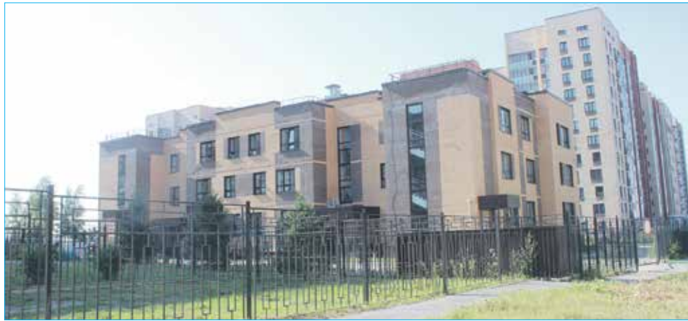
Третий корпус детского сада №77 на Красном проспекте

— Прежде всего, хочу сказать, что это серьезное нововведение с внесением изменений в устав города Новосибирска. И сама процедура подразумевает создание специальных конкурсных комиссий, определение очень жестких кри-