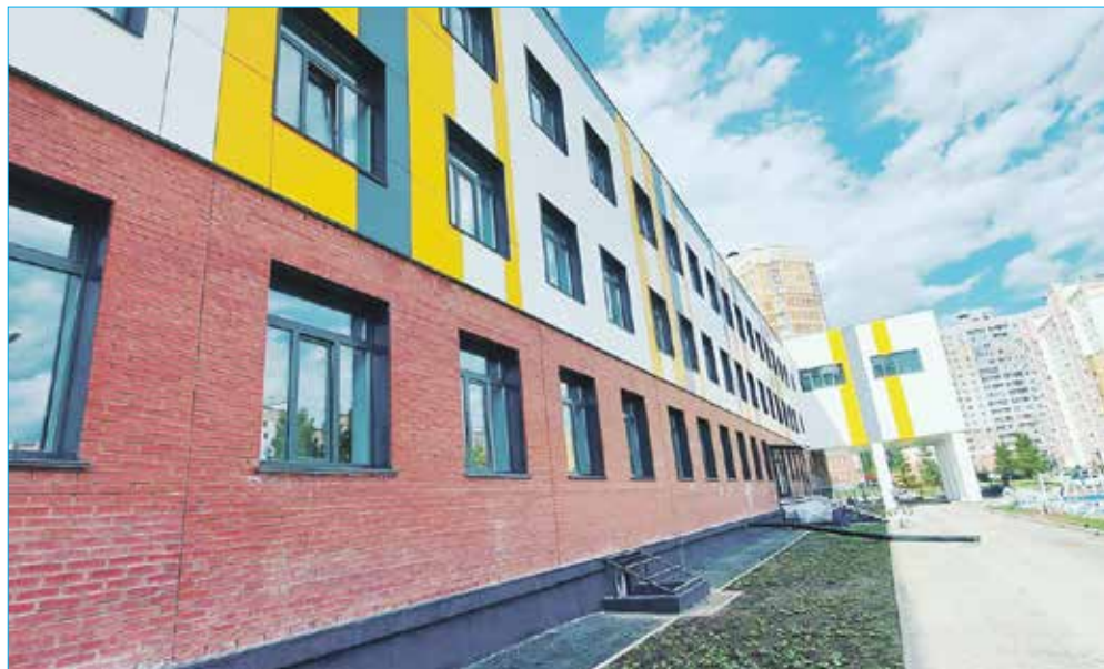
Строительство двух школ — №218 и №219 — одно из самых значимых событий в жизни округа №16 за последние несколько лет

— Для нас актуальна проблема строительства школы и детского сада — с учетом перспективы дальнейшего развития и застройки округа, и это одни из основных моментов, которыми мы продолжаем заниматься. Очевидно, что уже сегодня объектам дошкольного и школьного образования тяжело справляться с нагрузкой. Также по-прежнему остается актуальной проблема со школой искусств в Родниках. Сейчас ближайший филиал находится в школе №173 в Юбилейном. Над этим вопросом тоже работаем.