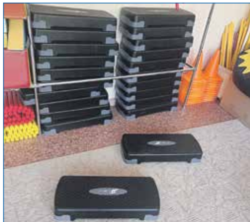
Детский сад №357: новые степы