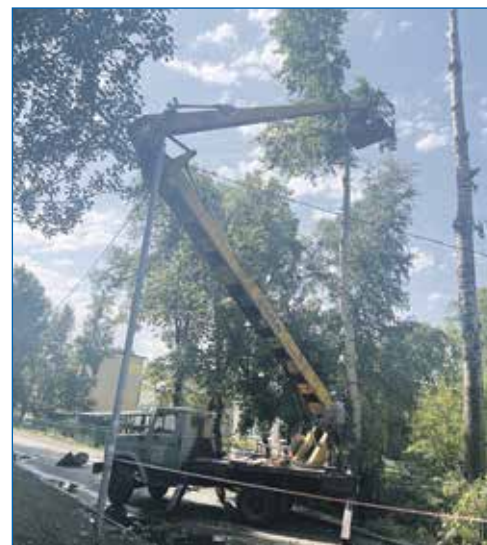
Детский сад №72, спил деревьев