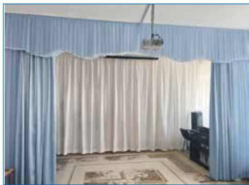
Детский сад №5: новые шторы