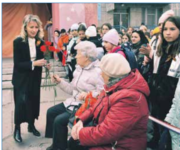
Праздник, посвященный Великой Победе

Конечно же, в общественную приемную жители тоже приходят. Расписание работы приемной знают, но даже если кто-то и забудется, все равно его примут мои помощники. Но когда ты живешь на территории долгие годы, многие знают твой номер телефона, то могут позвонить или написать в WhatsApp в любое время. Есть много обращений на моей странице во ВК. Вот такая ситуация с приемом граждан. С одной стороны, это упрощает взаимодействие с избирателями, с другой — хочется хоть изредка отвлечься от работы. Остаться наедине с семьей. Спрашиваете, может, мне переехать отсюда? Нет, конечно. Здесь моя жизнь. Здесь моя работа. Здесь я депутат.