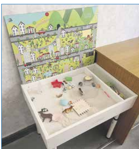
Детский сад №357: стол для занятий