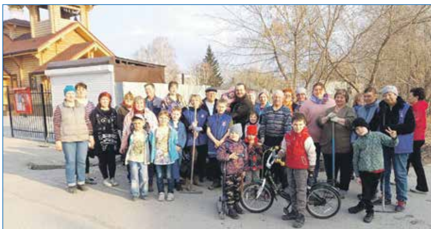
Возле храма Георгия Победоносца навести порядок на площадке под обустройство сквера и на прилегающей территории