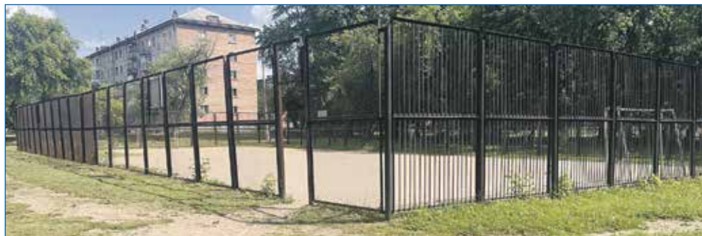
Школа №184, ремонт ограждения спортивной площадки