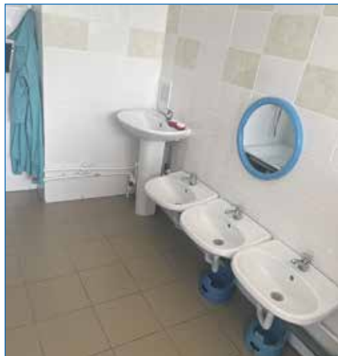
Детский сад №72, ремонт туалетной комнаты