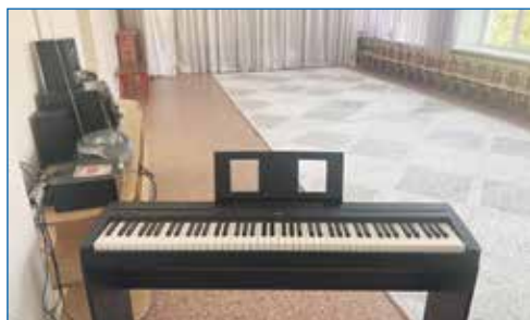
Детский сад №357: новые музыкальные инструменты и ковры