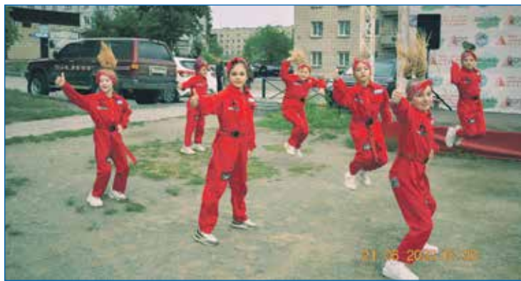
День города в п. Северный

Продолжая тему подростков, нашей молодежи, хочется заметить, что сейчас мы очень много усилий направляем на то, чтобы их социализировать и занять полезными делами. Мы очень плотно сотрудничаем с колледжами, на многие мероприятия привлекаем студентов. У нас сложилась хорошая традиция волонтерских акций, трудовых десантов для жителей частного сектора. Особенно осенью для уборки огородов и зимой в борьбе со снегом мы оказываем существенную помощь одиноко проживающим инвалидам, ветеранам, вдовам, пожилым семьям. Когда мы начинали создавать волонтерские отряды, при общении с молодежью обратили внимание как с неохотой, скептически они отнеслись к этой идее. Но в процессе акций, по итогам оказанной конкретной помощи отношения ребят меняются. Они видят свою востребованность, видят результаты своего труда, видят тех, кому помогли, и слышат слова благодарности от взрослых, пожилых людей, и это кардинально меняет отношение к подобным мероприятиям. Да и для многих это первый опыт общения поколений — живут-то в основном с родителями, бабушка с дедушкой или далеко, или их уже и нет. По завершении таких акций ребята говорят: «Мы с удовольствием придем еще, приглашайте». И приходят. Специально при старте каждого десанта интересуюсь: кто впервые пришел. И всегда поднимается несколько новых рук, а многих волонтеров мы уже знаем в лицо и поименно. Очень важно, чтобы в раннем возрасте молодежь понимала свою нужность, значимость