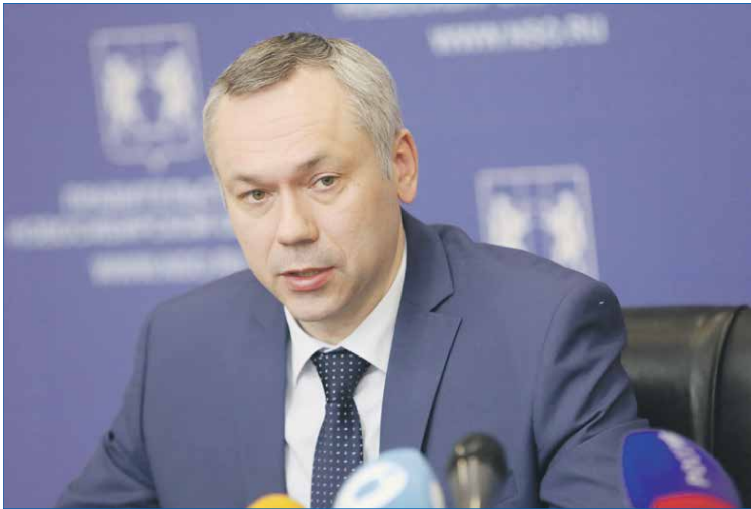
Андрей Травников, губернатор Новосибирской области

Летние мероприятия для детей и подростков, оставшихся на каникулах в городе, стали традиционными. На День Защиты детей или праздник, посвященный Дню знаний, а также полюбившийся День соседей приходят и дети, и взрослые, но многие жители приходят уже семьями. Тем более в концертных программах выступают творческие коллективы из ближайших центров дополнительного образования «Гайдар», «Патриот», где школьники после уроков занимаются в кружках по интересам. Юные артисты своим примером мотивируют других ребят уйти с улиц и подъездов в центры и дают повод для гордости родителям. Такие праздники с продуманной интересной программой — как для молодежи, так и для взрослых, позволяют соседям познакомиться ближе, подружиться. Эти мероприятия объединяют жителей микрорайонов «Юбилейный» и «Северный».