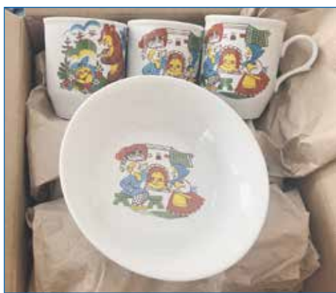
Детский сад №357: новая посуда