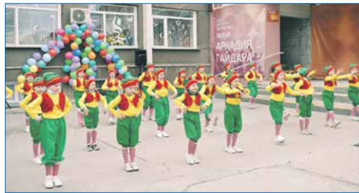
День города в микрорайоне «Юбилейный»

и полезность и двигались дальше по жизни с полным пониманием своих возможностей в общественном пространстве.