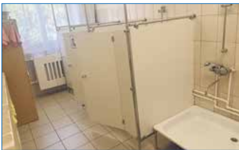
Детский сад №5, ремонт туалетной комнаты