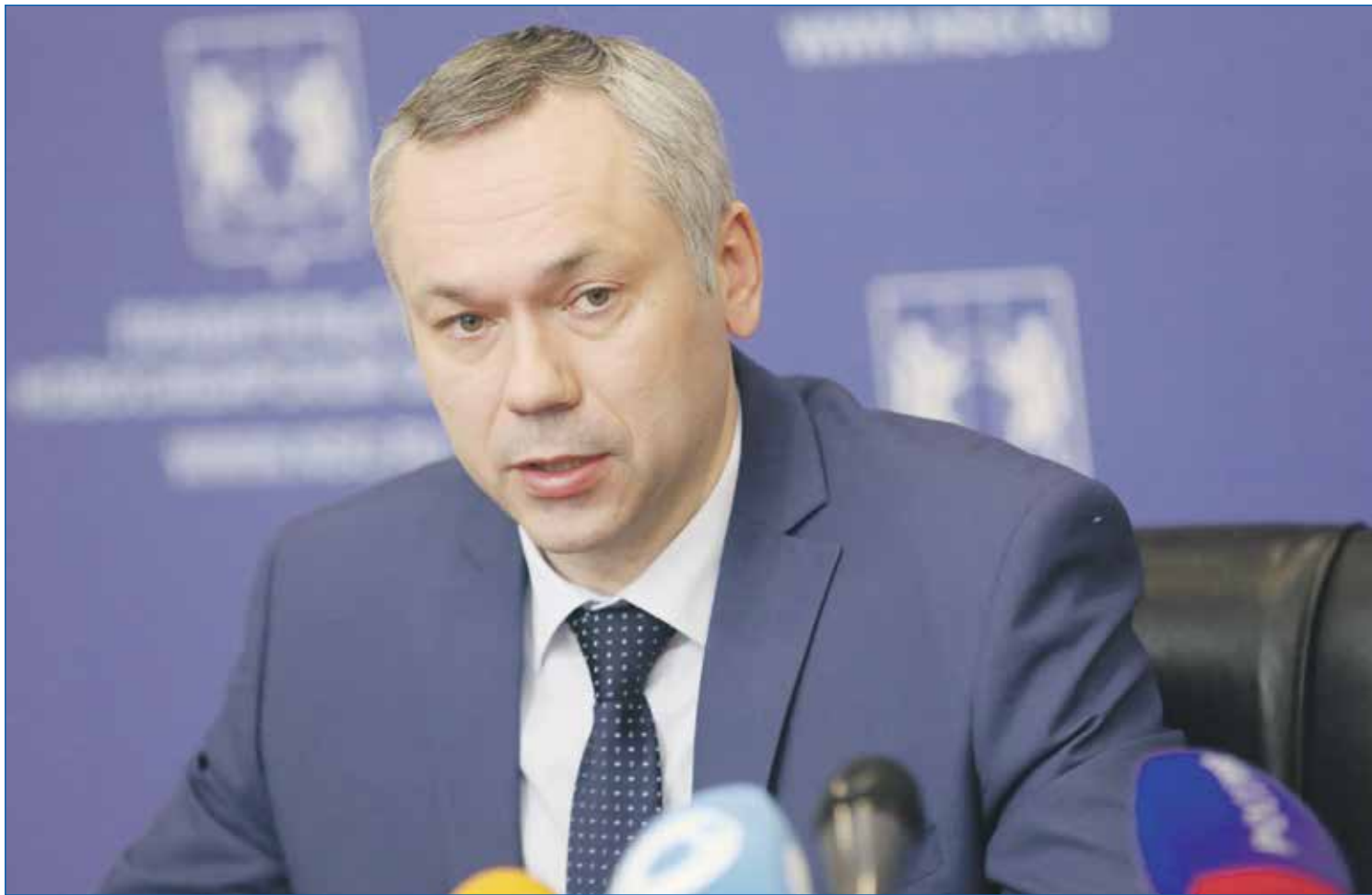
Андрей Травников, губернатор Новосибирской области

— Работа в администрации района в должности муниципального служащего — это работа в рамках утвержденных регламентов, с четким