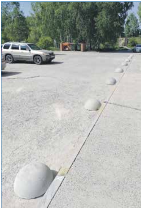
Закупка и установка бетонных полусфер для жителей многоквартирных домов

Помогаем нашим жителям и вопросы капитального ремонта домов решать, если