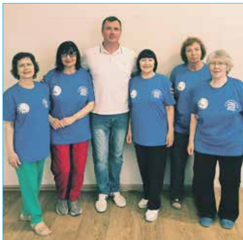
Купили спортивные футболки для активных жителей округа

собственники жилья принимают решение провести его раньше, чем предполагается регламентами.