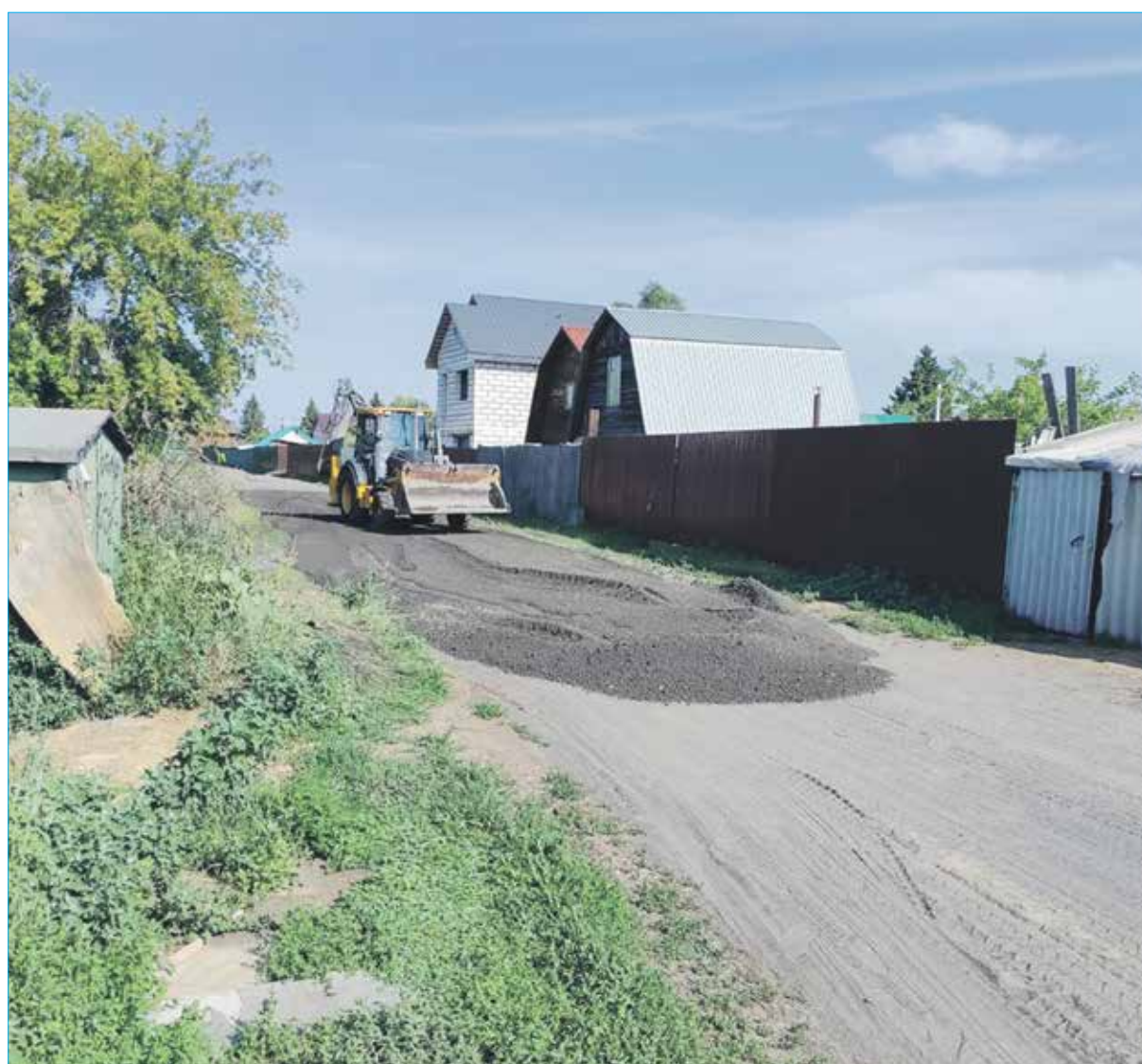
Идет отсыпка дорог частного сектора асфальтовой крошкой

— Я готов найти возможность и купить качественные современные лампы для частного сектора. Но дело тормозится из-за юридических вопросов. Муниципальные организации обязаны работать в рамках федерального закона №144 о госзакупках. В итоге, пока идут соответствующие процедуры, проблема с освещением частного сектора не решается. Для нормализации процесса замены ламп в частном секторе надо искать какие-то иные подходы, не нарушая действующих законов, — считает депутат.