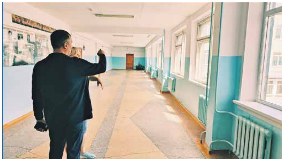
Реализация наказа по замене окон в здании средней школы №145