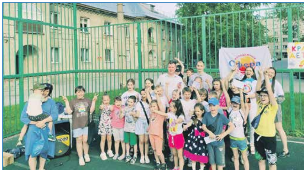
Финансирование культурно-массовых мероприятий округа

— Это как депутат решит. Можно сказать себе: я все сделал, у меня на территории порядок, указы исполняются. На самом деле, работа на округе не может закончиться. Тот, кто хочет работать,