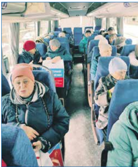
Предоставление транспорта жителям района для посещения культурно-массовых мероприятий

— Активность, есть и растет с каждым годом. В 2020 году, когда я только принял депутатский мандат, ко мне сначала никто даже на прием не приходил. Общение шло через соцсети, и касалось большей частью исполнения наказов. Но я же пришел на округ не отсиживаться, а что-то полезное делать. Я начал ходить по домам, по квартирам, знакомился с людьми, спрашивал, какая помощь нужна, какие проблемы их волнуют. И люди стали значительно активнее откликаться, участвовать в проектах и городских программах благоустройства.