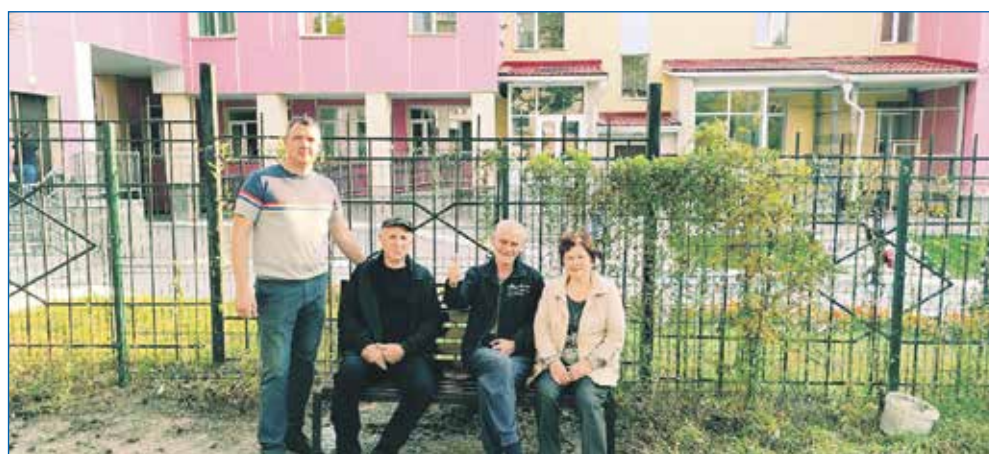
На придомовых территориях установили малые формы — лавочки