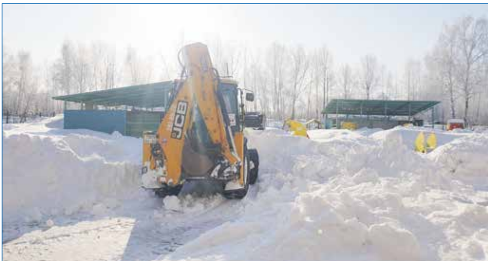
Убираем снег на территориях образовательных учреждений