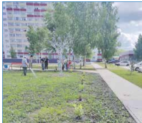
Благоустройство «зеленой сцены» на территории ж/м Березовое

— Впереди два с половиной года работы. Планов у меня очень много. Из того, что хотелось, сейчас сделано не больше трети. Думаю, что оставшиеся 2,5 года будут наиболее плодотворными, в том числе и по выполнению наказов избирателей. Очень надеюсь, что результаты порадуют меня и моих избирателей. В отношении следующего срока я буду ориентироваться на мнение жителей. Скажут: молодец, продолжай работать, буду продолжать.