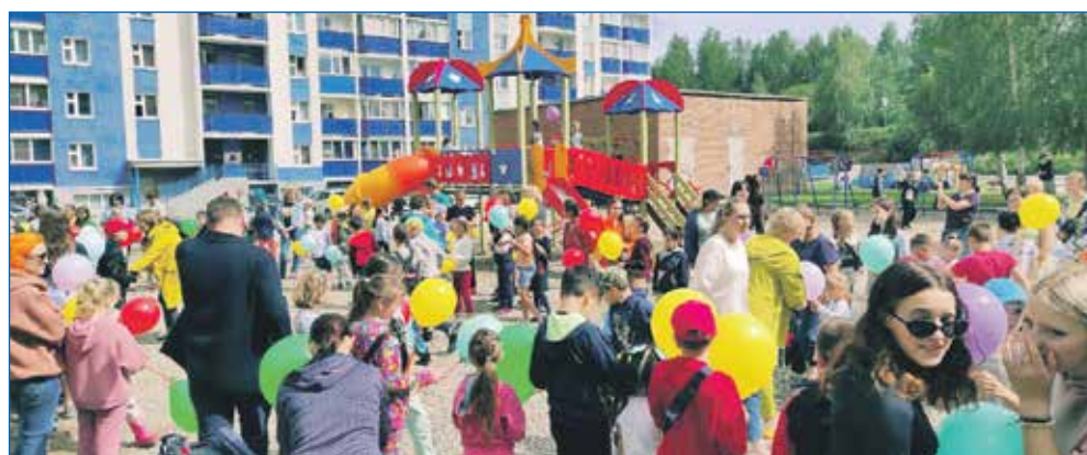
По обращениям граждан за счет реализации субсидии установили новый игровой комплекс