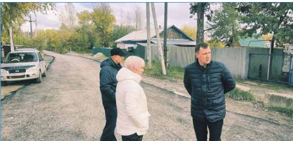
Идет реализация наказов по асфальтированию дорог частного сектора