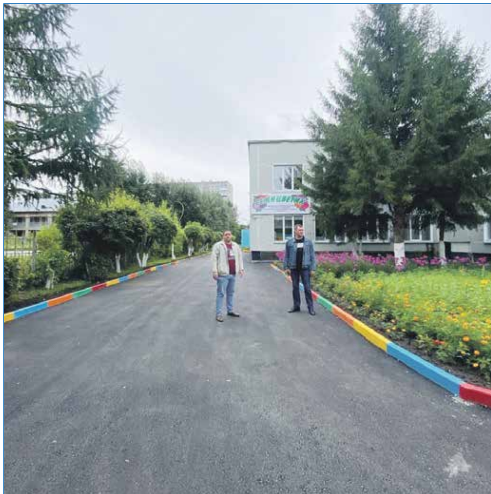
Реализация наказа по замене асфальтного покрытия на территории детского сада №447