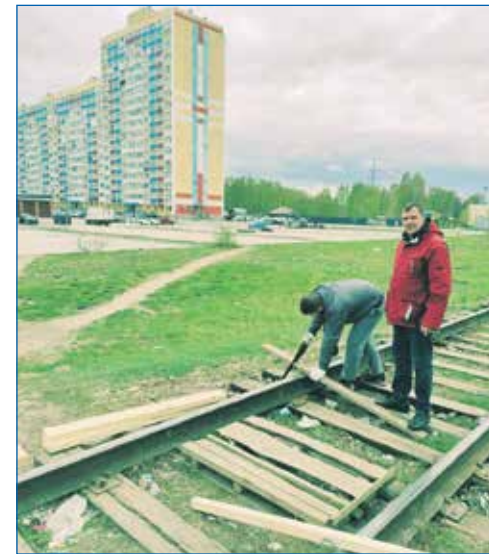
Ремонт перехода через ж/д пути на территории округа

Пока же проект регулярно обновляется и актуализируется, проходит государственную экспертизу. Требования меняются, стандарты повышаются и это должны учи-