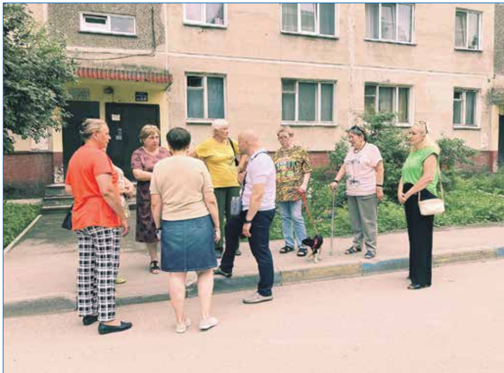
Все вопросы благоустройства депутат обсуждает вместе с жителями

— В нашем районе продолжается строительство новых корпусов поликлиники №13 и №22. Это две поликлиники из тех семи, что были заложены при участии губернатора Травникова. Мы благодарны ему за такое внимание к нашей Кировке, потому что это один из самых наболевших вопросов и своими силами без областной поддержки нам с ним справиться практически невозможно. Мы с коллегами держим на пристальном контроле ход строительства, выезжаем на объекты, чтобы понять, соблюдаются ли сроки и как в целом движется реализация проекта. Сейчас там возводятся стены, укладывается трубопровод ливневой канализации, монтируются системы электроснабжения и вентиляции.