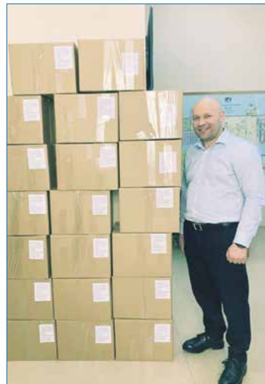
Гуманитарную помощь воинам СВО собирали, сортировали, и отправляли «газелями» из приемной депутата