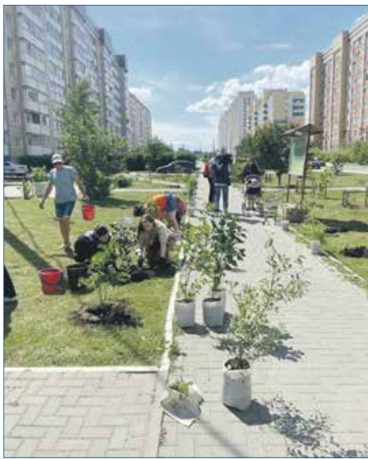
Высадка саженцев на аллее Виктора Уса

В этом году заканчивается проектирование новой школы в Акатуйском жилмассиве, которая будет построена рядом с поликлиникой. Некоторые задают вопрос «Почему так долго решался вопрос со школой?». Была проблема с выбором места. По проекту школа должна была находиться в частном секторе микрорайона Памирский. Ко мне массово поступали обращения родителей, что так далеко отпускать детей