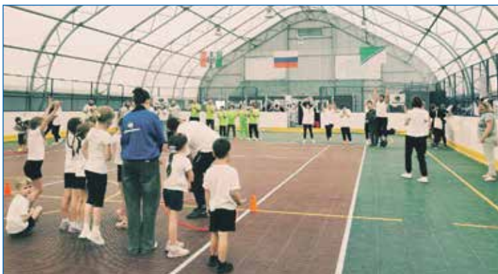
День светофора для малышей: в организации мероприятий на округе помогают волонтеры

Но, конечно, только спортом мы не ограничиваемся. У нас разработана и реализуется комплексная программа воспитания, социализации и профориентации подрастающего поколения. В рамках этой программы мы совместно с привлеченными специалистами и волонтерами действуем начиная с уровня детского сада. Для малышей организуем конкурсы рисунков и поделок. В школах переходим на следующий уровень. Привлекаем подростков в волонтерское движение, развиваем их самооценку как полезных для тех, кому они могут, и активных членов общества. Ведем профориентацию, организуем экскурсии на объекты самых разнообразных сфер деятельности: на промышленные предприятия, в учреждения культуры, в органы власти и местного самоуправления, на самые различные объекты. Для того, чтобы подростки могли предметно ознакомиться с самими разными видами трудовой деятельности и выбрать себе тот путь, по которому они захотят идти в своей такой близкой взрослой жизни.