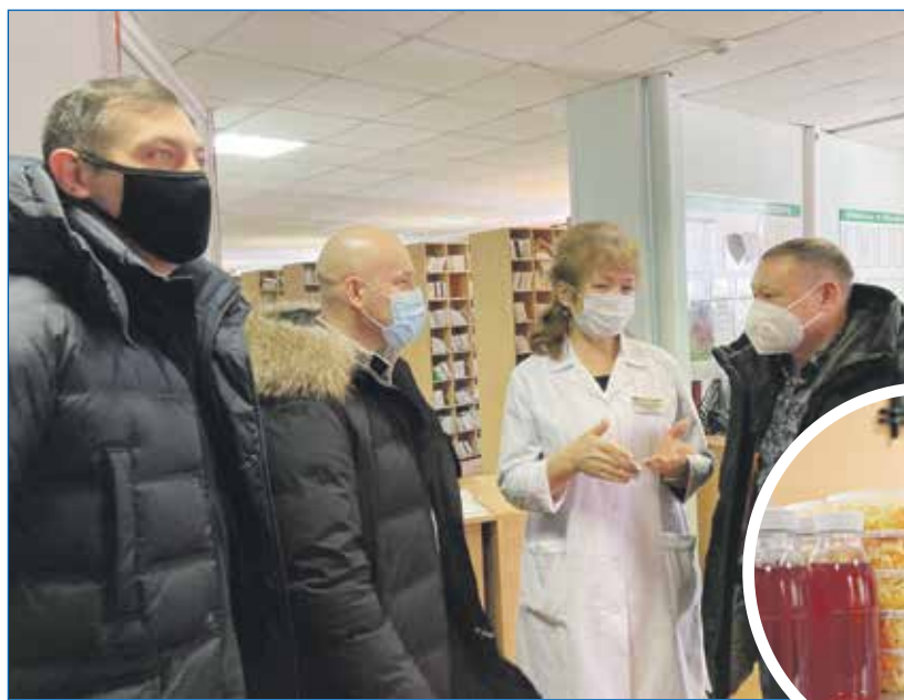
Депутаты привезли горячие обеды в поликлинику №22

мом командующего нашей сибирской 41-й общевойсковой армии. Эта работа не останавливается ни на один день. Очень приятно, что в нашем обществе все больше тех, кто хочет внести свой посильный вклад в победу справедливости. И, пользуясь случаем, хочу с этих страниц сказать большое спасибо нашим землякам за то, что в нас еще не утрачены такие, казалось бы, простые, но очень важные качества, как сострадание, взаимовыручка, сплоченность, чистосердечность и добрососедство.