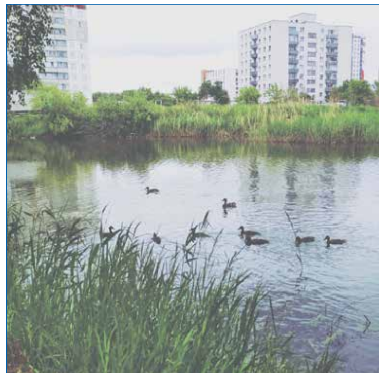
Озеро в Акатуйском жилмассиве

Еще один вопрос, который необходимо было решить, — это озеро, образовавшееся в микрорайоне Акатуйский. Оно стало излюбленным местом отдыха