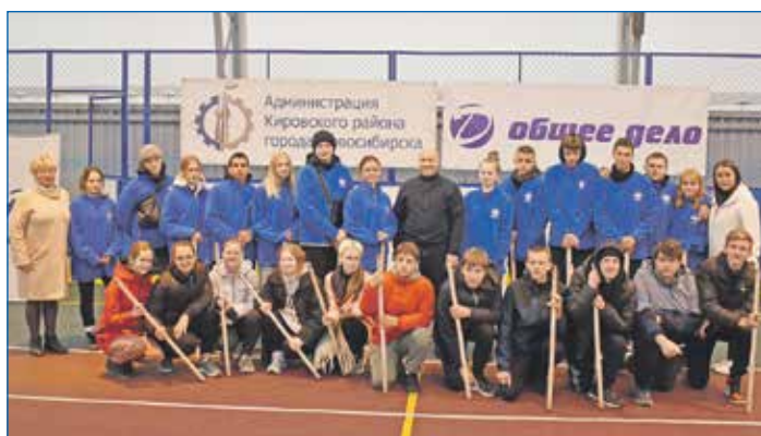
Игры в «пекарю», городки и лапту становятся популярными в Кировском районе

В последнее время острой стала проблема безопасных переходов и установка искусственных неровностей (лежащих полицейских) на внутриквартальных терри-