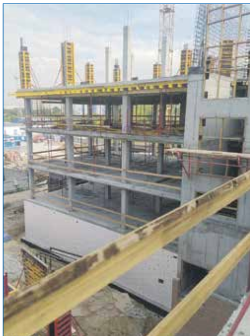
Строительство поликлиники в Акатуйском жилмассиве продолжается

Кроме того, новые поликлиники — это еще и дополнительные рабочие места, что тоже очень важно. В каждое из учреждений примут по 600 человек, которые на своем месте будут оказывать помощь детям и взрослым, обратившимся в поликлинику.