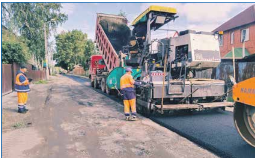
Определен объем работ по асфальтированию и ремонту дорог на улицах и переулках мкр Лесоперевалка