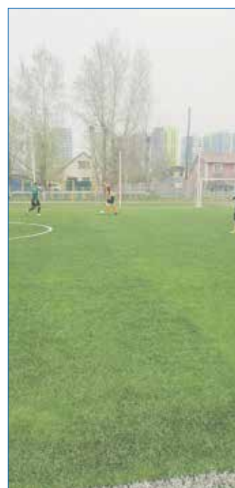
Искусственное покрытие футбольного поля в 72-й школе

тывать с бюджетами других уровней — участвовать в региональных и федеральных программах, нацпроектах. Мы говорим обо всех проблемах, записываем, держим в голове, что все не решается, но мы должны подсветить максимум вопросов. Вот поэто-