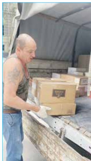
Сбор гуманитарной помощи

Также острой и актуальной остается проблема бездомных животных, особенно в частном секторе и территориях, где индивидуальная жилая застройка соседствует с многоквартирными домами. Сейчас у нас проектируется приют. Надеюсь, на следующий год мы сможем выделить деньги на его строительство. Но каким бы большим он ни был, проблему всего города одним только приютом мы не решим. К тому же содержание каждой собаки в приюте обходится в 10 тысяч рублей ежемесячно. Насколько мне известно, даже в европейских странах есть определенные правила, когда собаку помещают в место содержания на разумный срок (около по-