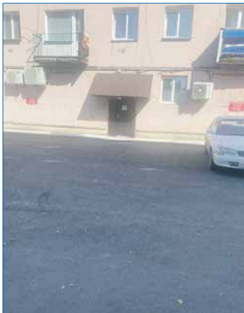
Выполнены работы по благоустройству придомовой территории жилого дома №7 по ул. 2-я Портовая мкр Затон