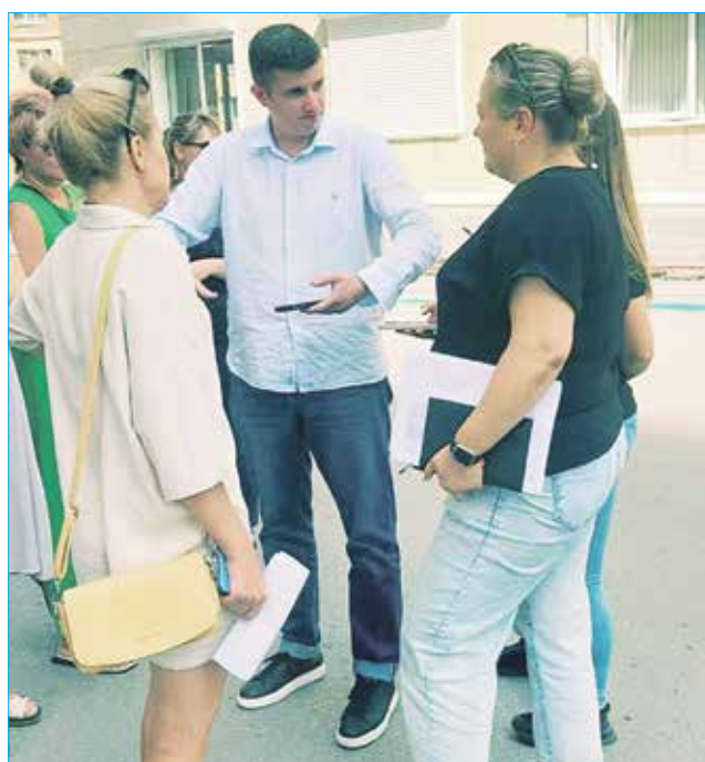
В ближайших планах начало работ по обустройству придомовой территории на территории дома мкр Горский, 8а

— Продолжение строительства метро. Мы считаем, что необходимо поднимать все проблемы, не замалчивать их, даже если кажется, что некоторые из них решить в настоящее время невозможно. Да, бюджет Новосибирска ограничен. Но это не значит, что нужно забыть о проблеме. Это значит, что нужно рабо-