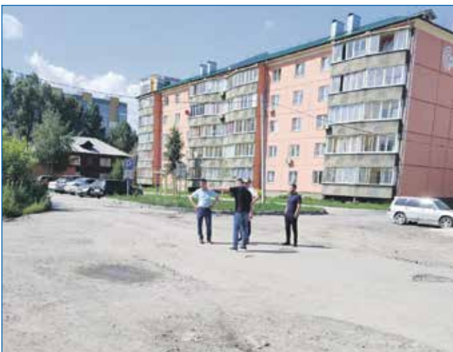
Ведутся работы по ремонту дорог мкр Затон