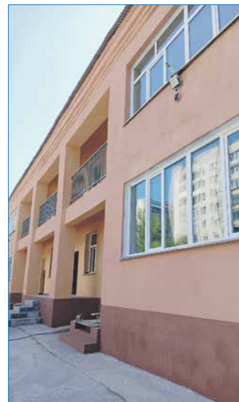
Ремонт фасадов зданий МКДОУ №88