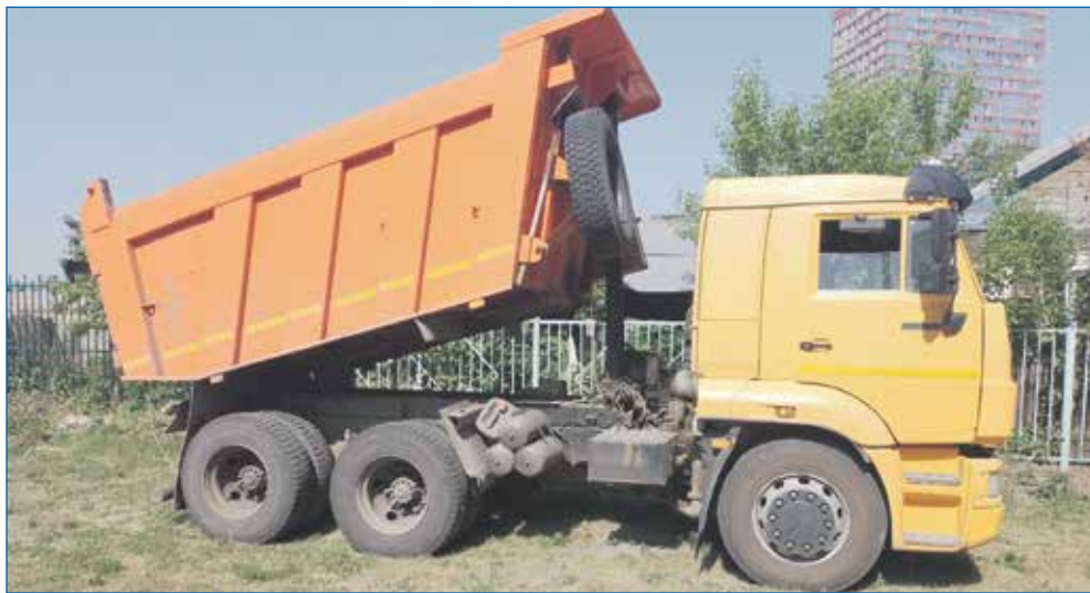
Работы по благоустройству школьной территории МБОУ СОШ №72