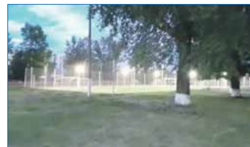
Проведены работы по освещению спортивной площадки МБОУ СОШ №72

Часть работ в рамках наказов избирателей сегодня находится в активной стадии производства работ. Это ремонт фасадов зданий МКДОУ №88 комбинированного вида по адресам: ул. Планировочная, 21, ул. Планировочная, 37. Также в работе ремонт дороги на ул. Портовой