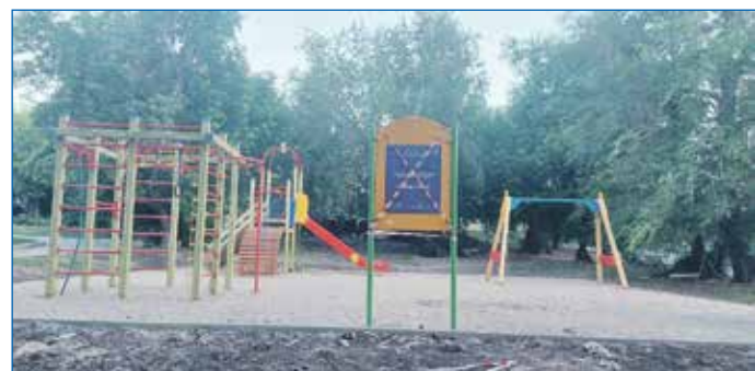
Проект Территория детства. Открытие детской площадки на придомовой территории ул. Путевая, 16