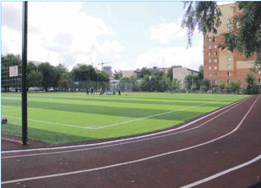
Новый школьный стадион (Вторая Новосибирская Гимназия, ул. Киевская, 5)

Участие в проведении культурно-массовых мероприятий Совета ветеранов, общества инвалидов и органов территориального общественного самоуправления (ТОС)