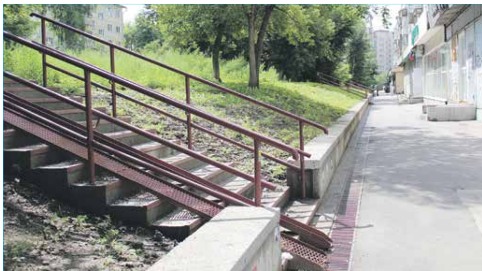
Подпорная стенка, водоотводной лоток и лестница на Котовского, 40