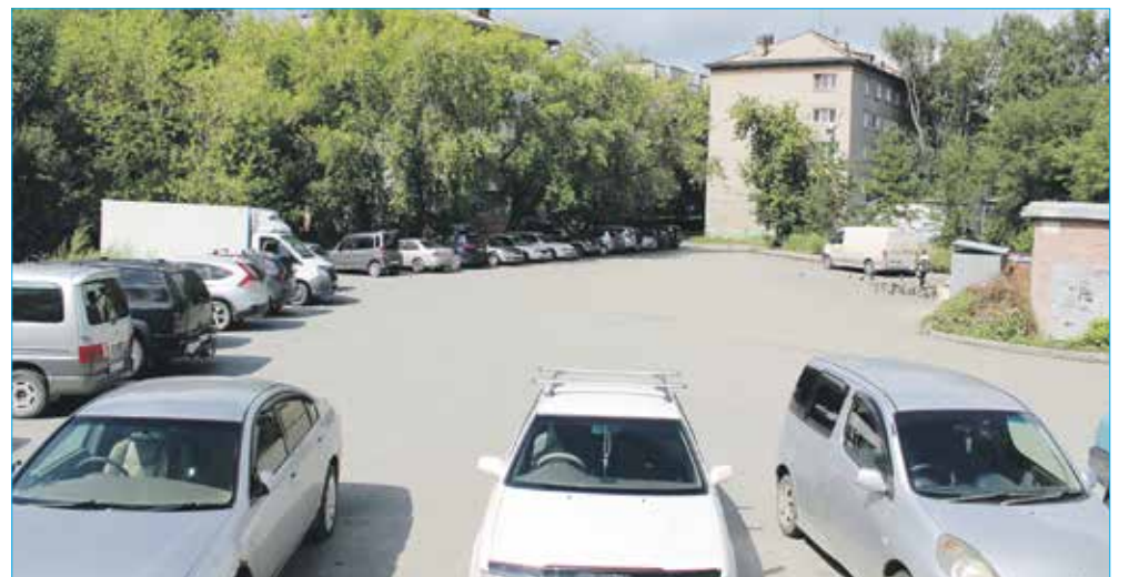
Обустройство парковки между домами по ул. Котовского, 18/1, 20, 24, 28, 18/2