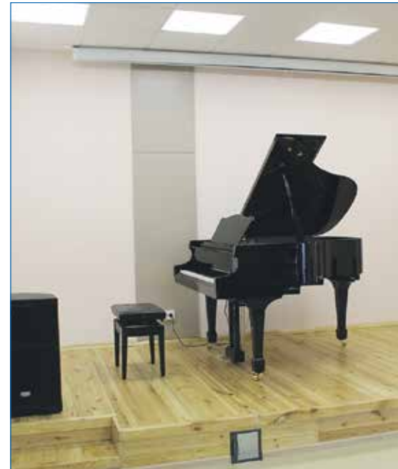
Рояль в филиале детской школы искусств №22 (ул. Широкая, 15)