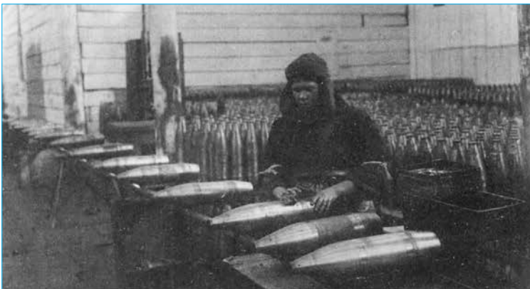
Использование ската в цехе доделочных операций