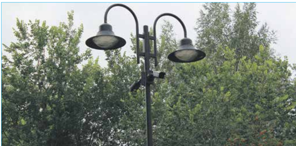
Установленная система освещения и видеонаблюдения в реконструированном Сквере им. Гагарина

Приобретение компьютера и холодильника для помещения ТОС «Дружба» по ул. Ватутина, 4/1