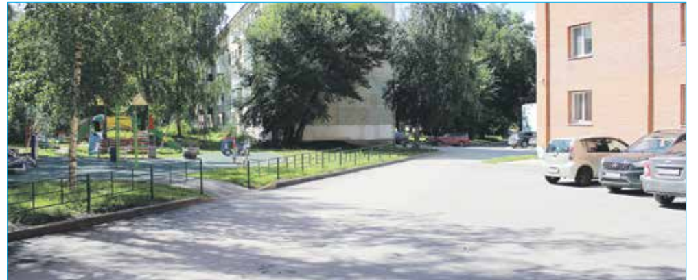
Благоустройство дворовой территории по ул. Пархоменко, 18, 18/1