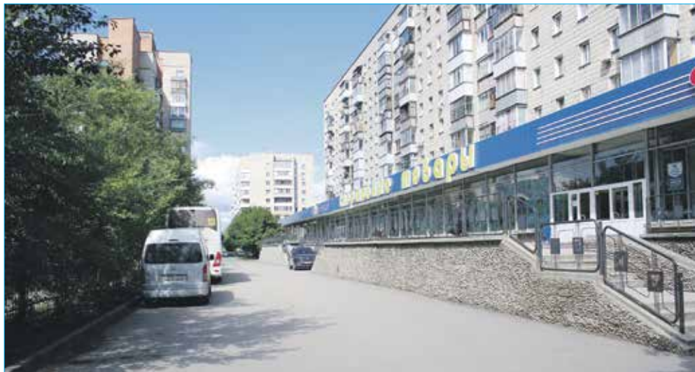
Новый асфальтированный проезд за домом Котовского, 52, (в рамках проекта благоустройства домов ул. Котовского, 36, 40, 40/1, 40/2, 42, 52)

Установка пластиковых окон в здании, спил и обрезка аварийных деревьев на территории детсада №445