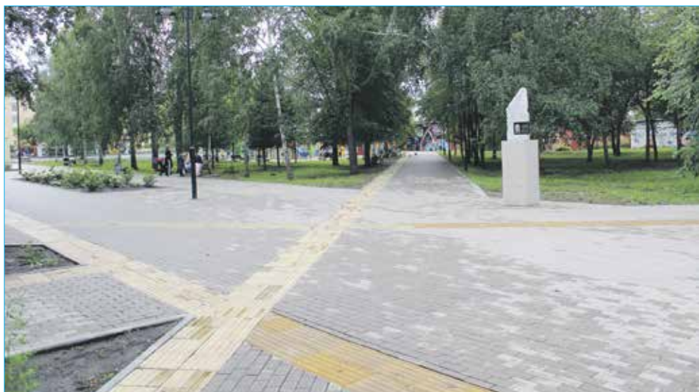
Сквер им. Гагарина после реконструкции