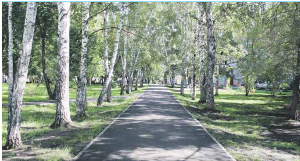
Одна из более чем 20 отремонтированных на территории пешеходных дорожек (ул. Котовского, 28)