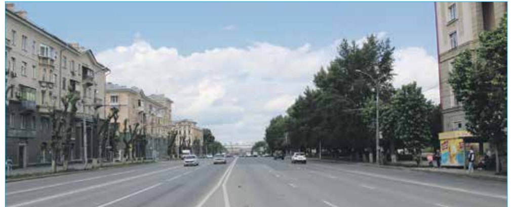
Улица Станиславского после капитального ремонта

Приобретение оборудования и инвентаря для «Школы бокса», Центра спортивной подготовки «Обь» (ул. Станиславского, 6б), ледового дворца «Звездный»