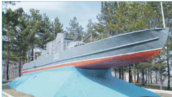
Новосибирский бронекатер БК-302 в Хабаровске