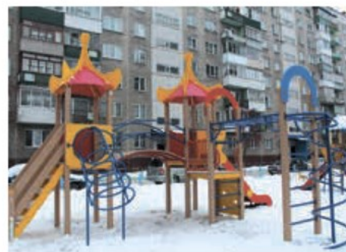
Установка детской площадки, ул. Киевская, 18