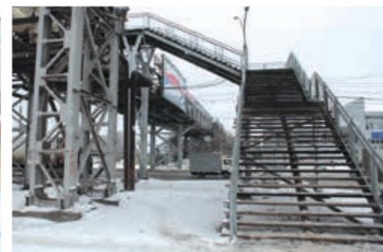
Ремонт ступенек переходного моста на вокзале «Новосибирск-Западный»