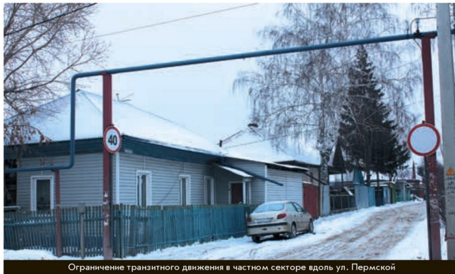
Ограничение транзитного движения в частном секторе вдоль ул. Пермской