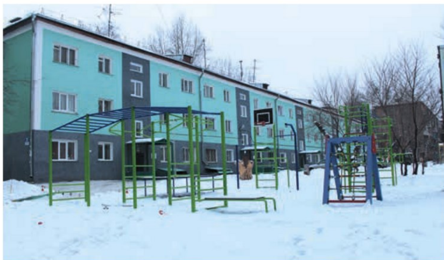
Комплексное благоустройство двора (проезд, парковка, спортивная площадка), ул. Котовского, 11