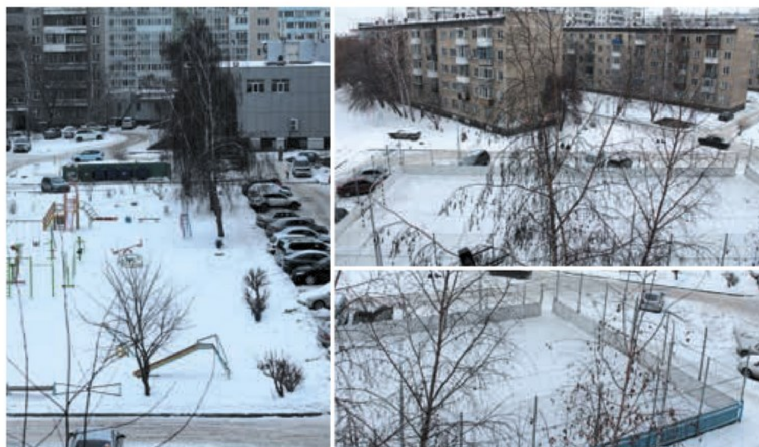
Комплексное благоустройство двора (парковки, площадка, пешеходная дорожка), ул. Киевская, 2