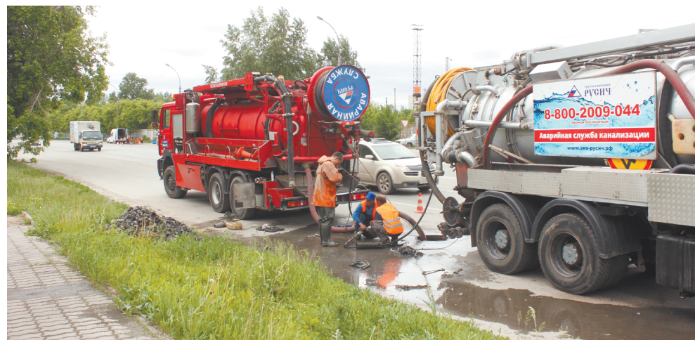
Очистка ливневого коллектора на ул. Широкая