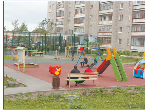
Благоустройство двора по адресу ул. Широкая, 13

• Благоустройство пяти дворов по федеральной программе. В 2019 году по федеральной программе «Современная комфортная городская среда» принято решение о благоустройстве 46 дворовых территорий Новосибирска, из них 5 – в границах избирательного округа (это лишь 1/40 часть города). Адреса: Киевская, 11, 13, 15, Котовского, 17, 1-й пер. Пархоменко, 22, 24, Троллейная, 15, Широкая, 13. Участие в федеральной программе сразу пяти дворовых территорий избирательного округа – это лучший результат по городу в 2019 году.