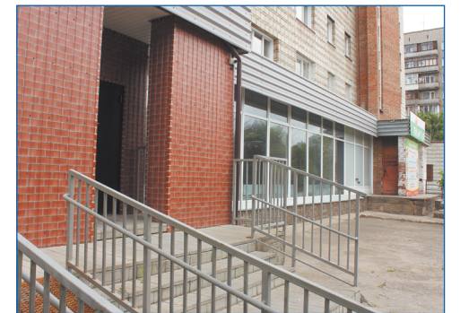
Новый филиал детской школы искусств № 22, ул. Широкая, 15

• Ремонт помещения для нового филиала Детской школы искусств. В 2019 году начались работы по ремонту помещения по ул. Широкой, 15 для открытия там филиала Детской школы искусств № 22. Для исполнения этого наказа потребовалось заблокировать приватизацию помещения, которое могло быть использовано для пивного магазина, и договориться с руководством мэрии города о выделении необходимого финансирования. Начало занятий на отделениях музыкальных инструментов и хореографии запланировано уже на осень 2020 года. ■