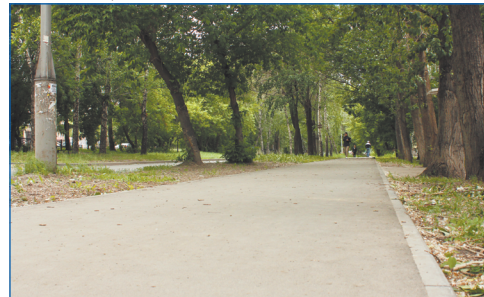
Тротуар на улице Пархоменко (в границах ул. Станиславского и ул. Котовского)