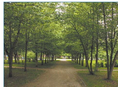
Север им. Ю. А. Гагарина перед реконструкцией