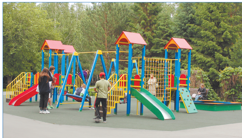
Детская площадка в Сквере Славы

спортивной мини-футбольной площадкой), ул. Плеханова, 74/1 (обустройство резинового покрытия спортивной площадки для сдачи нормативов ГТО), 1-й пер. Пархоменко, 24 (приобретение дополнительных элементов для детской площадки, построенной в 2019 году по федеральной программе)