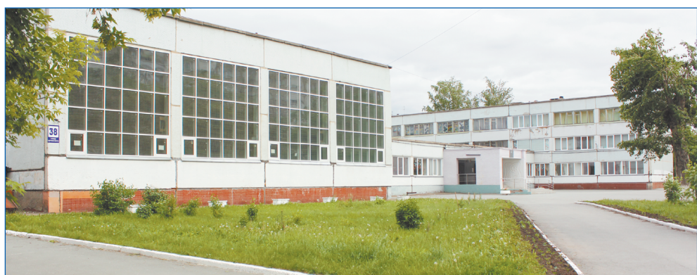
Новосибирская классическая гимназия №17 (ул. Котовского, 38)