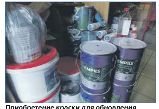
Приобретение краски для обновления ограждения детского сада №123