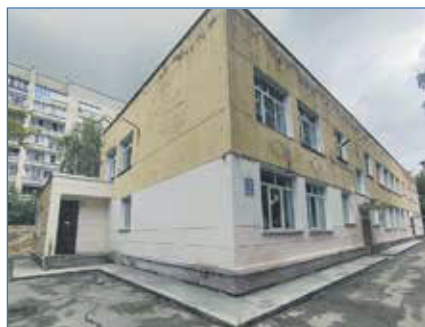
Обустройство новой отмостки детского сада №163