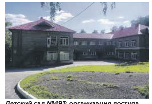
Детский сад №493: организация доступа в интернет