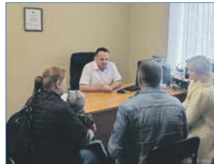
Еженедельный личный приём граждан