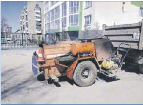
Ямочный ремонт дорог