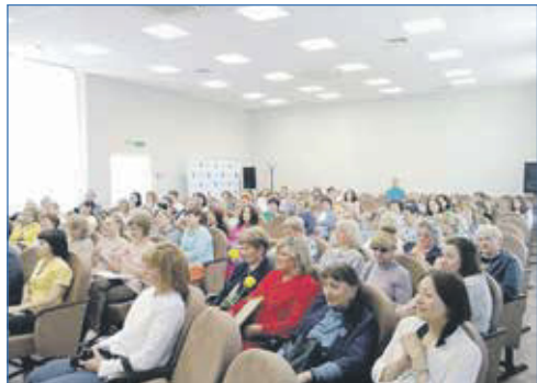
День социального работника