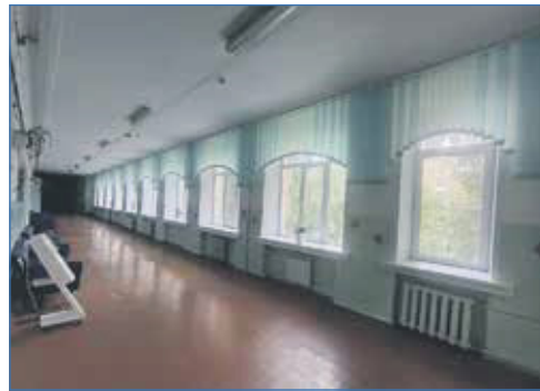
Замена окон, школа №36