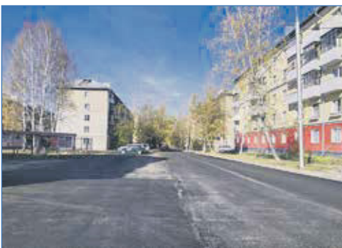
Ремонт улицы Театральная