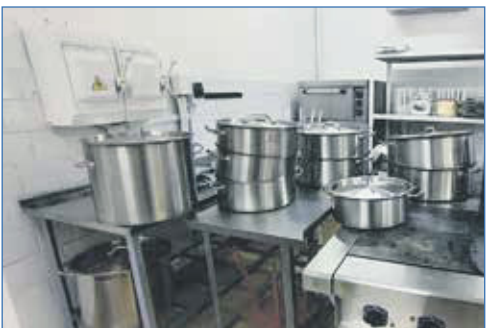
Приобретение посуды для пищевого блока детского сада №163