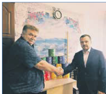
Приобретение краски в РЭУ 76