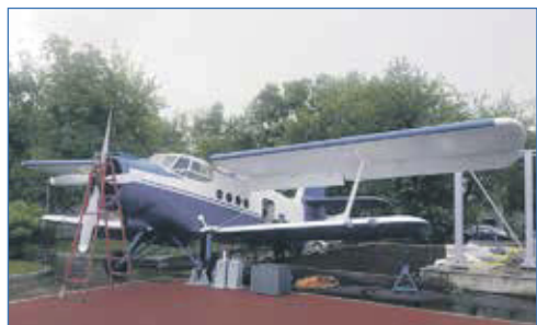
Помощь в реализации проекта по установке самолёта Ан-2 в сквере авиаконструктора Антонова