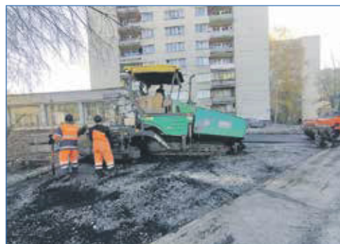
Улица Лазарева, 31а: ремонт двора