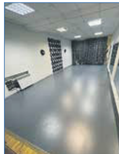
Замена линолеума в Доме культуры «Точмашевец»