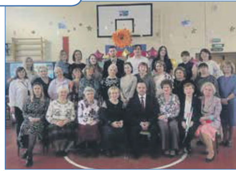
Выпускной в школе №36