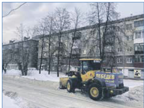
Чистка дорог района