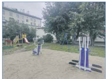
Установка спортивных тренажеров, пр. Дзержинского, 5