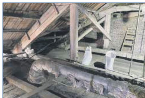
Ремонтные работы по замене утеплителя над 1 этажом ДДК им. М.И. Калинина