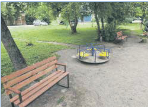
Установка скамеек, ул. Лазарева, 7