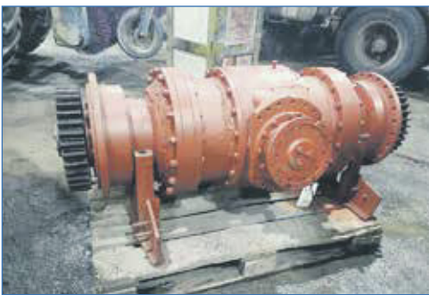
Приобретение редуктора для ремонта грейдера