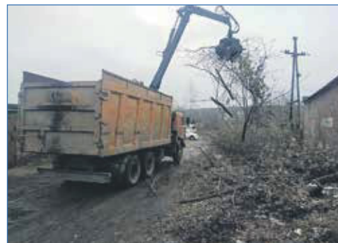
Улица 5-я Рабочая: снос и вывоз деревьев