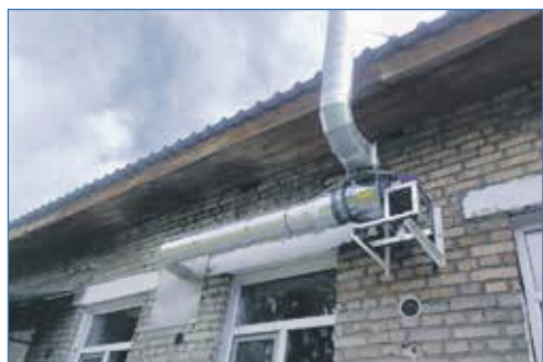
Обустройство приточной вентиляции в детском саду №329