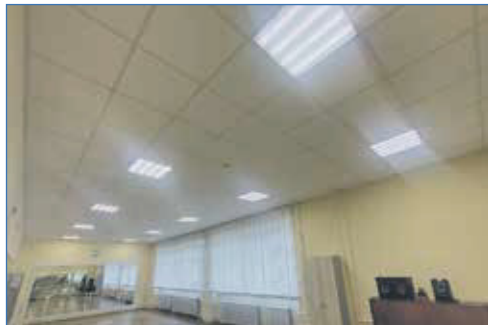
Замена люминесцентных ламп на светодиодные в музыкальной школе №3