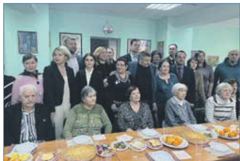
Встреча с Новосибирской городской общественной организацией «Блокадник»