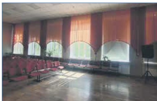
Ремонт актового зала и приобретение жалюзи в школе №153