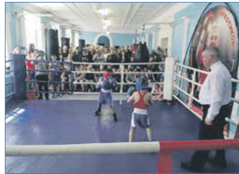
Поддержка школы бокса