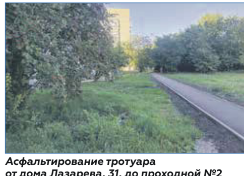
Асфальтирование тротуара от дома Лазарева, 31, до проходной №2 завода им. Чкалова