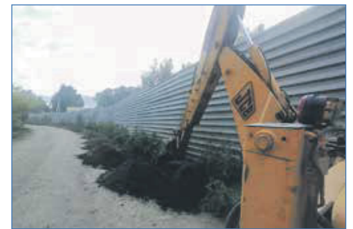
Обустройство водоотводного рва, СНТ «Золотая горка»