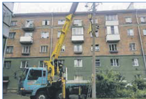
Демонтаж столбов. Улица Давыдова, 26