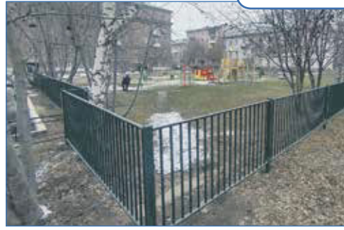
Установка ограждения на придомовой территории, ул. Промышленная, 1а