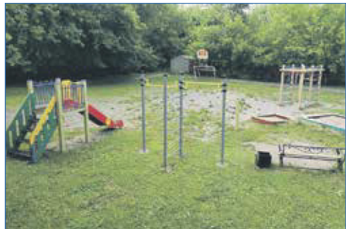
Установка спортивных элементов, ул. Новая Заря, 11