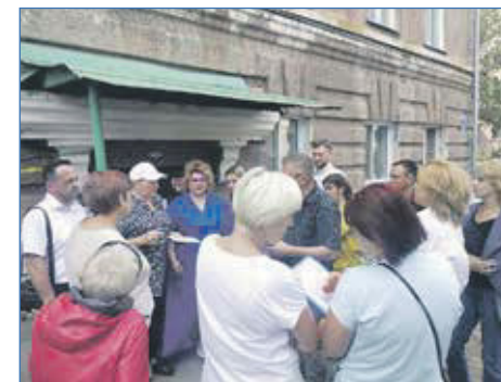
Встреча с избирателями на округе