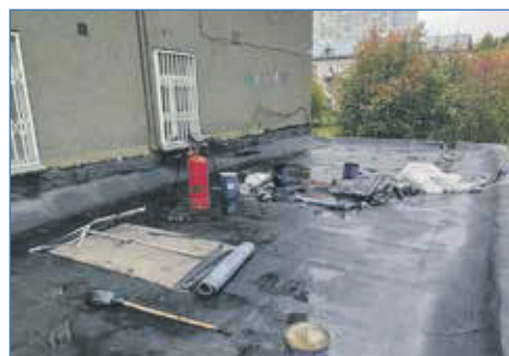
Ремонт мягкой кровли ДК «Точмашевец»