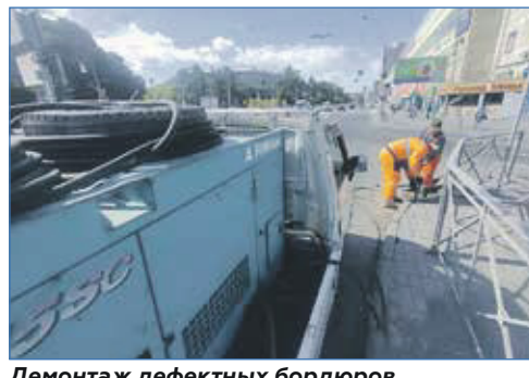
Демонтаж дефектных бордюров на проспекте Дзержинского