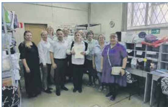
День почтового работника