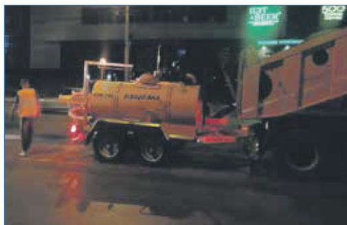
Помощь в приобретении техники для ремонта МКУ «Дзержинка»