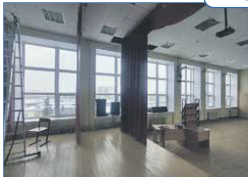
Замена окон в актовом зале школы №111