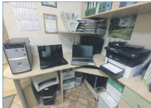
Ремонт оргтехники. Детский сад №163