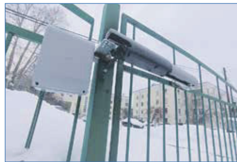
Установка автоматических доводчиков на ворота, детский сад №262