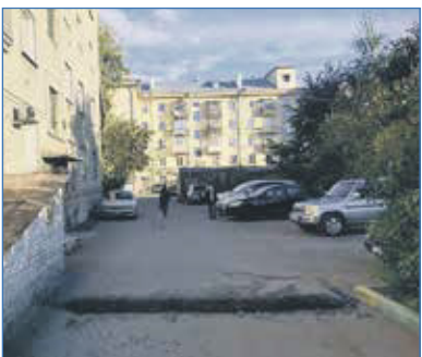
Установка «лежачих полицейских», ул. Королёва, 30