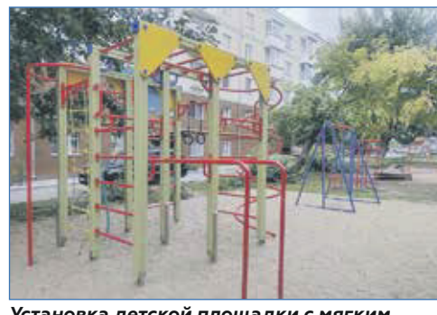
Установка детской площадки с мягким покрытием, ул. Д. Давыдова №№2 и 2а