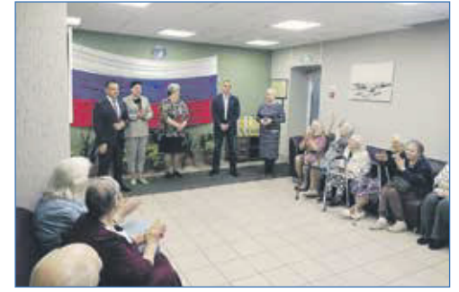
МБУ «Ветеран», помощь одиноко проживающим