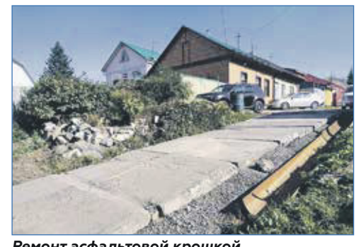
Ремонт асфальтовой крошкой ул. Черноморская