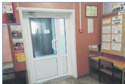
Приобретение и установка двери, Библиотека им. В.П. Чкалова