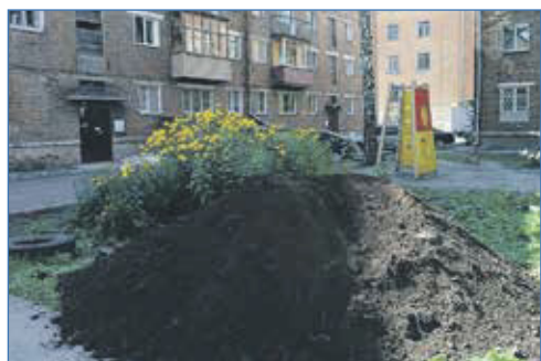
Предоставление грунта по обращениям граждан