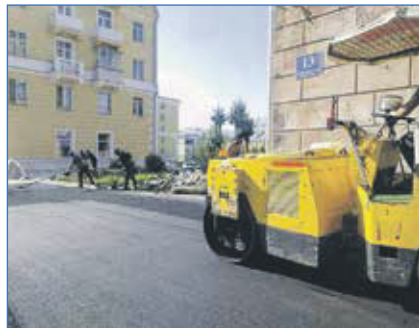
Ремонт тротуара вдоль дома по ул. Авиастроителей, 13