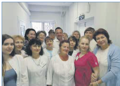
День медика – 2022