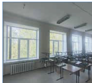
Замена окон в школе №111