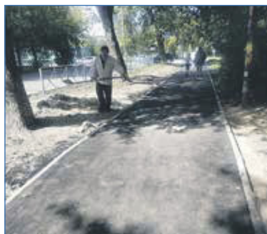
Ремонт тротуара, ул. Королёва, 27