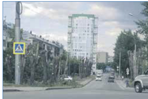
Снос и обрезка аварийных деревьев по ул. Республиканская