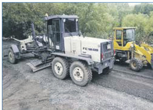
Ремонт дороги в СНТ «Золотая горка»