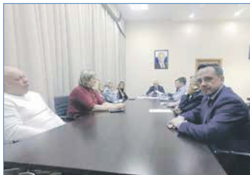
Совещание по строительству школы №57