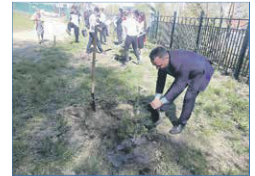
Высадка сосен. Школа №169