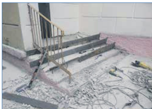
Ремонт крыльца детского сада №163