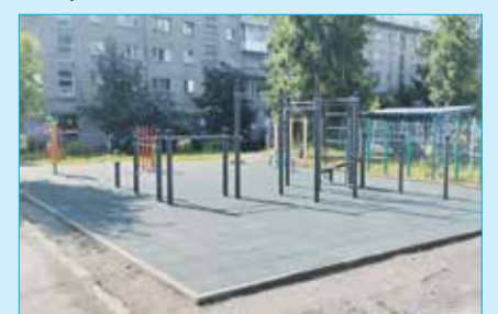
Спортивная площадка ул. Кирова, 114

В минувшие годы была проделана большая работа по благоустройству территорий дворов жилых домов и территорий сектора индивидуальной жилой застройки.