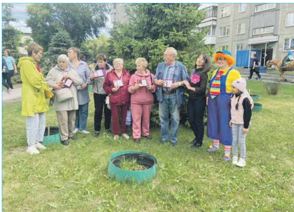
День города на территории микрорайонов

Основные направления наказов избирателей — это благоустройство дворов, межквартальных проездов, улиц, общественных пространств, ремонт и оснащение общеобразовательных, дошкольных