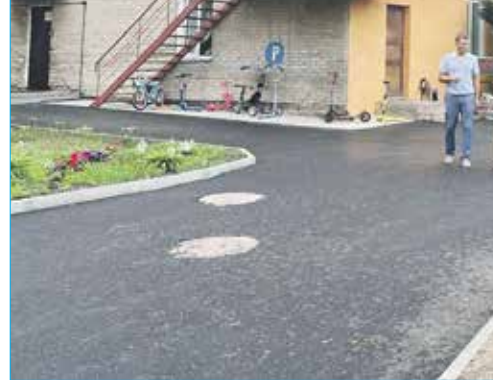
МКДОУ детский сад №504

Более подробная информация о проделанной работе за истекший период представлена в таблицах ниже.