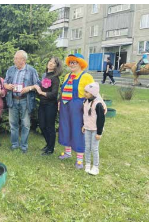
МКДОУ детский сад №504

Выполнена обрезка деревьев вдоль ливневой канализации открытого типа