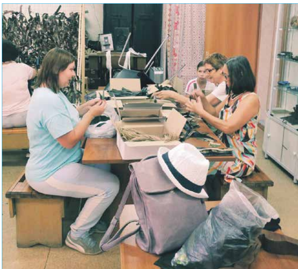
Плетение сетей ТОС 7-ой микрорайон

Не было четкого понимания того, что наиболее актуально и востребовано.