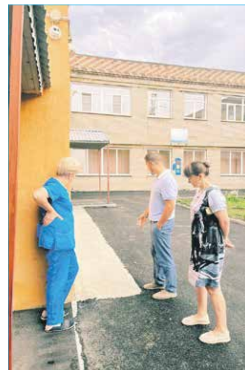
МКДОУ детский сад №504