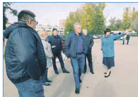
Выездное совещание по вопросу установки знака пешеходного перехода у здания по адресу: улица Тульская, дом 270/2, для безопасности детей, идущих здесь в школы №15 и №187

■ Для МКД Пермская, 57/1, выделены средства на приобретение сеток на спортивную площадку, а также для приобретения посадочного материала для придомовой территории.