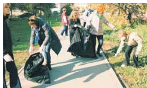
Октябрь 2023 года: учащиеся восьмых «Д» и «Е» классов №50 провели уборку мусора на улице 9-й Гвардейской Дивизии

■ Для МКД Пермская, 57/1, выделены средства на приобретение сеток на спортивную площадку, а также для приобретения посадочного материала для придомовой территории.