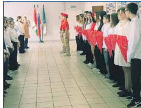
Торжественное мероприятие — посвящение в ряды Российского движения детей и молодежи «Движение Первых» в школе №48

■ По просьбе жителей иницирована установка банкомата банка «Сбербанк» в магазине сети «Пятерочка» по адресу: ул. Титова 198.