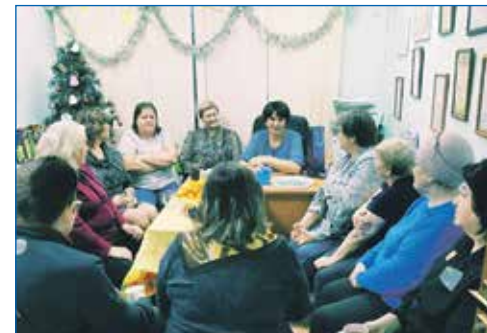
Обсуждение подготовки к предстоящим выборам Президента РФ с активистами округа, членами ТОС и старшими домов

● Приобретена бытовая техника для МКДОУ «Детский сад №432».