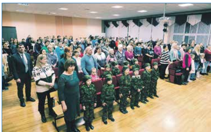
Встреча «От сердца к сердцу»: бойцы СВО передали так много благодарственных писем для помогавшим в сборе гуманитарных грузов, что вместить всех приглашенных смог только зал школы №50