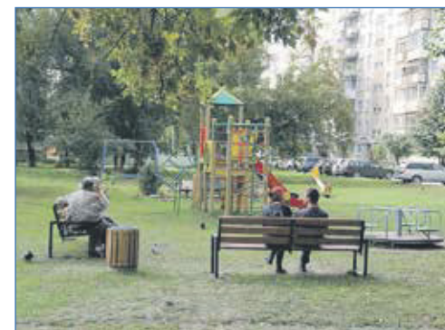
Новая детская площадка на ул. Зорге, 209