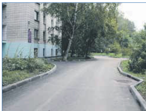
Благоустройство на ул. Зорге, 6, 8, 10