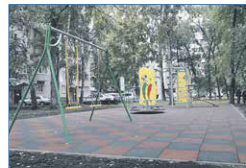
Площадка на ул. Зорге, 207, построена по программе «Территория детства»