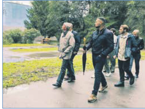
Проверка выполненных работ у кинотеатра «Рассвет»

Проект уже доказал свою эффективность, получил очень хороший отклик у жителей. Сложно сейчас назвать сроки по дальнейшим работам, но то, что реализация этого проекта будет продолжена, не подлежит сомнению.