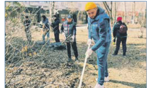
Субботник на аллее Зорге и у памятника Рихарда Зорге депутаты провели вместе с школьниками и активистами ТОС «Рассвет» и «Пограничный»

Нам важно получить информацию из первых рук о том, какие проблемы при организации безопасных условий нахождения детей в школах и детских садах тревожат больше всего, как происходит подбор охраны и как должны выглядеть подходы к учреждениям. Благодаря обратной связи мы вместе со специалистами сможем выработать правильные решения.