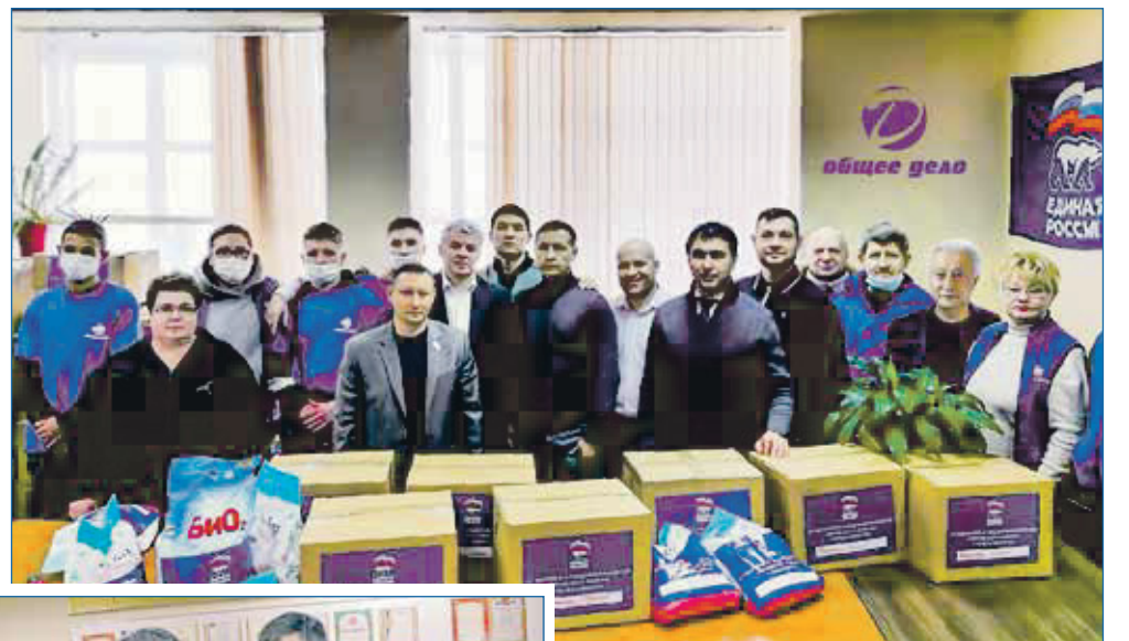
Сбор гуманитарной помощи в Донбасс командой фонда «Общее дело»

— На протяжении многих лет в городе разными субъектами устанавливались детские площадки — начиная от депутатов разного уровня и заканчивая муниципалитетом. И за бюджетные деньги, и за внебюджетные