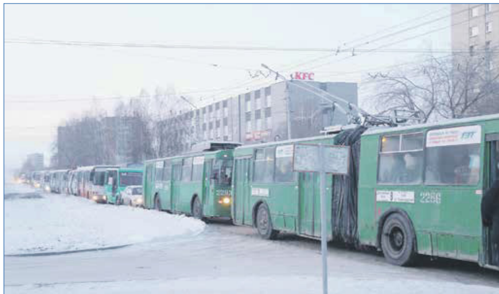
Пробка на выезде с Затулилки

Конечно, можно говорить о расширении проезжей части, выделенных полосах и даже о строительстве метро. Но мы с вами понимаем, что это многомиллиардные затраты! И город в ближайшие годы такую нагрузку